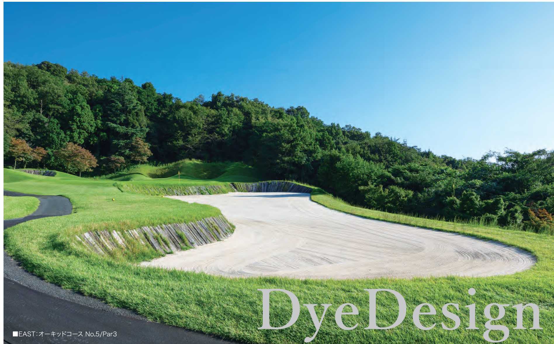
■EAST:オーキッドコース No.5/Par3