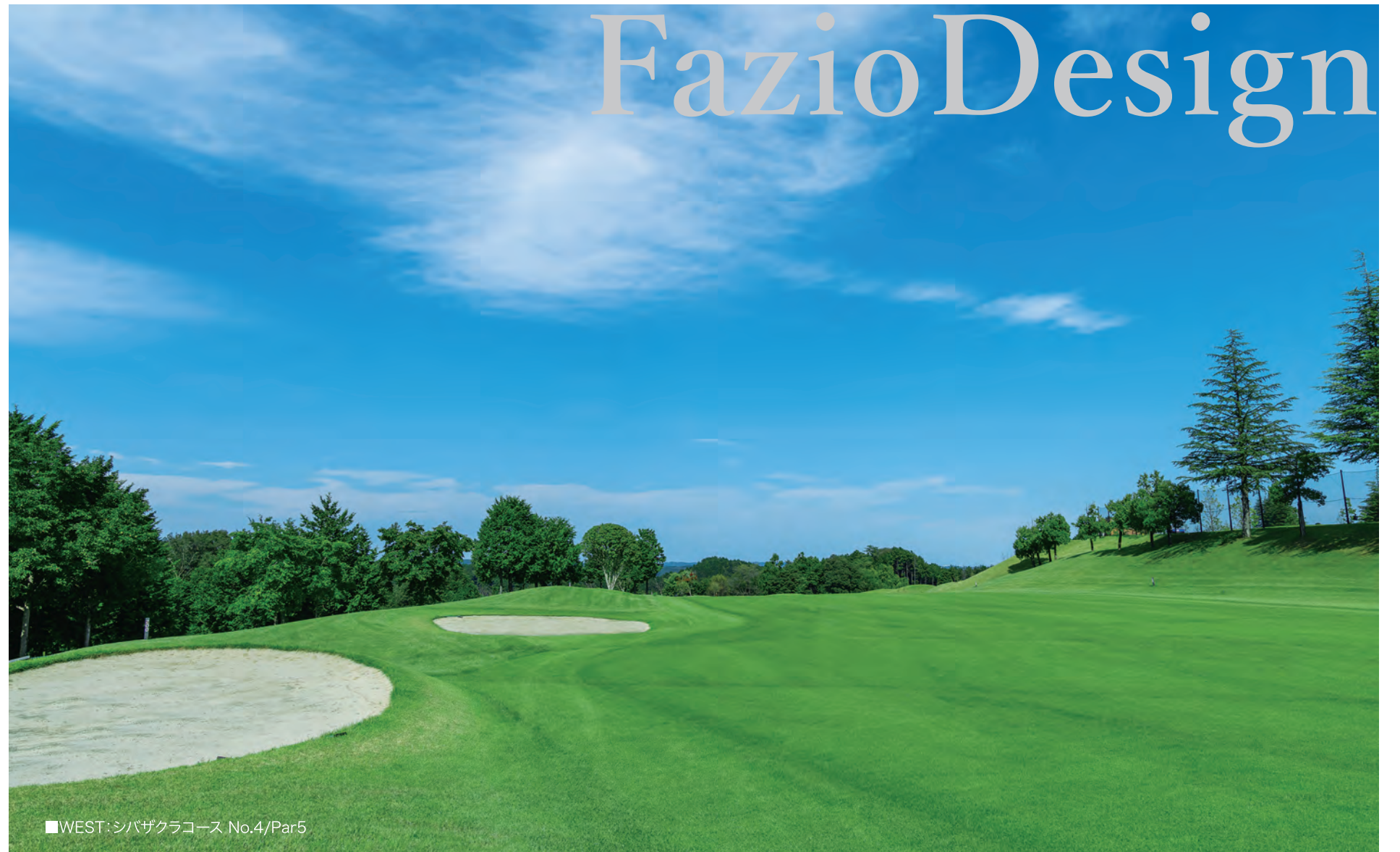
■WEST:シバザクラコース No.4/Par5