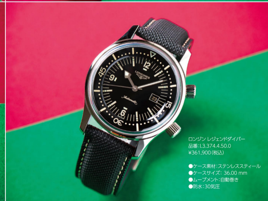
ロンジン レジェンドダイバー 品番:L3.374.4.50.0 ¥361,900(税込) ●ケース素材:ステンレススチール ●ケースサイズ:36.00 mm ●ムーブメント:自動巻き ●防水:30気圧