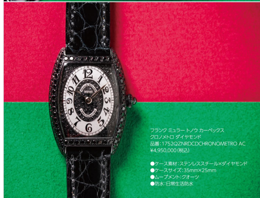
フランク ミュラー トノウ カーベックス クロノメーター ダイヤモンド 品番:1752QZNRDCDCHRONOMETRO AC ¥4,950,000(税込) ●ケース素材:ステンレススチール×ダイヤモンド ●ケースサイズ:35mm×25mm ●ムーブメント:クォーツ ●防水:日常生活防水