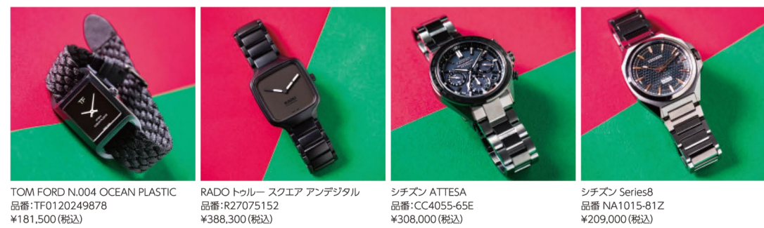
TOM FORD N.004 OCEAN PLASTIC 品番:TF0120249878 ¥181,500(税込) RADO ホルム スクエア アンデジタル 品番:R27075152 ¥388,300(税込) シチズン ATTESA 品番:CC4055-65E ¥308,000(税込) シチズン Series8 品番:NA1015-81Z ¥209,000(税込)

1960年代のダイバーウォッチを再解釈したロンジンレジェンドダイバーは、ロンジンのヘリテージコレクションで特別な存在だ。ロンジンの豊かな歴史を象徴するこのシリーズは、何年にも渡ってゆくりとその存在感を高めている。すべてのモデルがオリジナルタイムピースの精神とクリンなラインを継承しつつ、最新機能を搭載。現代的でありながら歴史に彩られたタイムレスは、コレクションアイテムとして世界中の時計ファンに愛されている。