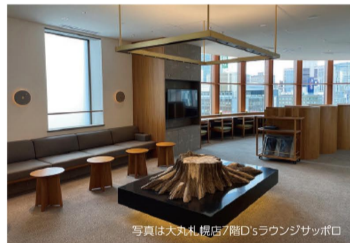
【お客様限定イベント】スペシャルなもの、新しいサービス。お客様だけが味わえる、特別な体験。 【全国の各店お客様サロンをご利用いただけます】お買物のご相談や各種お問い合わせはもちろんです。お買物時のご休憩などにご利用いただけます。※サロンのない店舗もございます。