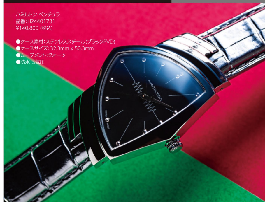
ハミルトン パンテール 品番:H24401731 ¥140,800(税込) ●ケース素材:ステンレススチール(ブラックPVD) ●ケースサイズ:32.3mm x 50.3mm ●ムーブメント:クォーツ ●防水:5気圧