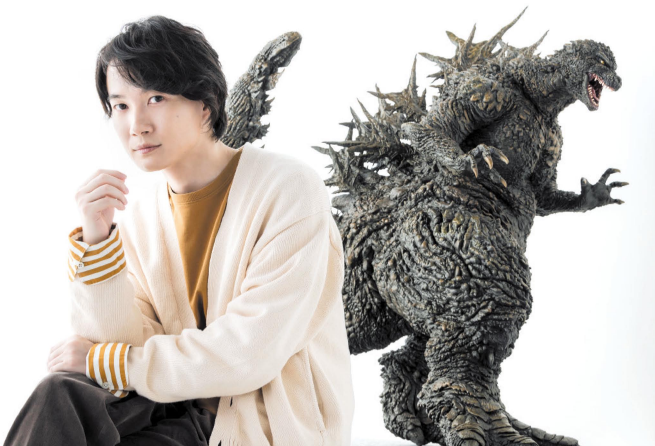
スタイリスト：カワサキ タカフミ ヘアメイク：大野彰宏 (ENISHI)

心が折れるほどの絶望の中でも 「生きて抗う」登場人物たちの姿が 世界中の人々の心に響くように。