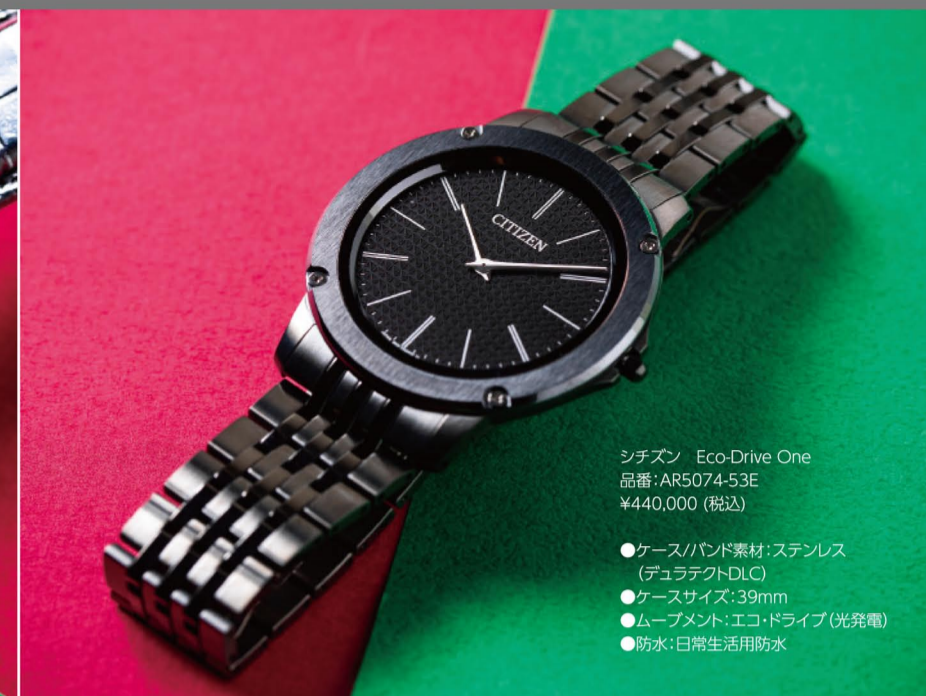
シチズン Eco-Drive One 品番:AR5074-53E ¥440,000(税込) ●ケース/バンド素材:ステンレス(デュラテクトDLC) ●ケースサイズ:39mm ●ムーブメント:エコドライブ(光発電) ●防水:日常生活防水