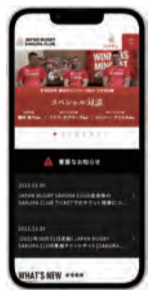
JAPAN RUGBY SAKURA CLUB

日本ラグビー界の多様なサービスをひとつのIDに集約できる新サービス。まずは登録から！