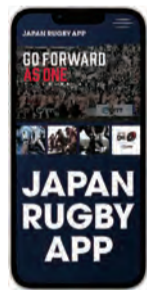
ジャパンラグビー アプリ