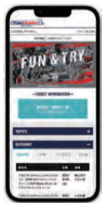
Ticket RUGBY チケットラグビー