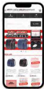
日本ラグビーフットボール協会公式オンラインショップ