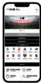
JAPAN RUGBY LEAGUE ONE 公式オンラインストア