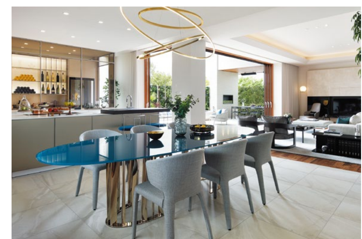
リビングの天井高は最大で3.2m。リビングの先に広がるガーデンラウンジと合わせると78畳に及ぶ大空間となっている。大きな窓で視線が抜けるようにすることで、より広さや開放感を感じられるように設計されている。