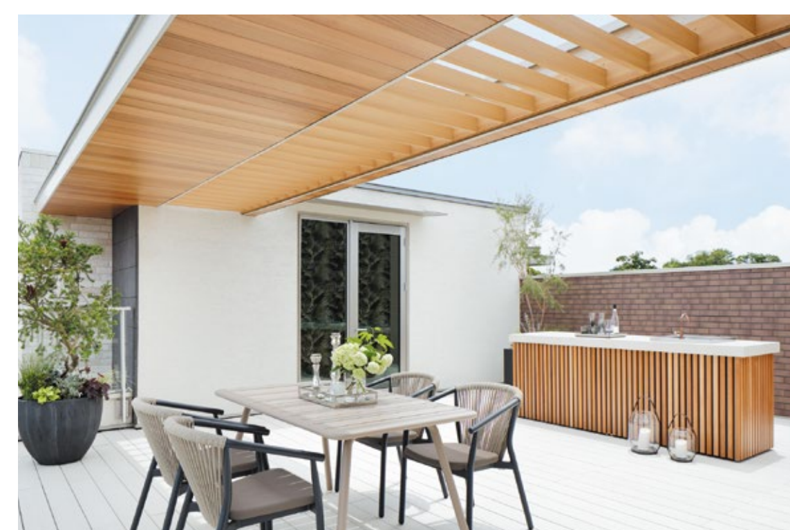
屋上には開放感溢れる屋外空間「スカイライ」が設けられている。家族はもちろん大人数でも楽しめる広さで、リゾート感を味わえる贅沢な空間だ。他にもフィットネスルームやシアタールームなどプライベート空間が充実している。

40年以上の間、木の持つやさしい肌触りやぬくもり、柔らかな感触にこだわったオーダーメイドの住まいづくりで、住む人の感性を満たす住まいをつくり続けてきた三井ホーム。設計・施工までを手掛けた注文住宅事業が同社の中核事業だが、そんな三井ホームには通常の注文住宅とは一線を画す究極のプレミアムブランドがあることをご存知だろうか。三井ホームプレミアムは三井ホームが住まいづくりの技術と叡智を注いで作り上げたエクセクティブブランド。2018年、東京駒沢にプレミアムブランドのモデルハウス「駒沢レジデンス」をオープンしたことを皮切りに、芦屋、世田谷にモデルハウスをオープン。2020年には名古屋、八事にも邸宅と呼ぶにふさわしいモデルハウス「八事レジデンス」をオープンした。 これまで住宅展示場のモデルハウスは、徳田くわいで建設するのが一般的だったという。だが、三井ホームプレミアムモデルハウスは桁違いの予算をかけて建てられており、そのことから通常の注文住宅とはまったくの別物であることが窺い知れる。 一番の特徴は既成概念にとらわれない完全フリー設計の住まいづくりだ。三井ホームプレミアムは建築家が自由に図面を描き、描かれた図面に合わせて一品生産で部材を製作する。それによってミリ単位の調整や斜めの壁、円形空間など、一般的には難しいデザインにも対応することができ、自由に独創的なレジデンスをつくりだしているのである。 そして独創的でラグジュアリーな空間づくりを可能にしているもう一つの要素が三井ホームのオリジナル技術「プレミアム・モノコック構造」だ。枠組壁工法「だ」プレミアム・モノコック構造は屋根・壁・基礎すべてを一体化することで強度を高め、木造では難しい開放的な吹き抜けや大開口を可能にしている。さらに三井ホームは病院、幼稚園、介護施設、店舗施設などの施設建設を手掛けてきた実績があり、そこで培った大規模木造建築のノウハウを邸宅づくりに生かしているのである。たとえば八事レジデンスでは開放感を演出するために、大開口のビル用サッシを階段ホールに採用。住宅用資材という枠組みにとらわれない自由な発想で、資材や素材を選定し、住まいづくりに用いているのである。 他にも、煙を捕らえて木目を際立たせたセラミック（ファムドチェリー）の壁、福島県産の白河石を積み重ねた壁など、三井ホームプレミアムの邸宅には、世界中から取り寄せたこだわりのアイテムが至るところに使われている。タイルにも、床材にも、扉にも空間を彩る一品一品にこだわりがあり、物語が宿っている。だからこそ、住まう人の愛着を育む、特別な邸宅をつくりだすことができるのだ。