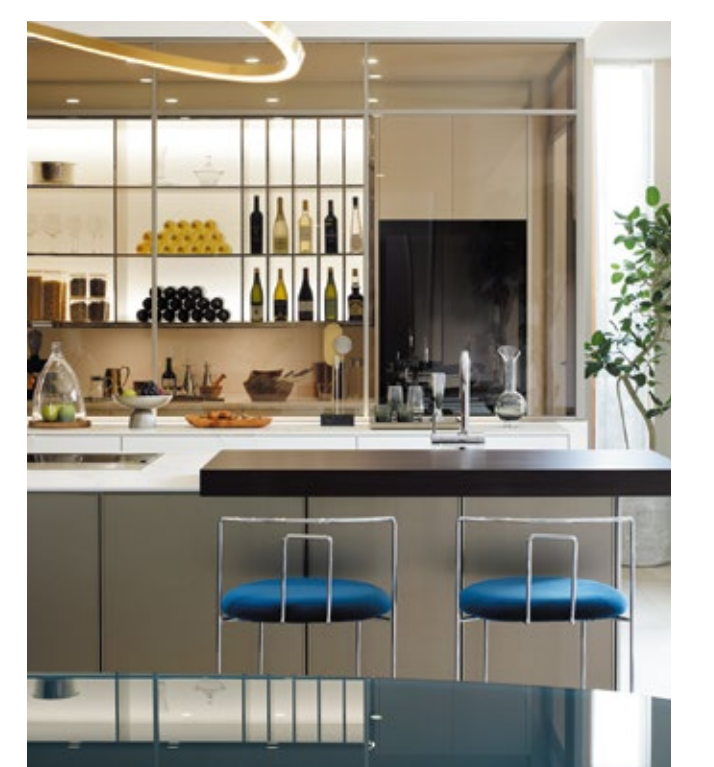
八事レジデンスのキッチンドイツ製の高級オーダーキッチン「シーマティック」を採用。高級キッチンがラグジュアリーな空間にマッチする。