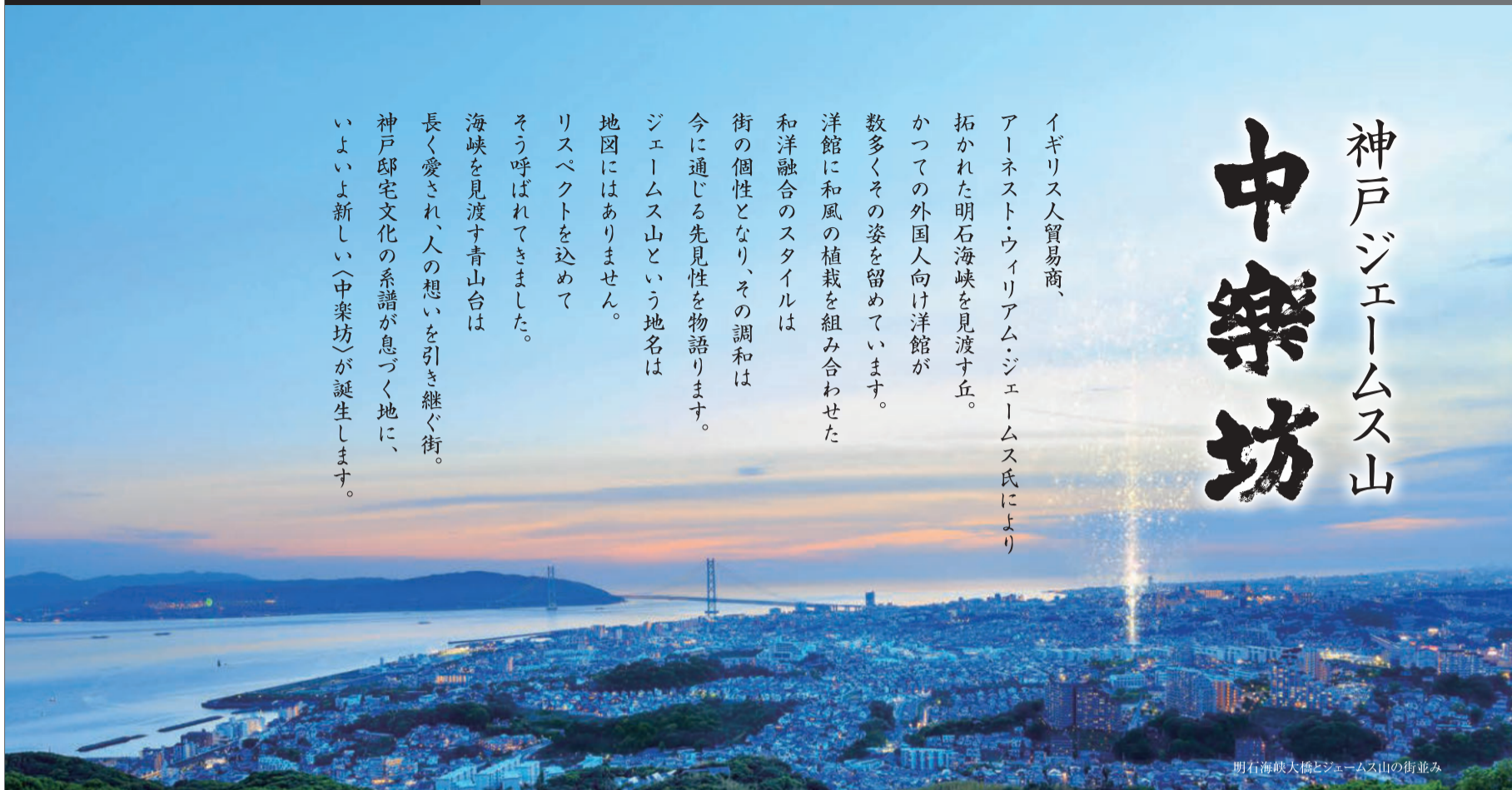
明石海峡大橋とジェームス山の街並み