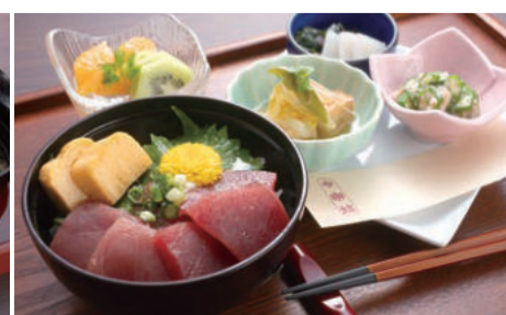
夜の目替わり定食