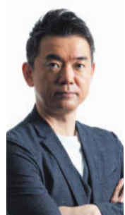
元大阪府知事・元大阪市長 橋下 徹氏

1月の大阪に続き、東京でも本誌主催セミナーの開催が決定。全3部構成で、第1部の講師は元大阪府知事・元大阪市長の橋下徹氏。インフラと円安が進む日本経済で経済再生の鍵を握る地域経済の未来について、メディアでは明かせない本音や裏話も交えて鋭く読み解く60分。第2部は、人気ファイナンシャルプランナーの黒松雄平氏が経済とマーケットを解析。ポテンシャルから見た投資の魅力とともに、好機を生かすための資産形成ノウハウを伝授する。セミナー終了後は、株式会社プレサンスコーポレーションのコンサルタントが不動産投資の始め方や疑問不安に答える個別相談会も実施予定だ。参加無料。