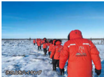
氷の上をハイキング