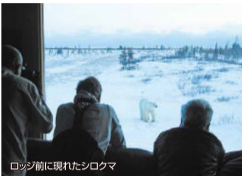
ロッジ前に現れたシロクマ