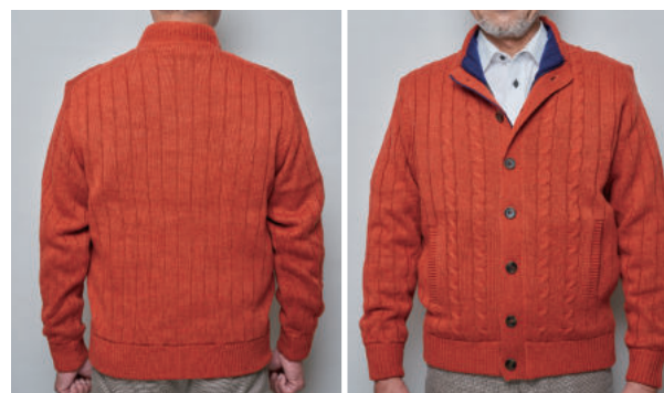
モデル着用サイズ/L

サイズ/S・M・L・LL 表地/アクリル 裏地/ポリエステル(エンボス加工) 背裏地/ポリエステル(帯電防止タフタ)