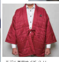
モデル着用サイズ/L・LL