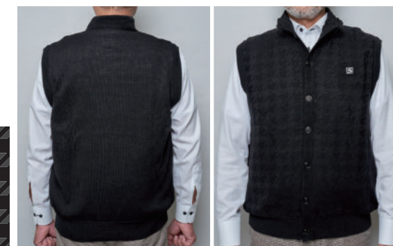
モデル着用サイズ/L