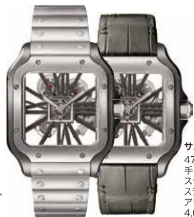
サントス ドゥ カルティエ 47.5×39.8mm 手巻き (Cal. 9611 MC) ステンレススティール ステンレススティールブレスレット、 アリゲーターストラップ各1本 4,092,000円(税込)