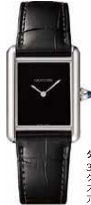
タンク マスト 33.7×25.5mm クォーツ ステンレススティール アリゲーターストラップ 418,000円(税込)