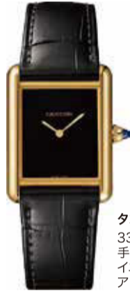
タンク ルイ カルティエ 33.7×25.5mm 手巻き (Cal. 1917 MC) イエローゴールド アリゲーターストラップ 1,742,400円(税込)