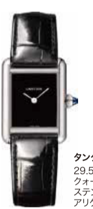
タンク マスト 29.5×22mm クォーツ ステンレススティール アリゲーターストラップ 396,000円(税込)