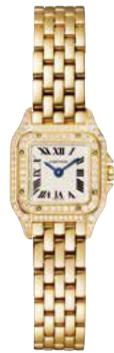
Antoine Pivdori © Cartier

パンテール ドゥ カルティエ 30×22mm クォーツ ステンレススチール、ダイヤモンド ステンレススチールプレスレット 1,161,600円(税込)