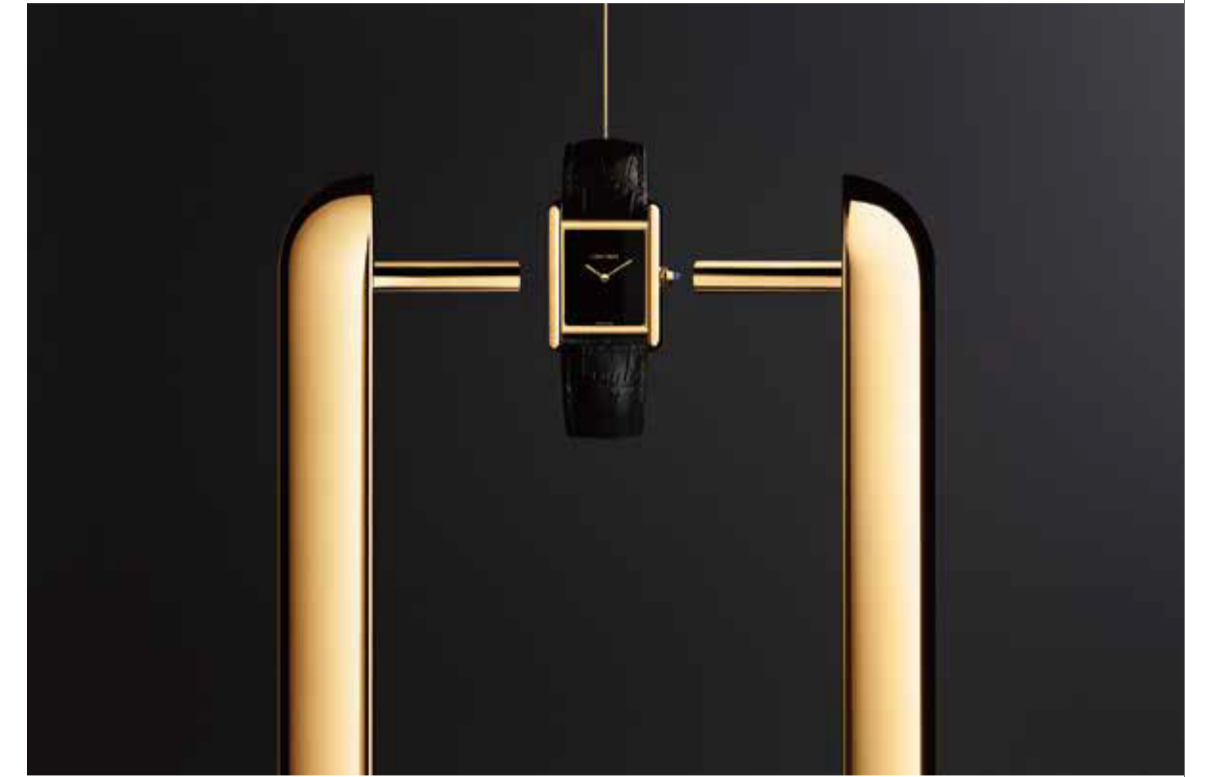
Paul & Henriette © Cartier

単に計測する対象ではなく、自らに寄り添うもの。大切なのは、今、この瞬間、この場所。いわば、時間は、「今」を自分らしく、有意義に過ごすためにこそ使うものなのだ。その時の哲学を秘めて、カルティエは、1世紀以上をかけて、時間という千変万化であり、タイムレスで実態のないものを独自のスタイルのタイムピースへと昇華してきた。それは、絶えず可能性の限界、美的感覚の限界、アイデンティティの限界への挑戦となる。まさに、カルティエの腕時計は、メゾンの創造性と卓越した技の結実。身に着ける人を鼓舞し、人生のステップアップに寄り添うパートナーとして、これ以上ふさわしい存在はないだろう。