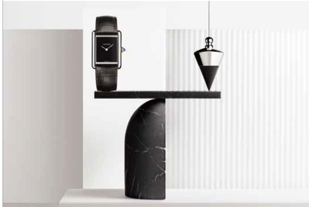
Paul & Henriette © Cartier