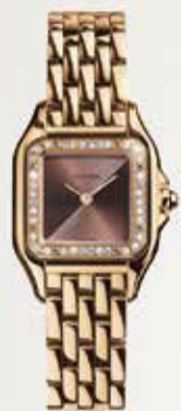
Iris Velghe © Cartier

世界中のロイヤルファミリーや各界のセレブリティを虜にしたカルティエのクリエイション。誇り高きハイジュエラーとして、芸術的なジュエリーウォッチの数々が歴史を彩ってきたことも忘れてはならない。なかでも、1914年に初めて時計として誕生した「パンテール」のデザインは造形の美しさに止まらず、自由を愛し、時代の先をゆく女性たちの代名詞となっていた。最初に「パンテール」の異名を持ち、パリジエヌの憧れを集めたのは、男性中心の社会で、メソンのクリエイティブ・ディレクターとして活躍したジャンヌ・トゥーサン。その後、抜群のセンスと大胆な行動で魅了したウィンザー侯爵夫人や、パリのファッションアイコンとして注目を集めたティージー・フェロウらが名を連ねる。強い眼差しに、しなやか