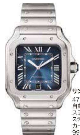
サントス ドゥ カルティエ 47.5×39.8mm 自動巻き (Cal. 1847 MC) ステンレススティール ステンレススティールブレスレット、 カーフスキンストラップ各1本 998,800円(税込)