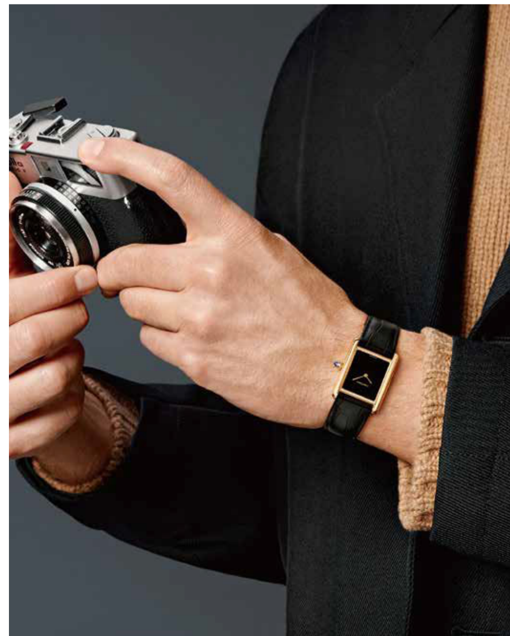
Matthieu Lavanchy © Cartier

「タンク」のデザインを、1920年に再解釈したものだ。縦枠を細くして角を丸くし、ケースを伸ばしたウォッチが特徴で、実際にルイ・カルティエが愛用していたことも有名である。今年注目したいのは、漆黒の文字盤。同じ漆黒の文字盤は、「タンク マスト」の新作にもお目見えした。昨年「タンク ルイ カルティエ」を踏襲し、刷新されたシンプルでデザインにブラックカラーがよく映える。