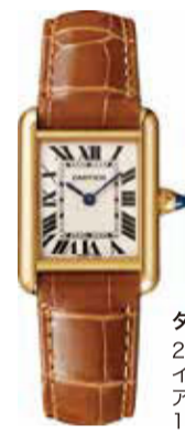
タンク ルイ カルティエ 29.5×22mm クォーツ イエローゴールド アリゲーターストラップ 1,306,800円(税込)

「Less is More」少ない方が豊かである。「ミニマルデザイン」の考え方を体現するよう、削き落とされたデザインが魅力の「タンク」。すべての色を包括するブラックカラーの文字盤には、インデックスもなく、時間束縛されず、自分らしさを謳歌するというメッセージが込められているようだ。最大の魅力はジェンダーレスな佇まい。サイズ感やケースの薄さでも性別を問わず似合うものだ。「タンク」の薄さでも性別を問わず似合うものだ。「タンク」の薄さでも性別を問わず似合うものだ。「タンク」の薄さでも性別を問わず似合うものだ。