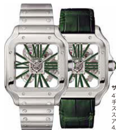
サントス ドゥ カルティエ 47.5×39.8mm 手巻き (Cal. 9611 MC) ステンレススティール ステンレススティールブレスレット、 アリゲーターストラップ各1本 4,092,000円(税込)