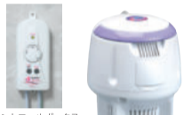
コントロールボックス 本体 スタンドトレー

お風呂に浮かすだけでマイコン制御によりお好みの湯加減に保温し、湯水だけ清潔に循環・浄化することも。