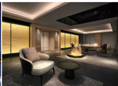
ラウンジ完成予想CG