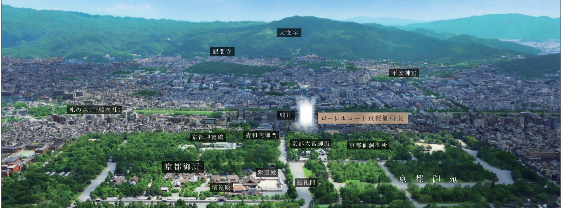
※掲載の空撮は、現地周辺を撮影(2021年8月)したものにCG処理を施して描いたもので実際とは異なります。また、現地の光は建物の規模、高さを表したものではありません。予めご了承ください。 ※1.大丸...2580m ※2.高島屋...2180m ※3.新風館...2250m ※4.セスト御池...1290m ※5.新京極商店街...1750m ※6.錦市場商店街...2160m