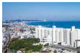
新島の空撮写真

三崎港直送マグロが食べ放題の贅沢! 三浦半島の名リゾートホテルが 30周年のアニバーサリーイヤー!