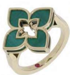
K18YG マラカイトリング 396,000円(税込)