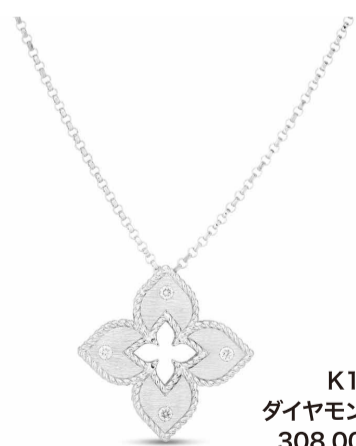
K18WG ダイヤモンドネックレス 308,000円(税込)

人気の高まりを受けて、先ごろ「大丸東京店」で同店初となるPOP UP SHOPを開催。今年の最新作をはじめ、世界的な人気ライン「プリンセスフラワー」など、多様なコレクションを心ゆくまで堪能できる。期間中は特別なプレゼントも用意されているので、ぜひお早めに。