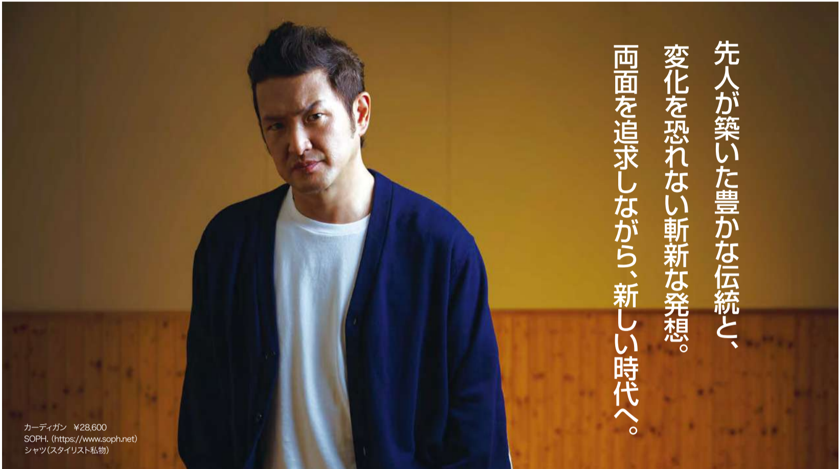
カーディガン ¥28,600 SOPH. (https://www.soph.net) シャツ(スタイリスト私物)

企画・制作 / 株式会社ディリースポーツ案内広告社 〒110-0015 東京都台東区東上野4-8-1 TIXTOWER UENO 14F © 2022 DAILY ADVERTISING AGENCY CO.,LTD