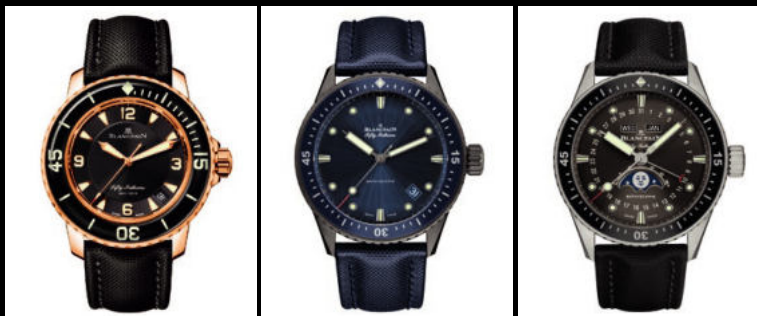
フィフティ ファゾムス オートマティック

自動巻き/ピンクゴールドケース(直径45mm)/300m防水/パワーリザーブ約120時間/3,542,000円