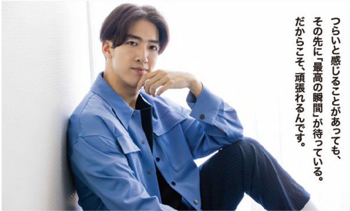
スタイリスト: 三島利志(Tatami)

広告掲載に関するお問い合わせ先 TEL:03-6854-7001 FAX:03-6854-7005 企画・制作/株式会社アイリスオーパス東京本社 〒110-0015 東京都台東区上野4-1-1 TEL:03-6854-7001 FAX:03-6854-7005 © 2021 DAILY ADVERTISING AGENCY CO., LTD