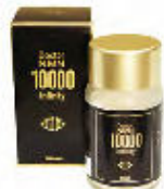
Doctor NMN 10000 Infinity 72,000円(税込)

昨年3月、厚生労働省が非医薬品リストに新規追加したのを機に、一気に脚光を浴びたNMN。現在はまださまざまな商品が発売されているが、その代表例のひとつとして注目を集めるのが「ドクターNMN 10000 Infinity」だ。 池袋東口をはじめ東京都内にも展開する「まめクリニック」代表の石川雅俊医師が監修した国内生産のサプリメントで、何と99%以上という高純度なNMN原料を配合。