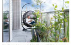
最上階を自宅にすれば、「空に浮かんだ平屋住宅」のような暮らしが可能に。また、最上階やテラスなど、一般的な2階建て住宅では得られない設計も可能となる上、低層階の収益性というボーナスも、「人生が変わる」と言っても過言ではないほどの設計を実現できる。

賃貸併用住宅の魅力は、収入を得ながら安心して暮らせることです。3階建てより5階建ての多層階住宅を建設し、その一部を賃貸として提供することで、購入者は賃貸収入を得ながら、将来的に資産価値を高めることができます。 また、賃貸収入は、購入者の生活費やローンの返済に充てることができます。これにより、生活費の負担を軽減し、将来的な資産形成を促進することができます。