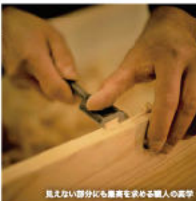
見えない部分にも美意識を求める職人の実作

1 仙台箆筒 数足チェスト(朱色漆塗り) 仙台箆筒の伝統スタイルを踏襲した美しいデザイン、伝統的な朱色漆塗りが施してありコンパクトながら存在感のある箆筒だ。アクセント家具として高い人気があり、玄関ホールや床の間にぴったりの箆筒となっている。 【規格・容量】巾83×奥37×高65cm 【国内産】