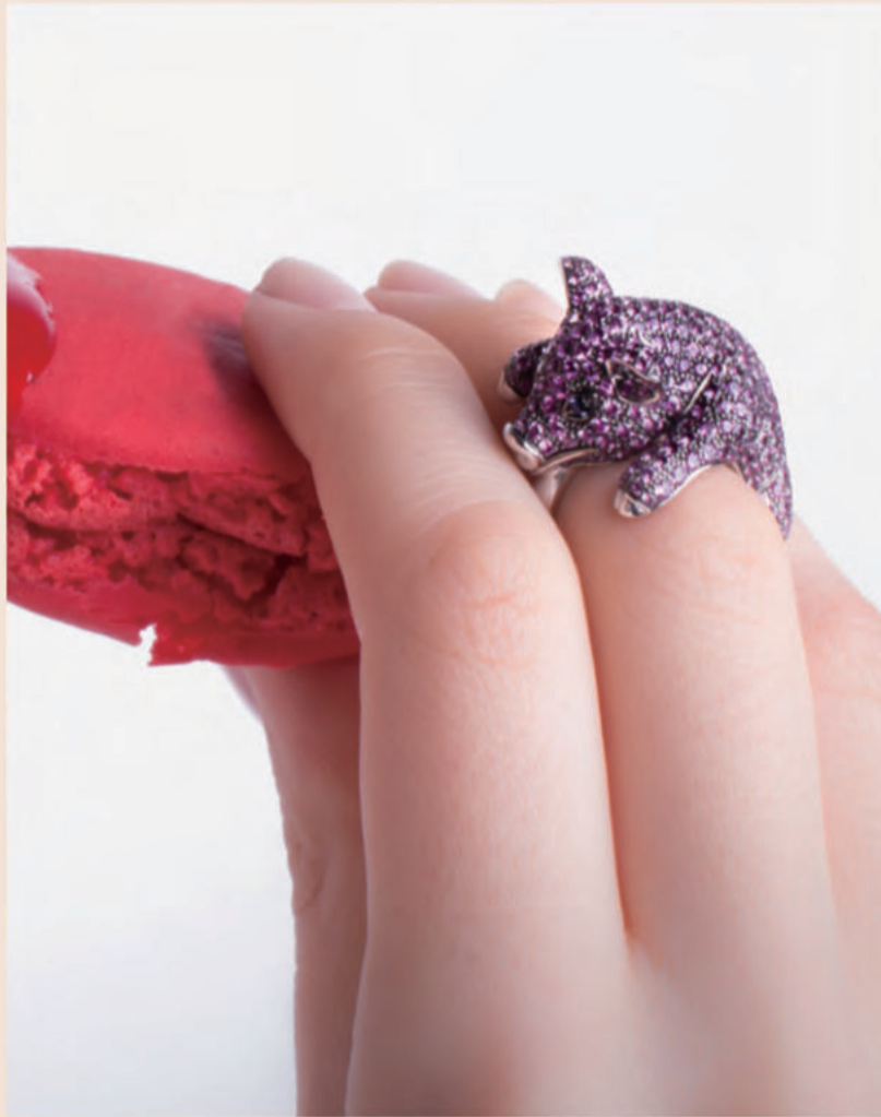
アニマリエ ANIMALIER - COLLECTION -

80年代に登場して以来、精巧さと創造性で世界を魅了するANIMALIERコレクション。モチーフとなる動物たちの身体的な構造や動作の特徴を研究し尽くし、まるで彫刻作品のように「今にも動き出しそうな姿」をジュエリーで表現するという、イタリア職人の技術の高さを雄弁に物語るミニチュアモデル。親しみやすいファーストインプレッションながら細部は極めて複雑で、実物に迫る羽や鱗は弾力性を味わえるなど、装飾品を超えた楽しみも。現在は、現実世界の動物から架空の生き物へと想像力の翼を広げている。