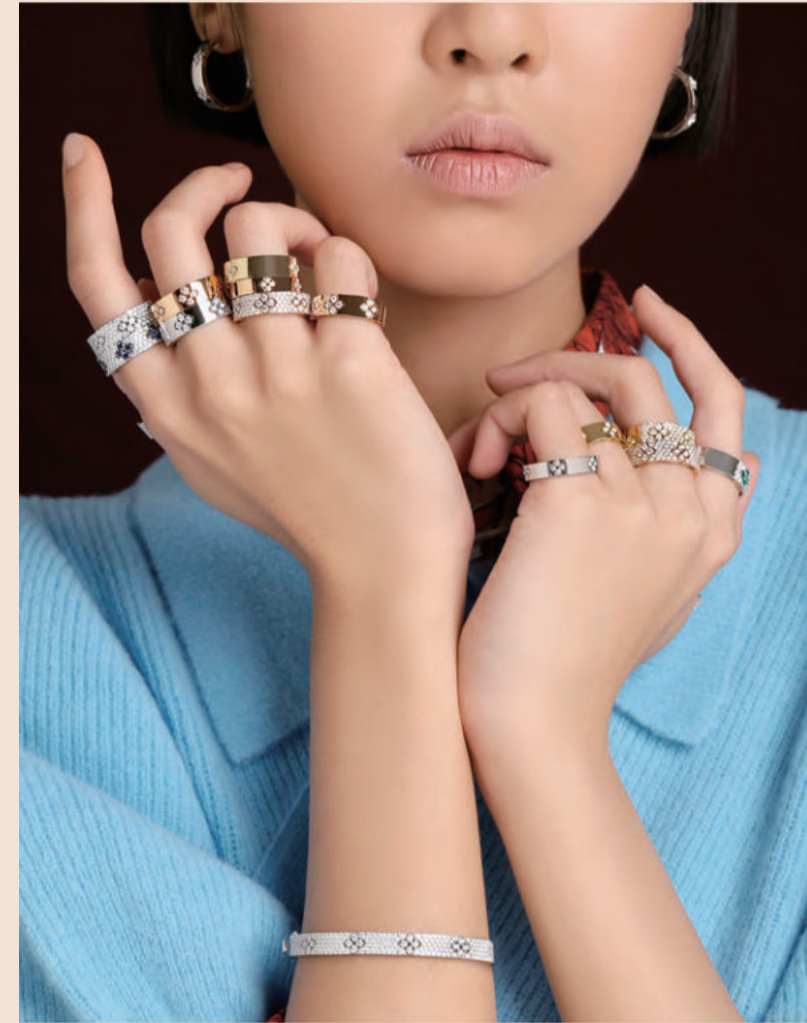
ラヴィンヴェローナ LOVE IN VERONA - COLLECTION -

伝統の水玉模様を守旧的なロマン主義から解放し、自由奔放なスタイルへと再構築。ゴールドを生地のように扱う過激なデザインから始まったPOIS MOIは、やがて豪華を極めたダイヤモンドのパヴェで装飾するという強烈なモダニズム表現に成功。この記憶に残る2種のエディションの後、2018年に発表されたLUNAバージョンではさらに一転し、意表を突くレトロフューチャーな思想を導入。表面にはゴールドで作られたクレーターをあしらひ、その凹凸が一度見たら忘れない意匠性を作り出している。