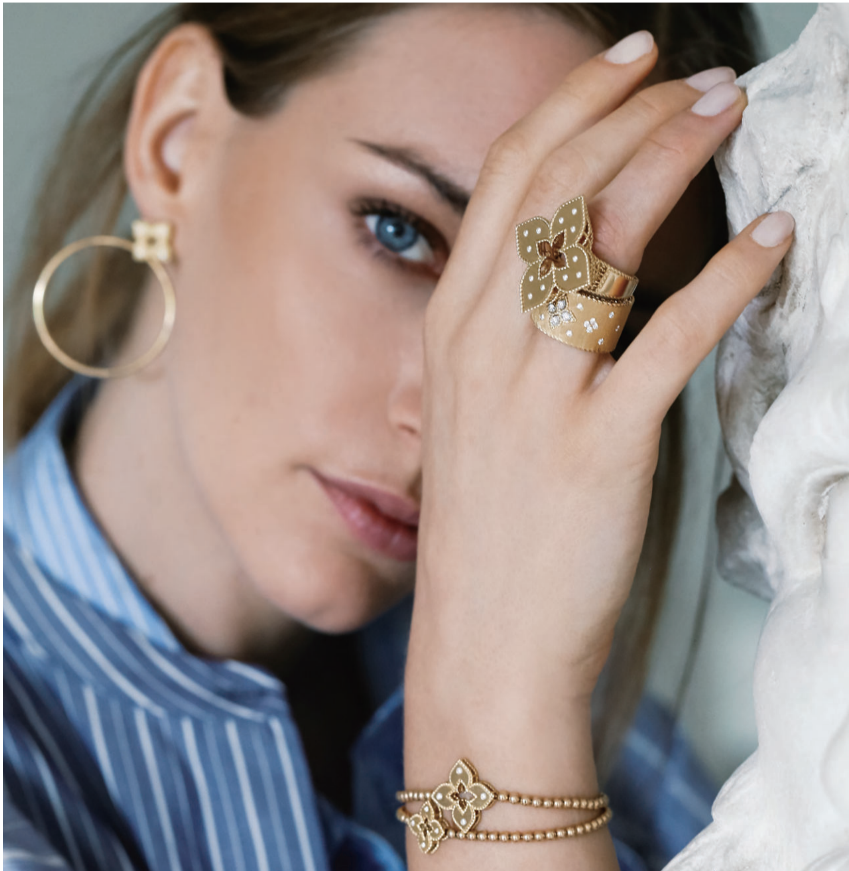
※画像はイメージです。 ※掲載した商品は店舗にない場合がございます。予めご了承ください。

企画・制作 / 株式会社デイリースポーツ案内広告社 〒110-0015 東京都台東区東上野4-8-1 TIXTOWER UENO 14F © 2021 DAILY ADVERTISING AGENCY CO.,LTD