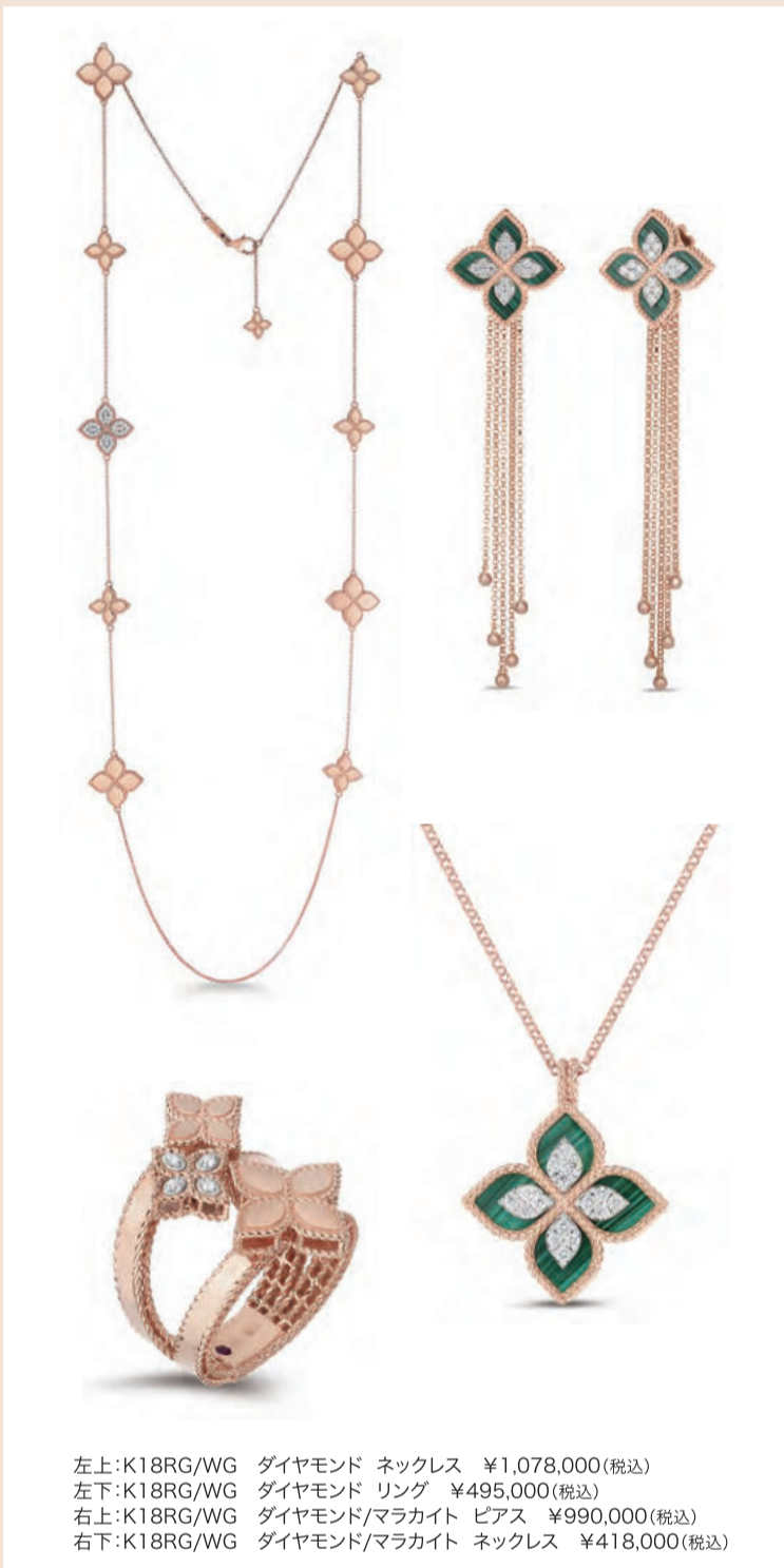
左上:K18RG/WG ダイヤモンド ネックレス ¥1,078,000(税込) 左下:K18RG/WG ダイヤモンド リング ¥495,000(税込) 右上:K18RG/WG ダイヤモンド/マラカイト ピアス ¥990,000(税込) 右下:K18RG/WG ダイヤモンド/マラカイト ネックレス ¥418,000(税込)