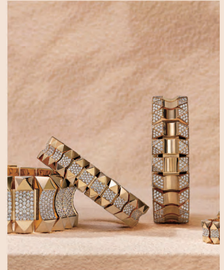
ロック&ダイヤモンド ROCK & DIAMONDS - COLLECTION -

イタリアの都市にインスピレーションを得たジュエリーコレクション。『ロミオとジュリエット』の舞台ヴェローナは、1930年以来、悲劇のヒロインに届き続けるラヴレターを管理するジュリエットクラブの本拠地。実際に女性たちが返信を送るという「愛の街」への敬意は、ROBERTO COINが得意とするダイヤの花弁で見事に表現。同じモチーフが繰り返してリピートされる処理は同地の宝である古代ローマの円形闘技場へのオマージュで、美しい鏡面とサテン仕上げによる3色のゴールドの美を際立てている。