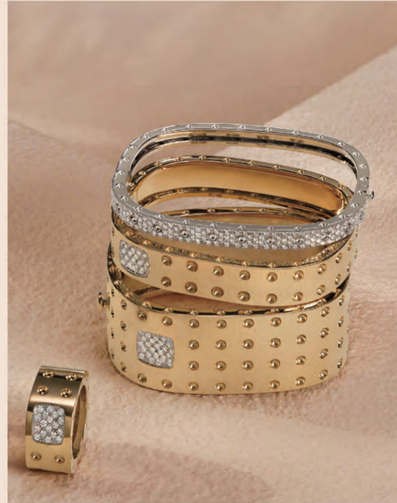
プワモア POIS MOI - COLLECTION -

80年代に登場して以来、精巧さと創造性で世界を魅了するANIMALIERコレクション。モチーフとなる動物たちの身体的な構造や動作の特徴を研究し尽くし、まるで彫刻作品のように「今にも動き出しそうな姿」をジュエリーで表現するという、イタリア職人の技術の高さを雄弁に物語るミニチュアモデル。親しみやすいファーストインプレッションながら細部は極めて複雑で、実物に迫る羽や鱗は弾力性を味わえるなど、装飾品を超えた楽しみも。現在は、現実世界の動物から架空の生き物へと想像力の翼を広げている。