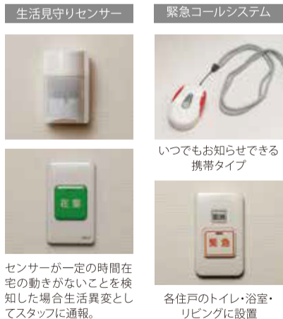
生活見守りセンサー

定年後は、たいてい健康を身体的側面だけで捉えてよいものだろうか。定年後の生き方に迷いがあると、だんだんと外出の機会や交流範囲が狭くなり、閉じこもりがちになる。苦楽園中楽坊なら、関係や環境の力によって健康になることができ、いつでも誰かがいて、誰かが手伝ってくれる。そして感謝の気持ちが生まれる。中楽坊を所有しているって素敵、格好いい!そんな未来が広がっていく。