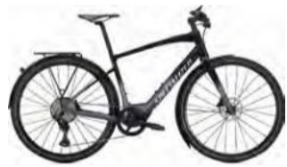
VADO SL 5.0 EQ 462,000円(税込) 通勤、街中、遠出のサイクリング。はじめの1台としても最適な超軽量E-バイク。