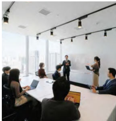
高速インターネット環境から複合機、オートロックや防犯カメラ、フリードリンク、電話ブースなどを完備。もちろんウィズコロナ時代のニューノーマル仕様なので安心だ。

固定料金で、いきなり利用を開始できるのは大きな魅力。全拠点にアクセス可能なので特に企画や営業系の部門では生産性向上が期待できそうだが、加えて高額な賃料に苦しむ本社オフィスのフロア縮小を並行させれば、相乗効果はさらに鮮明になるだろう。一方、管理部門やBCP対策向けに、従量制も用意。10分あたり67円という驚きのロープライスが設定されているが、同社によれば、これは都心5区における他社比較でも「最安値」だ。