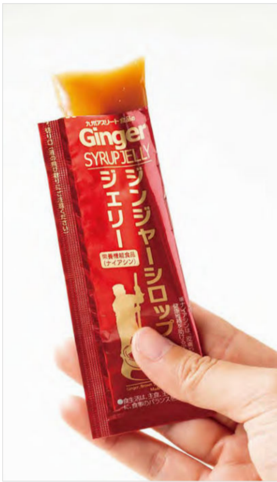
▲これがその、長崎県産 生姜シロップジェリー。

1000万本も売れている生姜シロップをジェリー化したもの。生姜シロップにコラーゲンやザクロ、ナイアシンなども、一緒に摂れる素晴らしい美容食だ。