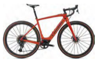
S-Works Turbo Creo SL 1,485,000円(税込) 上り道を平らに感じさせ、向かい風も余裕で進める爽快なロードバイクタイプ。