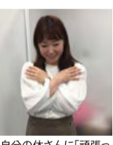
▲自分の体さんに「頑張ってくれてありがとう」を!

自分への「頑張ってくれてありがとう」を! 自分への「頑張ってくれてありがとう」を!