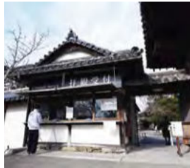
真言宗醍醐派 総本山醍醐寺(世界遺産)もナノゾーンコートを実施