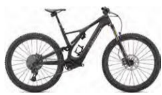
S-Works LEVO SL CARBON 1,694,000円(税込) 俊敏で軽快な走りをモノにする軽量性を重視したマウンテンバイクタイプ。