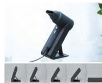
これは便利! ハンズフリー置台付き

1分あたり1.5mの大風量と独自の技術のダブル遠赤外線で、驚くほどの速乾性としなやかな仕上がりを実現。加えて業界初のハンズフリー置台付きで、温風も冷風も自在な風量調整ダイヤルと組み合わせてサーキュレーターとしても使えるプレミアムなドライヤーだ。 話題のテラヘルツ波、熱ダメージを防ぐ60℃の低温、そして200万個/cmの「マイナスイオンシャワー」など嬉しい機能が満載。肌も、頭皮も、「元氣」を目指そう。