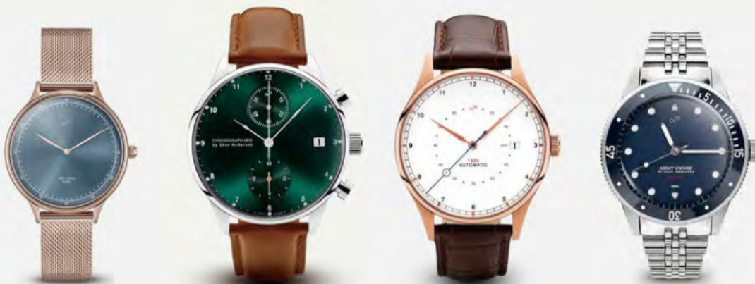
1969 Vintage Petite Rose Gold / Blue Sunray 23,900円(税込)

待望のレディースコレクションとして市場を沸かせたクォーツモデル。小振りなフォルムで最小限の装飾にも関わらず、この気品、高額ドレスウォッチを所有している人も1本欲しくなりそうなデザインはササガ。