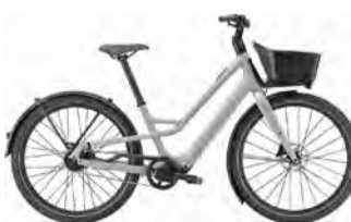
COMO SL 4.0 396,000円(税込) 街なか颯爽と走り、メンテナンスもしっかり。乗りやすさ、扱いやすさで人気のモデル。

昨年来の「新しい生活様式」が続く中での自粛疲れもあつてか、三密を避けながらのアウトドアアクティビティが人気の昨今。せつなくなら、この機会にメタバ预备軍からの脱却も果たしたい...という方に、新たなトライアルの提案だ。 カリフォルニアに本拠を置くスペシャライズドは、世界28か国にオフィスを展開する総合サイクリングブランド。プロ仕様のロードバイクから街乗りのクロスバイクまで多様な製品を手がけているが、近年人気の的となっているのがE・バイクである「スペシャライズドTURBO」シリーズだ。坂道やシヨッピング時などの疲れにくさを目的とした一般的な電動アシスト自転車とは違い、E・バイクはあくまでスポーツ走行がメイン。超軽量の特徴とするスペシャライズド製品はラインナップも充実し、ベストマシンを選ばし楽しむ味もある。