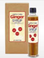
こちらが、8年で1000万本も売れた長崎県産生姜シロップ。これをジェリーにしたのが、上写真。

1000万本も売れている生姜シロップをジェリー化したもの。生姜シロップにコラーゲンやザクロ、ナイアシンなども、一緒に摂れる素晴らしい美容食だ。