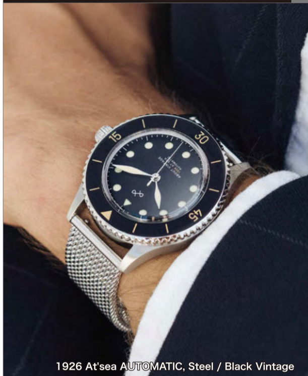
1926 At'sea AUTOMATIC, Steel / Black Vintage