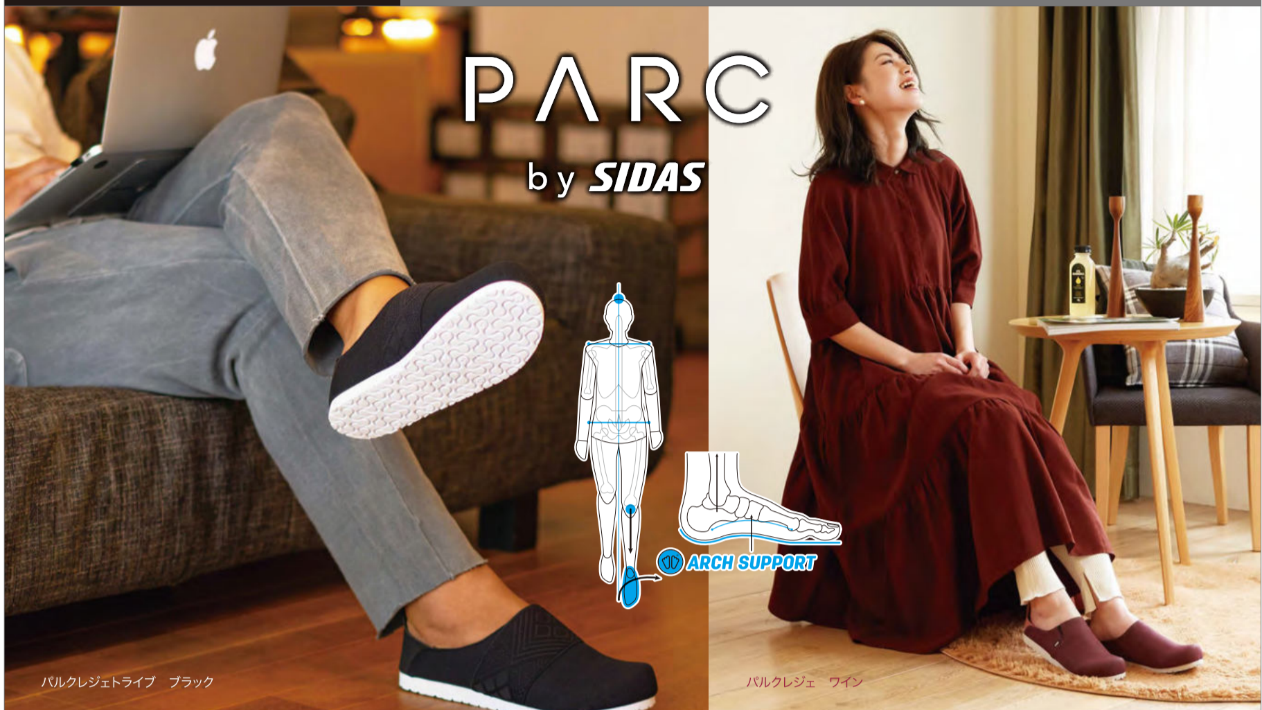
パルクレジェトライブ ブラック