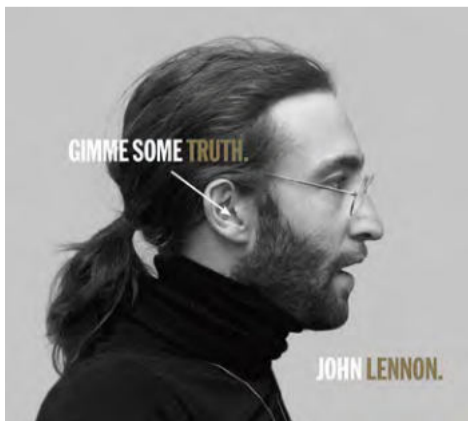
JOHN LENNON. GIMME SOME TRUTH. THE ULTIMATE MIX.

入門者には充実の選曲を、上級者には驚異の音質を。「ハッピー・クリスマス」(戦争は終わった)も収録している。ぜひクリスマス〜年末年始のおうち時間でお試しを。