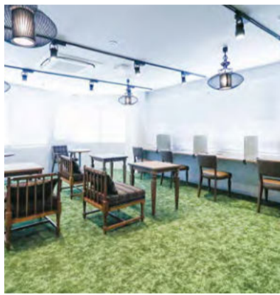
※ABW：アクティビティ・ベースド・ワーキング

フリーランス向けコワーキングスペースが各地で普及しつつあるのはご存じの通りだが、法人対象で50拠点以上の規模をもつサテライトオフィスのサブスクリプション