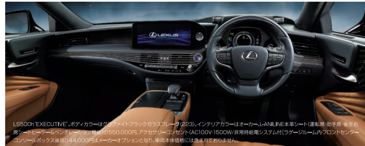
LS500h“EXECUTIVE”。ボディカラーはグロスホワイトブラックガラスフレック(223)。インテリアカラーはオーカー。L-ANILINE本革シート(運転席・助手席・後左右席シートヒーター8ベンチレーション機能付)550,000円、アクセサリコンセント(AC100V・1500W/非常時給電システム付[ラゲージルーム内フロントセンターコンソールボックス後部])44,000円はメーカーオプションとなり、車両本体価格には含まれておりません。

車両本体価格:LS500 2WD(FR) / 10,730,000円~、LS500 AWD / 11,140,000円~