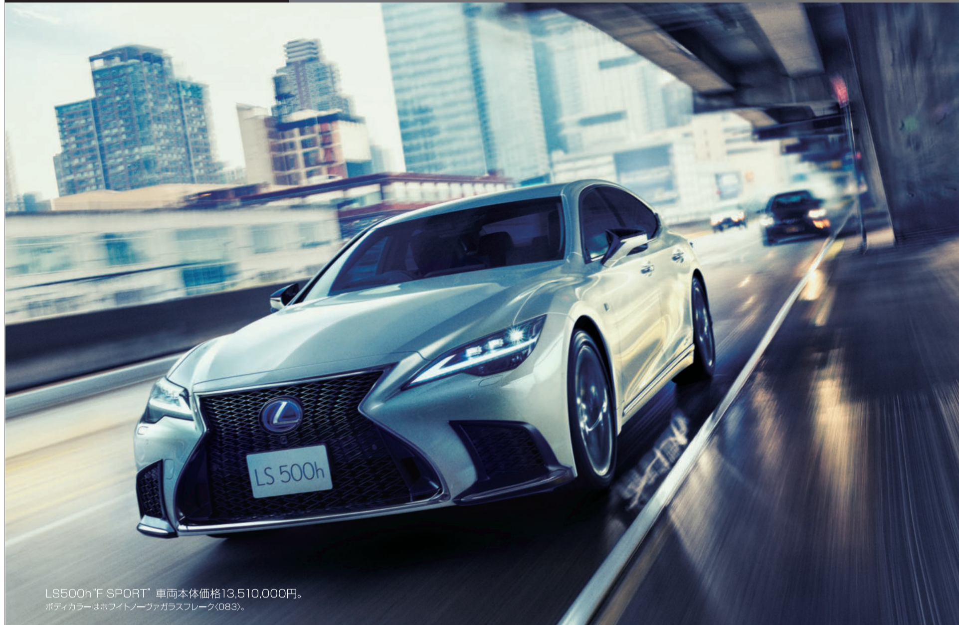
LS500h“F SPORT” 車両本体価格13,510,000円。 ボディカラーはホワイトノヴァガラスフレック(083)。