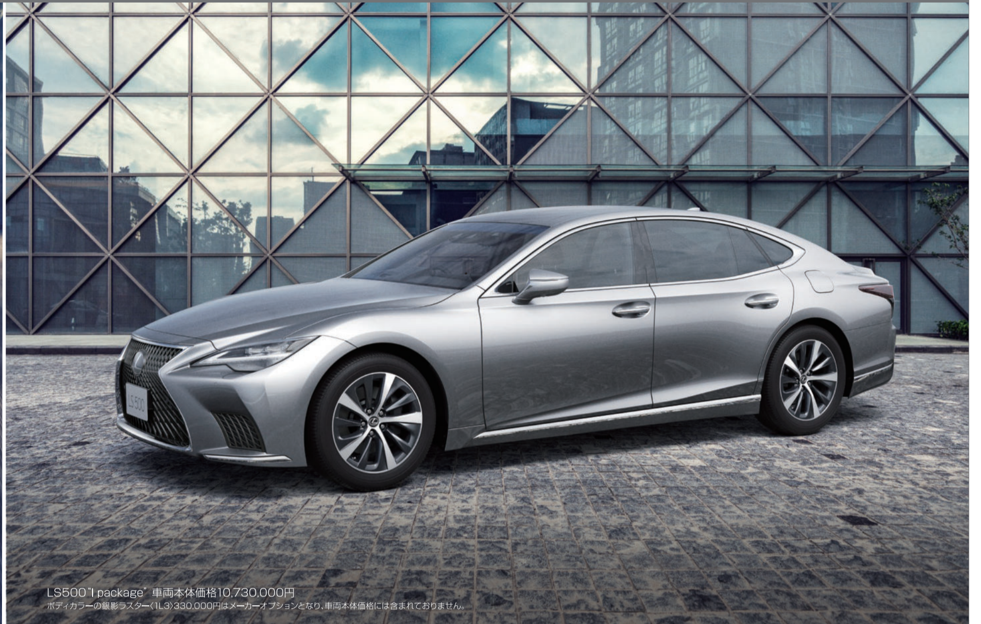
LS500“l package” 車両本体価格10,730,000円 ボディカラーの銀影ラスター(1L3)330,000円はメーカーオプションとなり、車両本体価格には含まれておりません。