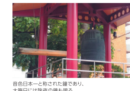
音色日本一と称された鐘であり、大晦日には除夜の鐘も鳴る