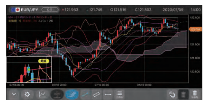
※2020年9月時点(セントラル短資FX調べ)

左から4分割チャート画面、パーソナルコード(カレンダー)画面、ウィジェット画面、チャート+スピード注文画面。右の画像はライン描画の画面キャプチャだ。スマホの持つ機能をフルに活用しているのが特徴。たとえばチャートにトレンドラインを描画する機能では、タップした指先周辺のチャートを自動で拡大表示したり、ローソク足の位置をバイプレッションで感知させるなど、「ここまで来たか」と思わせる仕上がりだ。 ほかにも多様なツールが用意されており、相場解説動画や取引のヒントになるオリジナルレポートが満載のFX情報コンテンツ「マーケットビュー」も好評公開中だ。詳細はウェブサイトアクセスして確認を。