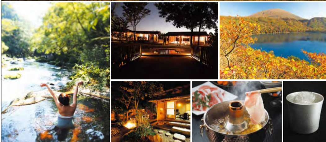
一番上の写真、たった5棟のヴィラが離ればなれに点在する『天空の森』。周囲は自然の風景だけで、見渡す限り人影はゼロ。非日常と言うより、ほとんど超常的な温泉体験を満喫できる。そのほか、あちこちから湧き水が出る霧島市内は、「水」にちなむ名所や特産品が非常に多い。

霧島連山から流れ込む豊かな水が育んだ 自然の景観、食の恵み、そして温泉文化。 鹿児島県「霧島市」のさらなる魅力。