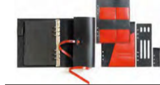
寄附額90,000円以上 KAKURA 紐巻きA5システム手帳 5点セット urushiブラック