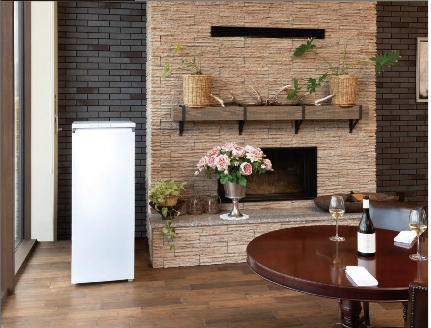
写真は、2019年7月に北海道余市郡の仁木町を舞台に開業した『NIKI Hills ワイナリー』のエントランスラウンジ。葡萄畑や醸造所のほか、宿泊施設にレストラン、1,200本のヴィンテージコレクションを備えたワインセラーなどを完備する複合型ワイナリーだ。AQUAのクールキャビネットはVIPルームに導入されており、飲料やフルーツのほか、フードや購入済みのお土産など顧客が持ち込む私物の一時保管用としても活用されている。