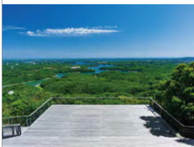
賢島宝生苑の外観と露天風呂(上2枚)、横山展望台からの眺望(下)。真珠の養殖で有名な英虞湾は日本を代表するリアス式海岸のひとつで、複雑に描かれる地形が素晴らしい。

未曾有の事態の連続となった2020年も、残り1か月ほど。依然として予断を許さないものの、年末年始が近づくと、押さえきれない旅心がウズウズし始めるのは自然な流れ。日程は状況次第となるが、晴れて出発できる日に備えて、まずは次の旅先の候補リストづくりを楽しみたいところだ。