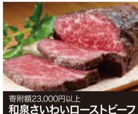
寄附額23,000円以上 和泉さいわいローストビーフ

【写真上】弥生時代の集落跡として全国有数の規模を誇る池上曽根遺跡に復元された、当時の高床建物。 【写真下・左】ポーランド産のダックダウンを使用。優れた軽暖性能に加えて、吸湿放散性が高いのも特徴。 【写真下・右】玉ねぎの甘味を生かしたオリジナルソースとの相性も◎。クリスマスや年末年始などこれからの時期にぴったり。