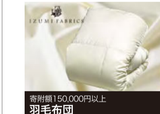
寄附額150,000円以上 羽毛布団