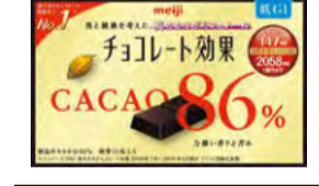
寄附額35,000円以上 【なんと60箱】チョコレート効果カカオ86%