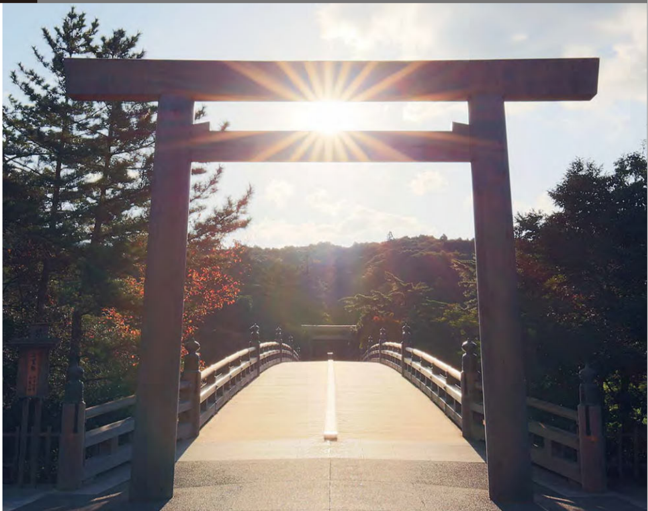
「お伊勢さん」として広く親しまれる伊勢神宮は、日本文化の原点を見る思い。伊勢名物『赤福餅』(写真左中)の赤福は、宝永4(1707)年創業の超老舗。同社が旗振り役を務めて江戸時代の町並みの再現を試みた「おはらい町」(写真左下)は、やはり同社が手掛けた中心部の「おかげ横丁」とともに大人気となり、現在は伊勢うどんや手こね寿司などの郷土料理、真珠や伊勢茶など伝統の特産品を販売する土産物店などが集う一大観光スポットへと成長している。