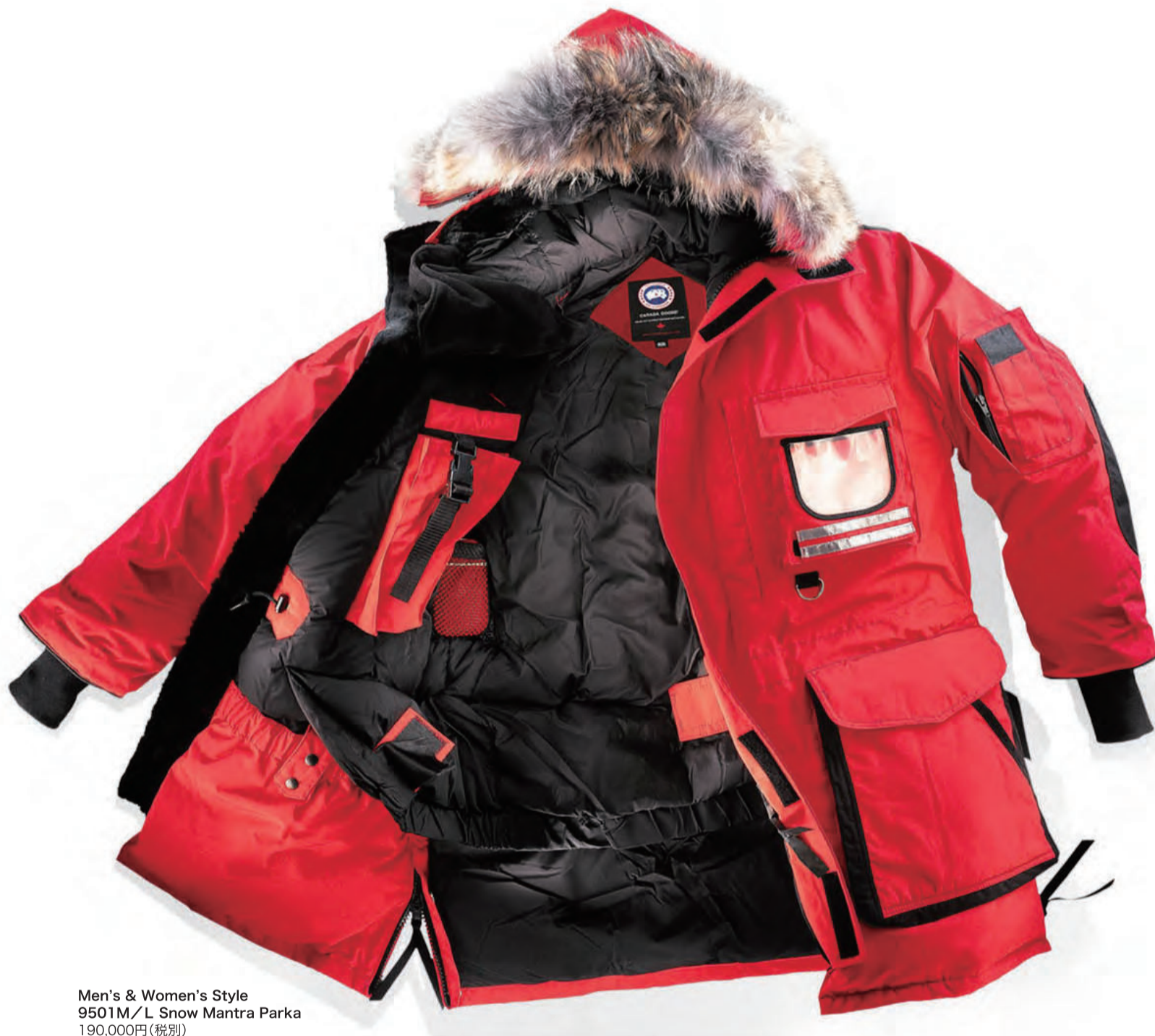
Men's & Women's Style 9501M/L Snow Mantra Parka 190,000円(税別)

企画・制作 / 株式会社デイルスポーツ案内広告社 〒110-0015 東京都台東区東上野4-8-1 TIXTOWER UENO 14F © 2020 DAILY ADVERTISING AGENCY CO.,LTD