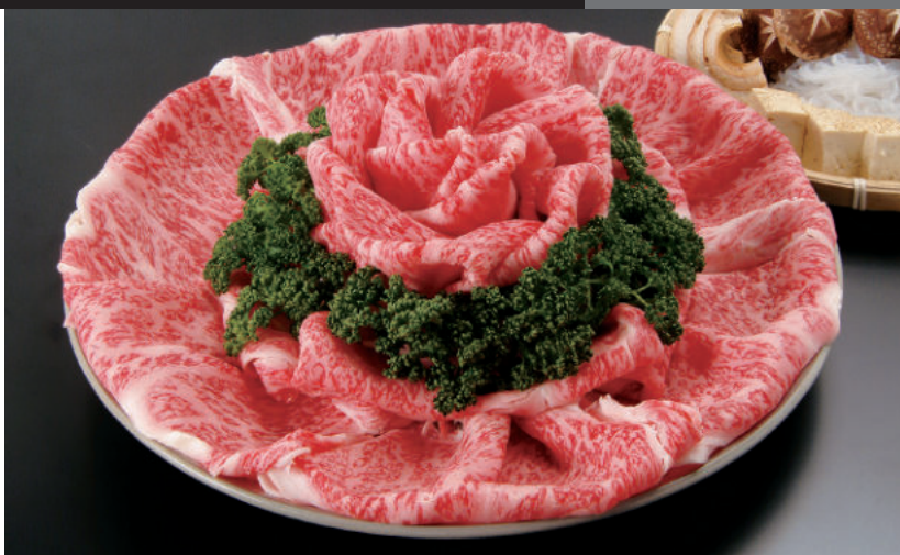
いわて南牛の特徴は、子牛も一関地方生まれであること。県南で生まれ、幸せに育ったからこそ、この肉質。

岩手県は、全国の有名な和牛の産地から買付けにくくという点も、優秀な牛の産地として名高い。その岩手県の南端、開市と平泉町で最長期間飼養管理された黒毛和種「いわて南牛」は、過去2度にわたり全国肉用牛枝肉共励賞で最優秀賞を受賞、地元振興協会が認めた日本食肉格付A3等級以上の枝肉のみを差す。生産農家はわずか40戸、年間約650頭のみが出荷される希少牛。ストレス要因を排除した肥育環境が大きな特徴で、厳選のひとめぼれ稲わらを中心に、配合飼料に独自のノウハウを注ぎ込み愛情たっぷりに育てられる。取扱店は岩手県南エリアに点在。近隣を訪問の際にはぜひチェックしよう。