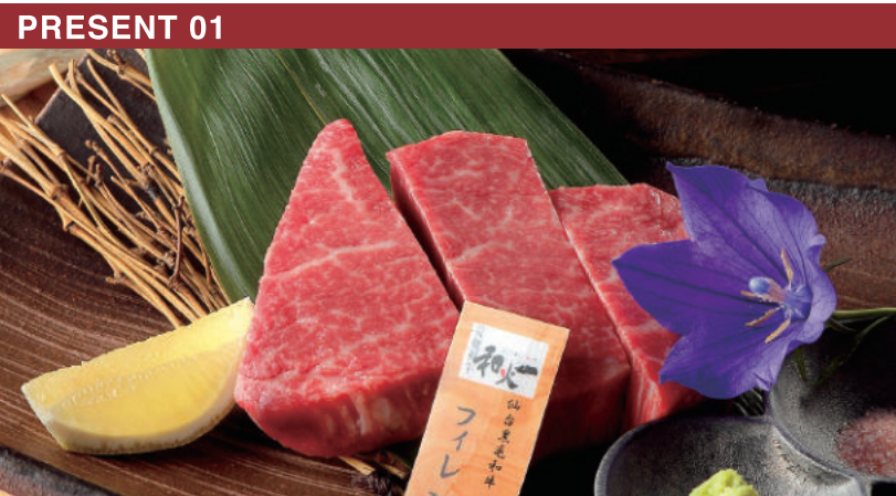
一番人気の「プリフィクスコース」は、好みの部位を組み合わせたコース仕立てで楽しめる。