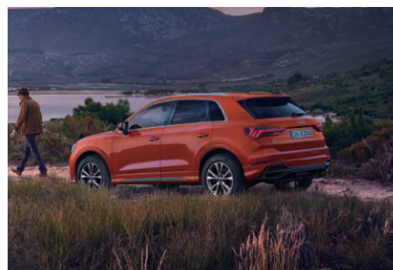
第2世代へと進化したアウディQ3。先代よりも遅しく質感の高さを意識したスタイルを身にまとった。新バリエーションとなったQ3スポーツバックは、全高を抑えた、クーペライクな美しいフォルムが印象的。クラストップレベルの広いラゲッジスペースやアレンジ自在のリヤシートにより、アクティブなライフスタイルをサポート。さらに、さまざまなセーフティ機能やドライバーアシスタンスシステムでロングドライブも快適なものになるだろう。