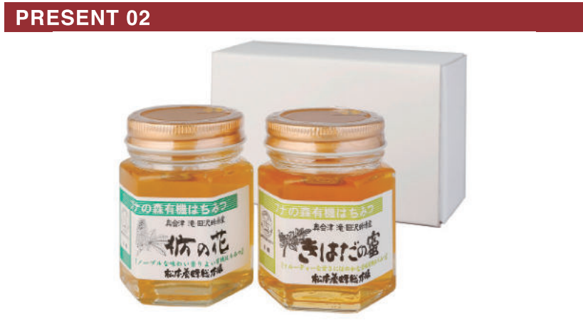
厳しい基準をクリアした国内唯一の有機はちみつ。「橋の花」と「きはだの蜜」をセットで。