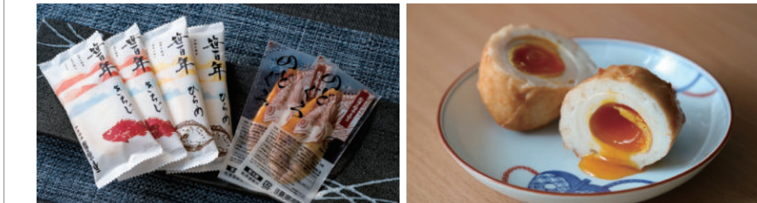
【写真上】左から百年きぢじ、ひらめ、のどぐる世かま。オープンなどで突るようによめると焼き立ての風味を楽しめる。酒の肴としてもオススメだ。【写真左】魚船が帰ってくる朝焼けの海をイメージしたという新パッケージは、並べると海と雲が連なっているように見える。【写真右】揚げがまぼこ「半熟ぱくだん」はお野菜にも人気の一品。半熟卵がトロリとあふれるインパクトが強烈だ。