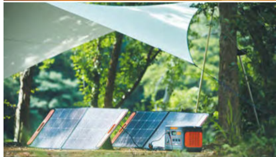
多様な家電や電子機器へ同時に給電するポートの多さも二重マル。ドイツの有名な国際アワード「レッド・ドット・デザイン賞」受賞のルックスと使いやすさもポイントのひとつだ。

記録的な酷暑に大型台風、暴風・豪雨に未知のウイルス。もはや緊急時への備えは必須といったところだが、そんな中でいま急激に需要が高まるのが「ポータブル電源」だ。 気軽に持ち運べる電源と言えばスマホ充電用のモバイルバッテリーを思い浮かべるが、ポータブル電源は容量が別次元。予め充電しておけば、万が一の停電時にも家電や電子機器をすぐに使える。安全に使えるリチウムイオン電池の進歩で、ひと晩くらいなら壁のコンセントなしでも普通に過ごせるレベルへと達しているのだ。 モバイルバッテリーとは別次元大容量のポータブル電源 防災アイテムとして需要高まる家庭用のポータブル電源は、もともとキャンプなどのアウトドア現場での利用を想定して進化してきた。近年の社会生活では毎日のメールチェックが欠かせず、できれば電気ケト