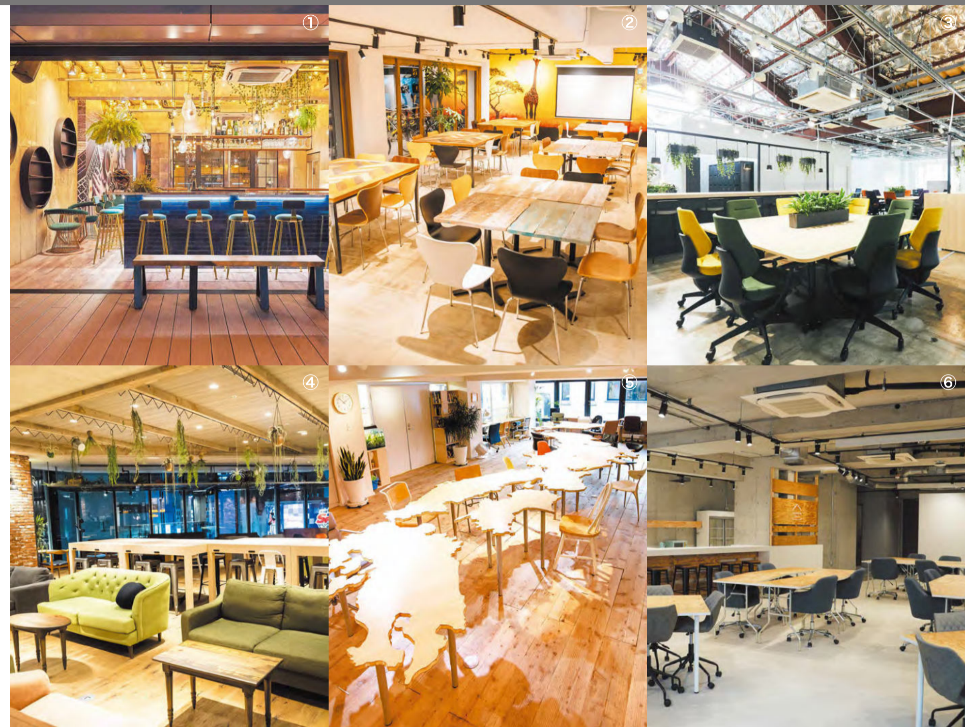
①いいオフィス秋葉原 ②いいオフィス上野 ③いいオフィス天王洲アイル ④いいオフィス渋谷宇田川町 ⑤いいオフィス新宿 ⑥いいオフィス下北沢