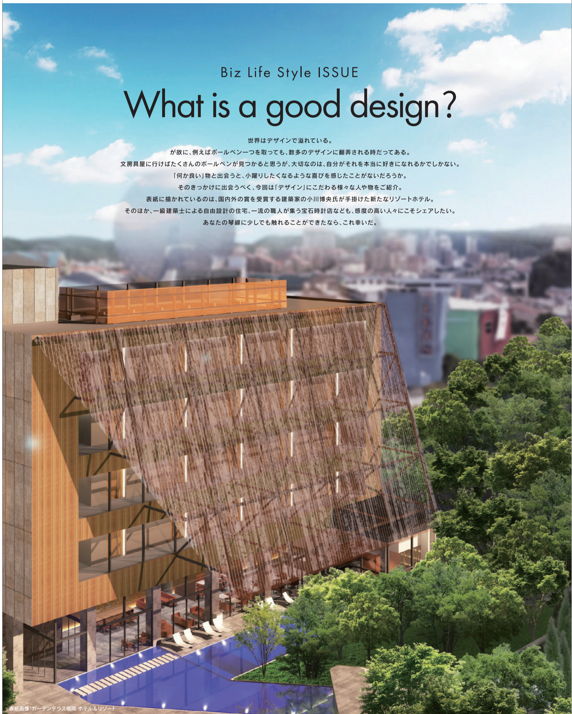
表紙画像: ガーデンテラス福岡 ホテル&リゾート