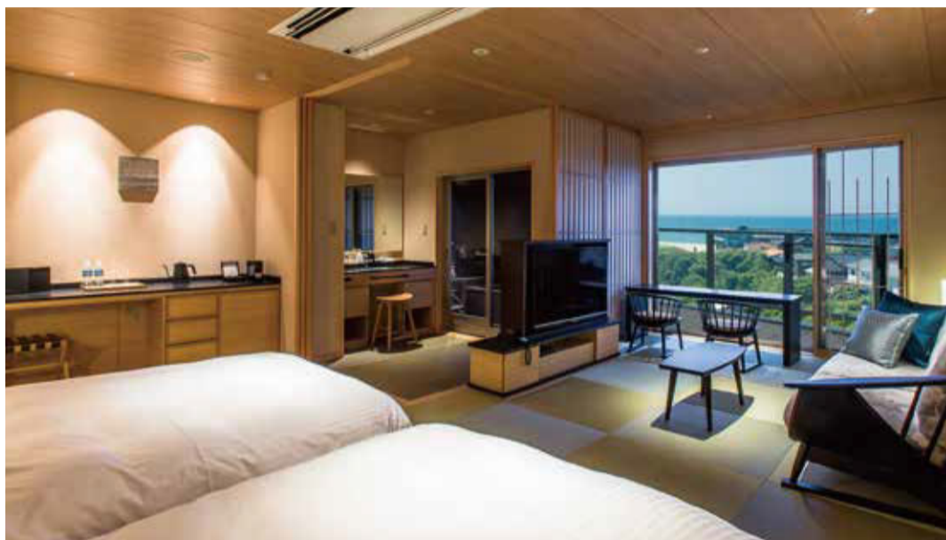
特別フロア「たいしょ」

特別フロア「うすい」「りっか」「たいしょ」指定 [冬人気]カニづくし会席のいいとこどり 地ガニ付きカニ会席