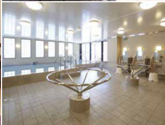
左/一般居室(ベルパージュ奈良あやめ池シニアレジデンス) 右上/そよ風を感じながらリラックスできるテラス (ベルパージュ奈良あやめ池シニアレジデンス) 右下/毎日利用可能な大浴場(ベルパージュ奈良あやめ池シニアレジデンス)