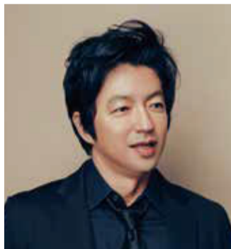
俳優 大沢 たかお さん

「AI崩壊」って観てみたいな、すごく面白そうだなっていうシンプルなお感覚で。次の時代、おそらくAIが自分たちの日常のいるんなシーンに入ってくることはほとんどの人が気づいていると思うんです。でも、具体的にどうなるのかはわかっていない。それをこの映画で学んだり体験できたらすごいなと。