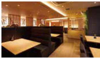
完全個室(6~10名専用で4部屋)もございます。