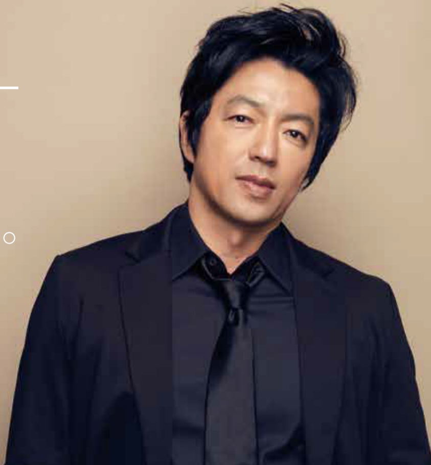
スタイリスト/黒田 領 ヘアメイク/神川 成二

それは嬉しい言葉ですね。そこが難しく、こういう近未来のパニックを描く作品ではファンタジーになったり、浮いてしまうと観る人に評価されない。だから自分の日常に起こりうる感覚、人間が必死になってAIというものに対峙するリアリティを描いています。台本の内容は大学でAIの研究に携わる教授が検証し、パソコンの動作一つでも、実際にそういうことが起こりうるのか