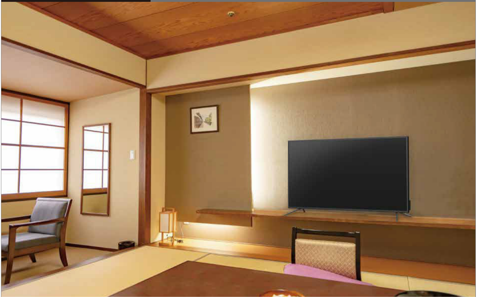
BIZmodeの VOD画面 イメージ