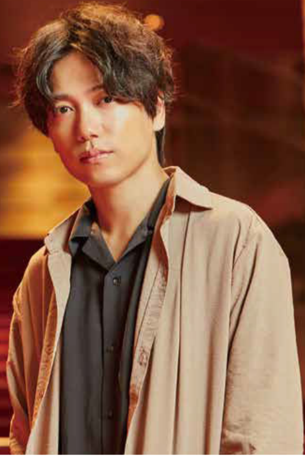
撮影場所：フェスティバルホール(大阪中之島)

ミュージカル界のプリン スでありながら、映画にCM、 ラジオに吹替え、と幅広く活 動中。2020年1月には「ミ ラーボール 19」コンサート ツアーが幕開けを迎える。ミ ュージカル界からエンターテ インメントへと飛躍を上げた 山崎育三郎さんに、原体験と なるエピソードを訊ねた。