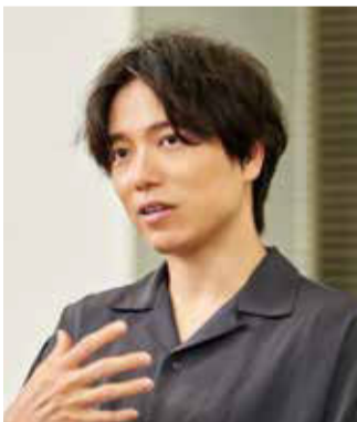
俳優・歌手 山崎育三郎 さん

「プロデューサーにあのヒ ャダインさんを迎えてこの 7月に発表されたカバーア ルバム「ミラーボール 19」も 大好評ですね。来年1月には ライブツアーも始まります