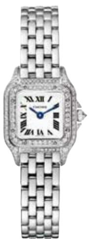
パンテールドゥ・カルティエ CRWJPN0019 Mini (25×21mm) ホワイトゴールド、ダイヤモンド 3,168,000円(税込)