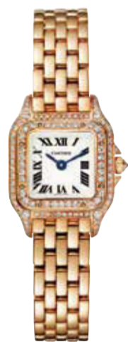
パンテールドゥ・カルティエ CRWJPN0020 Mini (25×21mm) ピンクゴールド、ダイヤモンド 2,943,600円(税込)

カルティエのレディースウォッチには、さまざまな女性像が映じ出されています。清潔で知的でクリエイティブにインスピラルに、センシティブに……、多様な「自分を試したくなる」現代のマスターピースたち。実際に手に取っていただき、お楽しみください。