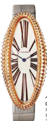
ペニウォール アロンジエ CRWGBA0010 XL (52×23mm) ピンクゴールド 3,841,200円(税込)