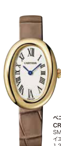
ペニウォール CRWGBA0007 SM (32×26mm) イエローゴールド 1,280,400円(税込)