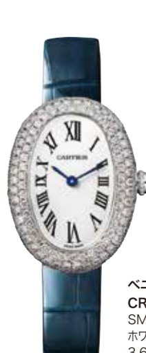
ペニウォール CRWJBA0015 SM (32×26mm) ホワイトゴールド、ダイヤモンド 3,630,000円(税込)