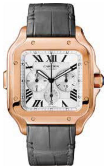
サントスドゥ カルティエ クロノグラフ CRWSSA0017 XL(51.3×43.3mm) ピンクゴールド 2,904,000円(税込)

スデュモン』が登場。約6年間の連続作動能力を誇るクォーツムーブメントの採用にも注目を。誕生の経緯から、常に実用性が主題のひとつとなってきたサントスだけに、従来の倍にあたるという能力向上は特筆すべき進化といえます。 クロノグラフにもサントスのパイオニア精神とエレガントなスタイルが表現されています。 ここまでカルティエウオッチの最新コレクションを紹介してきましたが、「美のメソンの真価は、ぜひ店頭でお手に取っておたしかめ下さい。