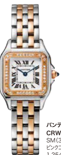
パンテールドゥ・カルティエ CRW3PN0006 SM (30×22mm) ピンクゴールド、スチール、ダイヤモンド 1,254,000円(税込)