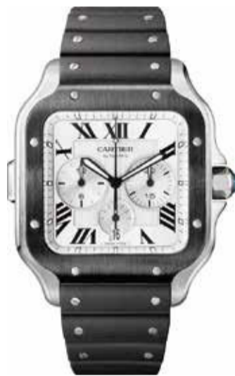
サントスドゥ カルティエ クロノグラフ CRWSSA0017 XL(51.3×43.3mm) スチール、ADLC 1,003,200円(税込)

『サントスドゥカルティエ』は、まさにウオッチメゾンとしての『カルティエ』の原点ですが、その革新性はオリジナルの誕生から115年を経た今も揺らぎません。「時の試練」を超越する普遍性は、『ヘニウォール』や『パンテールドゥカルティエ』にも共通するカルティエの真髄といえるでしょう。 『サントスドゥカルティエ』は、もはや人類の遺産とも言うべきマイルストーンですが、進化した新作コレクションを発表。最新作では、開発の契機を与えたブラジル人飛行家への敬意が強く込められた『サント