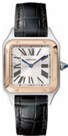
サントス デュモン CRW2SA0012 SM(38×27.5mm) ピンクゴールド、スチール 577,500円(税込)