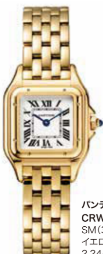
パンテールドゥ・カルティエ CRWGP0008 SM (30×22mm) イエローゴールド 2,244,000円(税込)