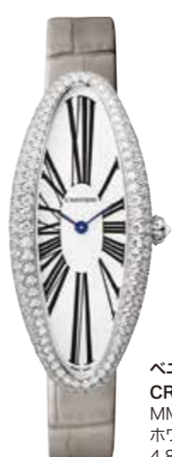
ペニウォール アロンジエ CRWJBA0007 MM (47×21mm) ホワイトゴールド、ダイヤモンド 4,818,000円(税込)