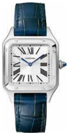
サントス デュモン CRWSSA0023 SM(38×27.5mm) スチール 407,000円(税込)