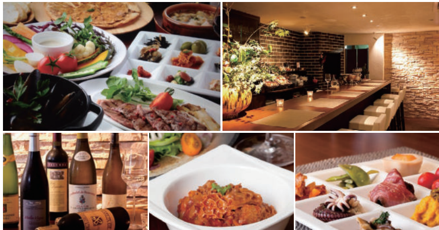
カウンター席のほか、テーブル席やソファ席も完備。仕事帰りやデート、家族での食事など、あらゆるシーンで使える一軒だ。旬を意識したアラカルトやコースもあり、ワインなどのアルコールも豊富。心地よいBGMとダウンライトが作る上質な空間で、料理や店主との会話も楽しもう。