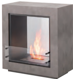
CUBE ¥730,000(税別) W945×D392×H949