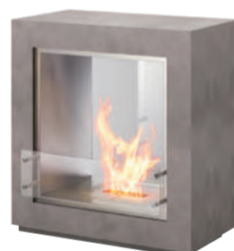
FUSION ¥810,000(税別) W945×D452×H996