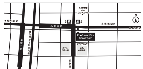
EcoSmart Fire 大阪ショールーム 大阪府大阪市中央区心斎橋筋1-10-11 敬和ビル6F TEL.06-6258-0177 営業時間/11:00~19:00 不定休