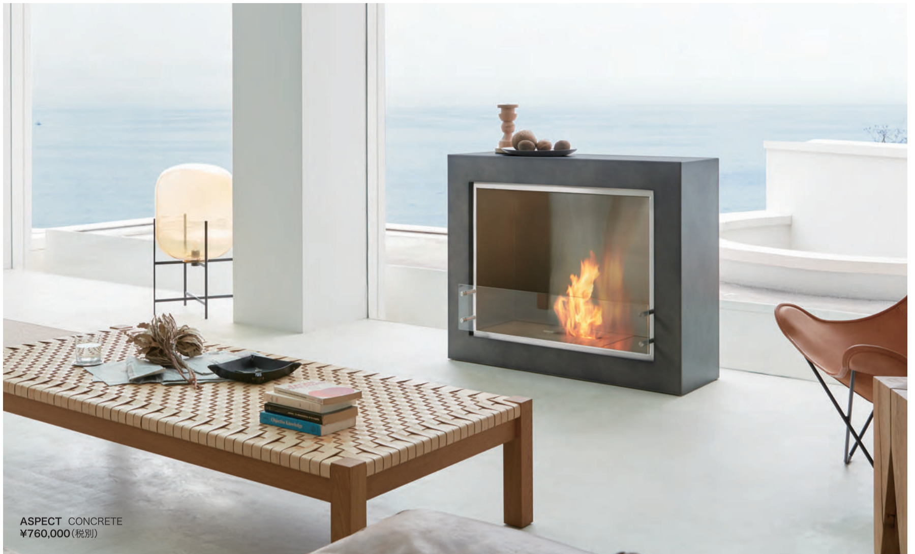
ASPECT CONCRETE ¥760,000(税別)