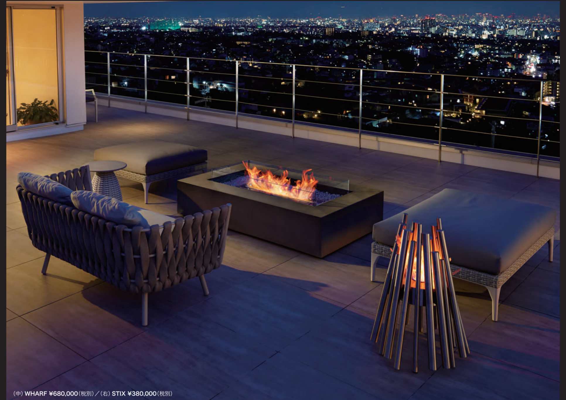
(中) WHARF ¥680,000(税別) / (右) STIX ¥380,000(税別)