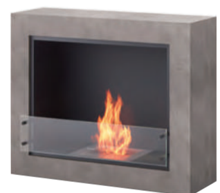
VISION ¥950,000(税別) W1,190×D538×H996