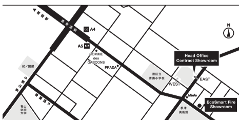
EcoSmart Fire 南青山ショールーム 東京都港区南青山4-24-8 TEL.03-6450-6366 営業時間/11:00~19:00 不定休