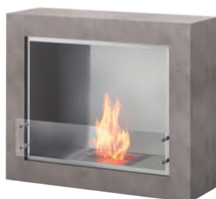
ASPECT ¥760,000(税別) W1,145×D392×H950