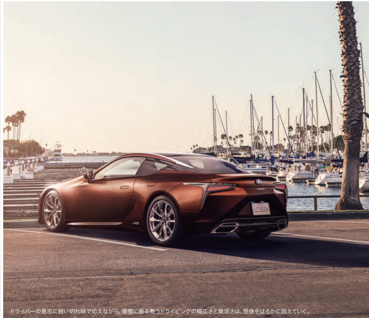
ドライバーの意志に鋭い切れ味で応えながら、優雅に振る舞うドライビングの幅広さと奥深さは、想像をはるかに超えていく。