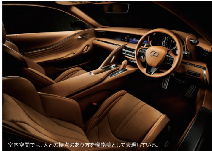
室内空間では、人との接点のあり方を機能美として表現している。