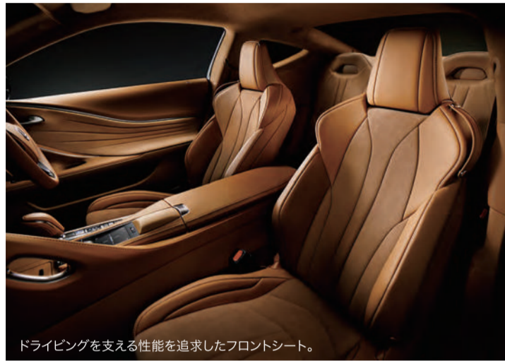
ドライビングを支える性能を追求したフロントシート。