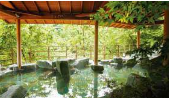
【写真上】ここに燈る思い出のともし火...「このころの贅沢」をテーマにした新ダイニング。【写真下・左】仙台に負けない食の王国・福島県の味覚の数々。プロが全国屈指と推す料理は、一度は経験しておきたい。【写真下・右】大浴場、露天風呂、貸切風呂、足湯...穴原温泉の名湯を、素晴らしい眺望とともに。

奥飯坂・穴原温泉 匠のころ 吉川屋 TEL.024-542-2226(代) 住所/福島県福島市飯坂町湯野字新湯6 交通/【電車】福島交通飯坂線「飯坂温泉」駅から車で約5分(送迎あり) 電話受付時間/8:00~20:00 www.yosikawayaya.com/ ※旬刊 旅行新聞「第43回 プロが選ぶ日本のホテル・旅館100選」より