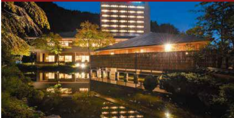
日本にある11種の泉質のうち9種類が集まるとされる名湯・鳴子温泉郷。「吉祥」は、四季の絶景を堪能できる高台に佇む。

平安初期の承和5(837)年、鳥谷ヶ森(鳴子火山)の爆発で轟音とともに熱湯が噴き出したことから「鳴郷の湯」と名づけられたとも伝えられる鳴子温泉。「吉祥」は、千年以上の歴史を誇る湯治場に生まれた新しい湯宿。趣の違う4種の貸切風呂があり、特に岩風呂と檜風呂の解放感に格別で、泉内外の温泉ファンたちが太鼓判をおす人気ぶりだ。