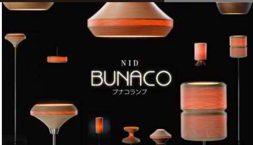
天然ブナの素晴らしい質感と、圧倒的な職人技術。デザインも豊富なので、店頭で実物を見ながらじっくりと選びたい。

いよいよ新年度が始まり、春も本番のシーズン。気分を一新して臨むなら部屋の模様替えが欠かせないが、ワンランク上の自分を目指すなら、より上質なインテリアにトライしてみたい。 昨秋にリニューアルオープンを果たした青葉区の総合インテリアショップ「NID」は、グッドデザイン賞の受賞などで注目度も急上昇中の「ブナ」の正規販売店でもある。青森県の世界自然遺産「日神山」のブナ天然林の木材を贅沢に使用した手づくりのインテリアブランドで、特に光が透過するブナ材のランプシェードは人气的。贈る心がひと目で伝わる逸品だ。 同店では、自分だけの寛ぎを自由に演出できる多種多様なアイテムを多数在庫。インテリアの見直し時には、まずここへ。