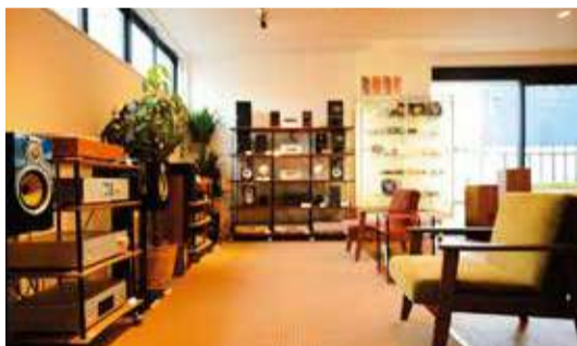
【写真上】ごく一般的なリビングをホームシアター化することも可能。「大きな専用室が必要」というのは、もはや時代遅れなのだ。【写真下・左】スピーカーが見えないのは、天井に埋込まれているから。メンテナンス不要で、響きも自然！【写真下・右】マニア層からの信頼も厚い「聖地」。この品揃えもほんの一部だ。