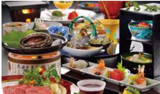
【写真上】約300本の桜が一斉に咲き誇る光景は圧巻。高台からの眺望も楽しみだ。【写真下・左】「幸せ気分のコンサート」は、昼の部・夜の部と開催。詳細は公式HPをチェックしよう。【写真下・右】もちろん料理もこのクオリティ。自慢の「緑水御膳」は、仙台牛とあびがメインの人気メニュー。