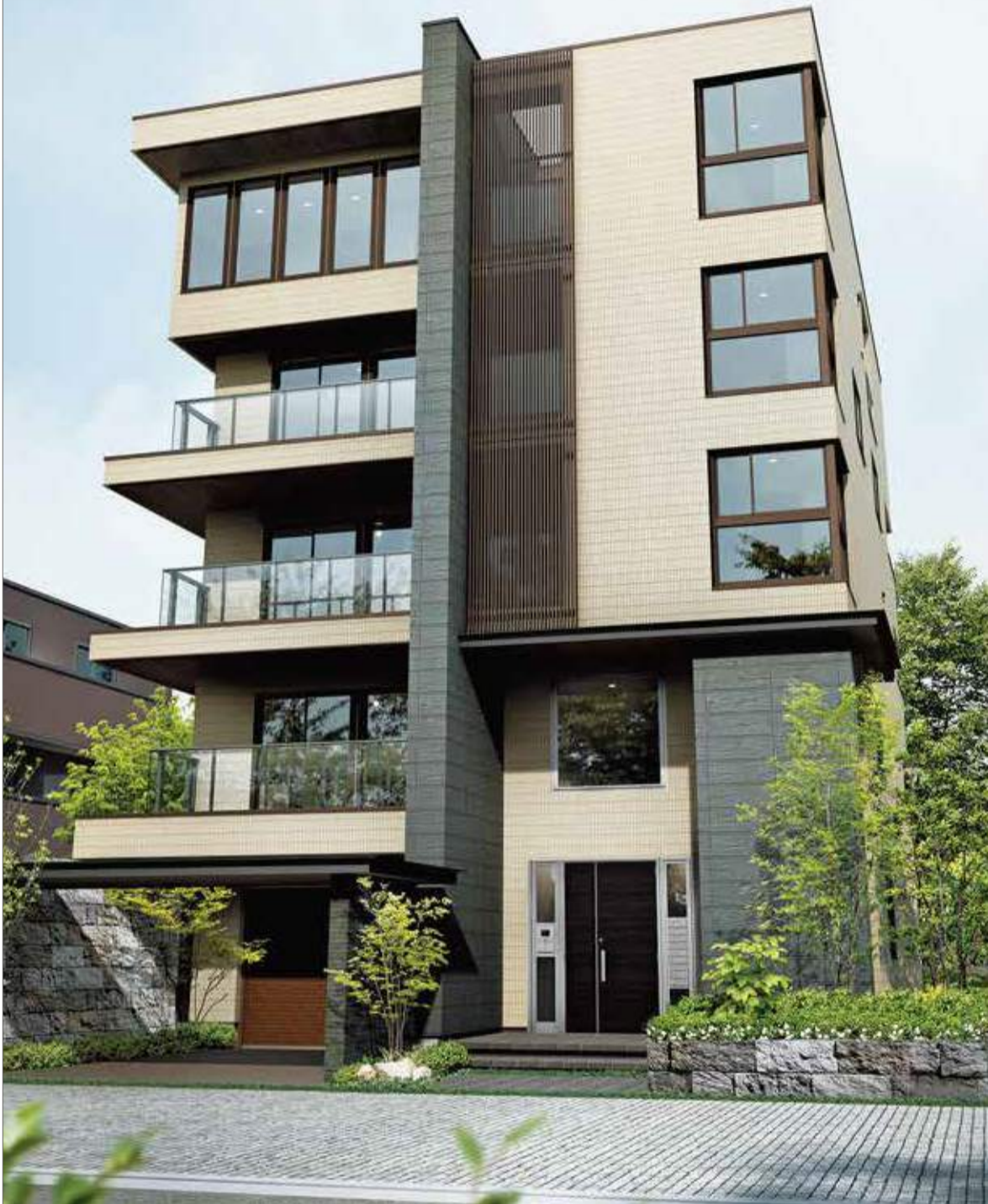
3階・4階・5階建てでも可能な大和ハウスの重量鉄骨住宅「スカイエ」。デザイン性にもすぐれ、入居者層が憧れるに十分な「風格」も演出できる。

土地が狭くても 賃貸経営は十分に可能。 「上に延ばし」「横に広げる」重量鉄骨。 首都圏で着々と施工実績を伸ばす 大和ハウス工業「スカイエ」の魅力とは。