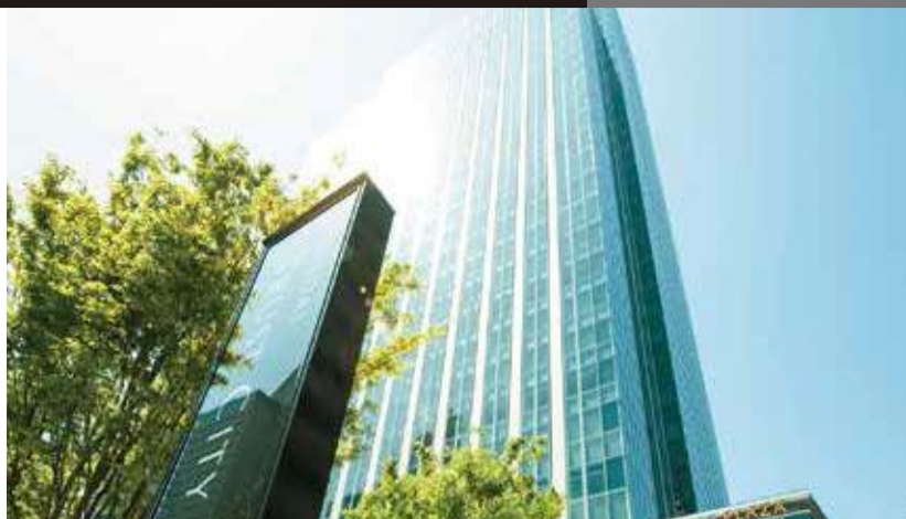
宮城県内のベーカリーが一堂に会する注目の祭典。金曜と土曜で営業時間が異なるのでご注意ください。

東北の高さとなる180mを誇る「仙台トラストタワー」は、ホテルやオフィス、商業施設を擁する仙台のランドマーク。隣接する高層住宅棟「ザ・レジデンス一番町」とともに大型複合施設を形成し、仙台エリアの都市生活にすっかり欠かせない存在となった。 これから、出かけたくなる季節。そこで、今月の20日から2日間限定のオープンカフェの開催が決定した。今回は「パン」がテーマとなっており、県内各地で人気を集める手づくり系のベーカリーがトラストシティに集結すること。各店自慢の定番商品からレアな数量限定商品や期間限定商品まで、まさに「パンの祭典」といった雰囲気。パン好きの方はお見逃しなく。