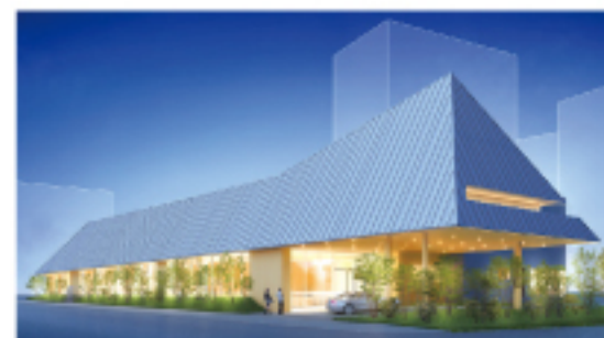
70mの長大な屋根には大和張りという日本古来の技法を採用。斬新なデザインだが、木材がふんだんに使われており伝統的な美が漂う。