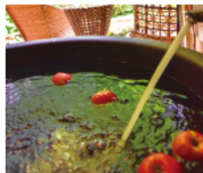
信楽焼で作った特注の湯舟は部屋ごとに形が違ふ。写真は、地元信州のリンゴを浮かべたプラン。疲労回復、美肌効果が期待できる。

プライベート感を重視した隠れ宿だけあって、客室は全部で8室のみ。いずれの部屋にもテラスや縁側へ続く半露天風呂がついており、浴室には特注でつくられた大きな信楽焼の湯船が備わっている。湯船には中央アルプスの麓で湧く早太郎温泉の湯が投入されており、時間を気にすることなく24時間いつでも入浴できるため、しつぽりと部屋で過ごすには最高だろう。朝の澄み渡った森の空気を、そして山野草で