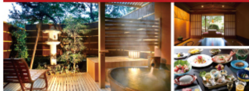
左/客室露天風呂。上/贅沢なひと時を過ごせる書斎。下/四季折々の旬な料理(一部時間により変更あり)

芦原温泉に佇む日本海側最大級、計36室の露天風呂付客室を持つ湯宿。客室にある露天風呂は好きな時間に楽しめるので寛ぎの時間を過ごす「湯ごもり宿」としても最適だ。館内ではロビーラウンジの壁面と柱の箔絵、それに続く回廊庭園への自然を堪能できる。お食事は美松自慢の懐石料理。毎年リピーターも多く、福井ならではの食材にこだわった四季折々の新鮮な食材を味わえる。刺身や天ぷら、焼き蟹(別料)など普段出来ない楽しみ方を存分に堪能してほしい。