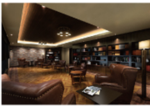
伝統的な書斎を思わせるラウンジライブラリーはWi-Fiも完備されており、ワークスペースとしても利用できる(完成予想図)

そして何よりラグジュアリーを追求した仕様がこのレジデンスの最大の特徴だろう。共用廊下は風雨にさらされない内廊下設計を全フロアに採用しており、ダウンライトとカーベット敷きのホテルライクな空間が広がる。また、ラグジュアリーなホテルに入館するかのような重厚なエントランスはオーナーを深き美しき感で満たしてくれるはずだ。ホステリティに