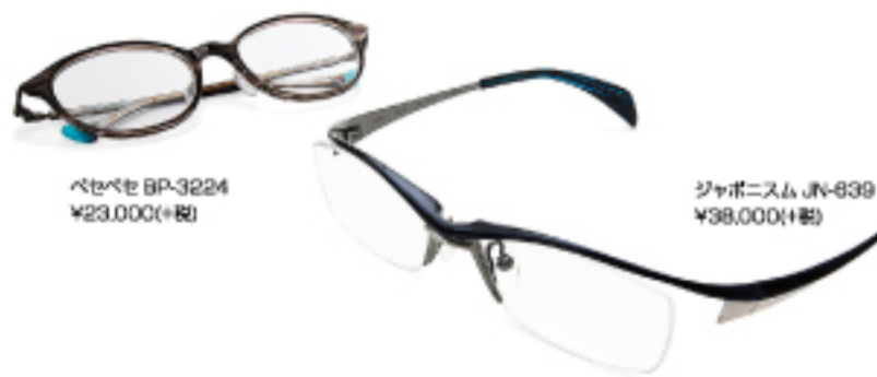
ベセベセ BP-3224 ¥23,000(+税)

100年以上前から眼鏡生産を行っていた福井県鯖江市。1980年代に世界で初めてチタン製眼鏡の生産に成功すると、その技術は世界中から注目を集めるようになった。そんな鯖江市でオリジナルブランドを立ち上げ、上質な眼鏡をつくり続けているのがボストンクラブである。今や眼鏡は靴・服・時計と同じように重要なファッションアイテムの一つ。機能性と実用性とデザイン性に優れたボストンクラブの眼鏡は、本質的なモノの良さを求める人たちの間で絶大な支持を集めている。これまでは銀座の直営店が全国の正規取扱店でしたが、お目にかかることができなかったが、2017年10月に鯖江初の直営店ボストンクラブショップサバエがオープン。ショップには歴代モデルを展示したミュージアムなども併設されており、注目のスポットとなることは間違いないだろう。