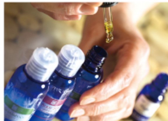
アロマオイルは天然素材をベースにした地元の「ガイアNP」を採用。「深い森」「南の薬園」など魅惑的なネーミングのオイルが揃っている。

中央アルプス社の隠れ宿 季節香(ときすみか) 〒399-4117 長野県駒ヶ根市赤穂4-172 https://tokisumika.com