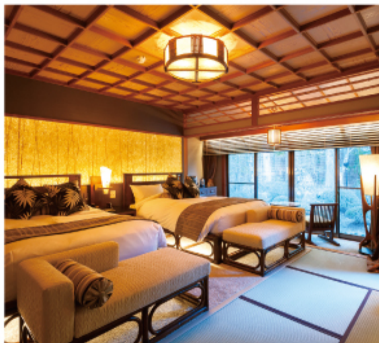
客室のベッドはゆったりとしたサイズのシモンズ社製。セブ島でつくられた1点ものの家具やインテリアが落ち着いた空間を演出している。料金は1泊2食付きで1人¥33,000(税込)〜