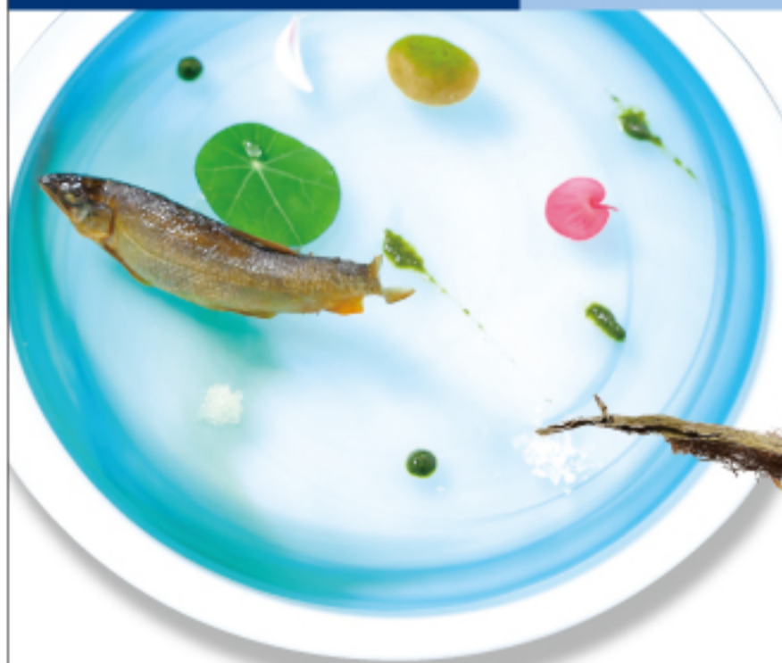
料理長白ら鮭魚へ足を運び、仕入れている魚は中央アルプスを水源とする太田切川の水で育てられたもの。川魚が苦手な人でもこの味には驚くという。