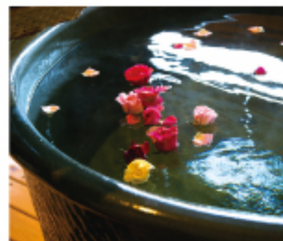
特別な記念日にぴったりのローズバスプラン。ハーフシャンパン付。麗麗のカゴには「誕生日おめでとう」、「結婚してください」、などお好きなメッセージを添えて。

彩られた屋の景色も魅力的だが、ぜひおすすめしたいのは濃紺の世界へ移り変わっていく夕暮れ時の入浴である。季澄香では日暮れとともに庭にかり火が焚かれはじめる。ゆらゆら揺らめく幻想的な炎を眺めながら流れる半露天風呂は、疲れた心と身体を優しく解きほぐしていくはずだ。 季澄香には温泉棟が併設されており、そこでは広々とした庭園の露天風呂に入ることのできるのだが、やはり静かな時間を過ごしたいと、部屋の半露天風呂を贅沢に楽しむ人が多いという。また、部屋の風呂を少し趣向を変えて楽しみたい人には、バラやりんごなどを浮かべた特別な湯船を用意してくれるそうだ。鮮やかなバラやりんごで彩られた湯船は大切な人へのサプライズとしても喜ばれるだろう。 そもそも、季澄香は女性に喜ばれる繊細なおもてなしが特徴的な宿である。宿の名前に香という文字が含まれているように、香りをテーマにしたオリジナルのおもてなしを行っており、宿泊客はその日の気分やコンディションに合わせてアロマオイルを選ぶことができる。選んだアロマオイルはシャンフーやコンディショナーにブレンドして、自分好みの香りを楽しむことができるのだ。