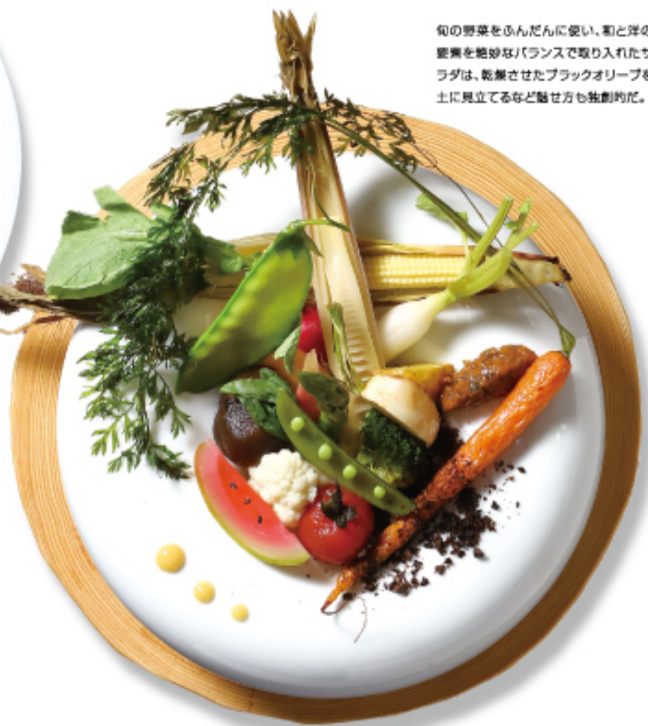
旬の野菜をふんだんに使い、和と洋の要素を絶妙なバランスで取り入れたサラダは、乾燥させたブラックオリーブを土に見立てるなど魅せ方も独創的だ。