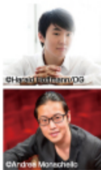
上 チョ・ソンジン、下 反田恭平

トが歌い上げる壮大なオペラをぜひじっくりと堪能してみたい。そして、ロイヤル・バレエと並び英国バレエの双璧をなす英国パーミンガム・ロイヤル・バレエ団も大きな見どころである。演目の「眠れる森の美女」は古典バレエの中でも最もゴージャスで様式美にあふれた作品。演劇の国、英国ならではの緻密な物語性、重厚感に満ちた舞台と黄金色に輝く衣裳。そしてチャイコフスキの崇高な音楽で、バレエの真髄が味わえる。また、一昨年のシヨパンピアノコンクールで優勝したチョ・ソンジンとフランクフルト放送交響楽団の共演、様々なメディアで取り上げられ話題の人気天才ピアニスト、反田恭平とロシア・ナショナル管弦楽団の共演も非常に楽しみ。他にも世界のトッププレイヤーによる公演が予定されており、名古屋国際音楽祭は今年も多く聴衆を魅了させてくれるに違いない。