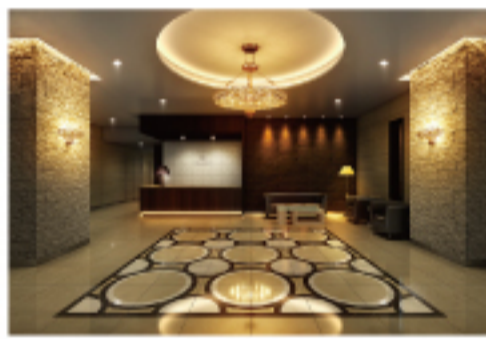
大理石や天然石タイルによって重厚な美しさが漂うオーナーズラウンジの奥には、コンシェルジュカウンターを設置(完成予想図)