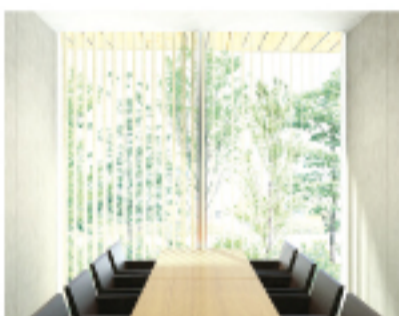
プライベートルームやバンケットルームは会議や打ち合わせなどで利用することも可能。