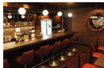
3月2日にオープンしたばかりの新店の店内。