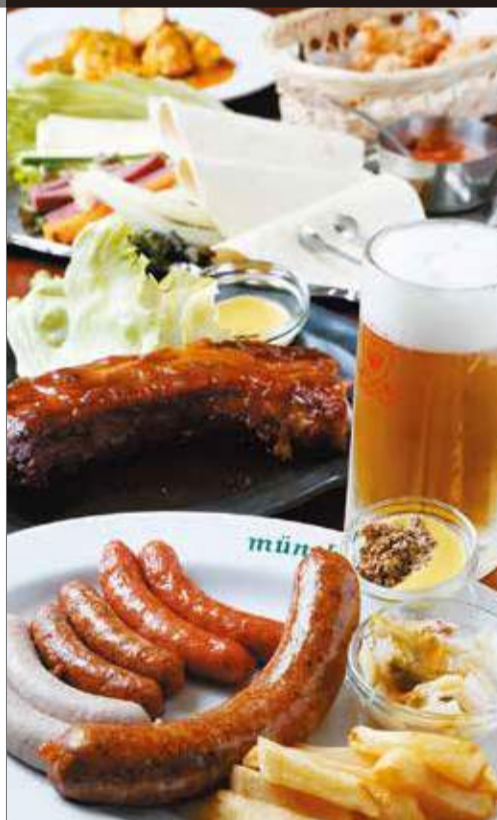
四条河原伝統の洋食を、こだわりの生ビールとともに。