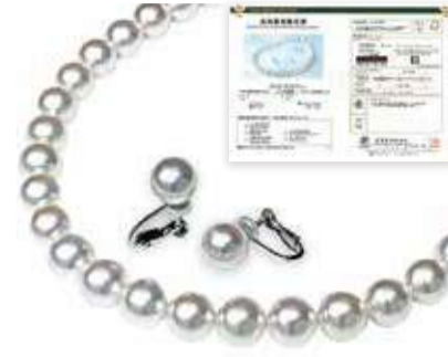
オーロラ天女 花珠真珠ネックレスセット 8.5~9ミリ ¥228,000/9~9.5ミリ ¥358,000 ※他のサイズもご用意。