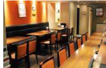
「ハウスミュンヘン」には喫煙席もあり。