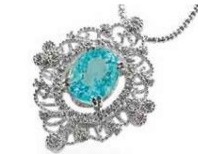
Pt パライバトルマリン NC PA3.283ct D0.65ct ¥780,000

Pt パライバトルマリン NC PA1.19ct D0.44ct ¥398,000/Pt タンザナイト リング TA5.67ct D0.69ct ¥680,000/ K18WG ルビー リング R1.82ct D0.22ct ¥198,000/K18 アコヤ真珠 ダイア NC ¥268,000