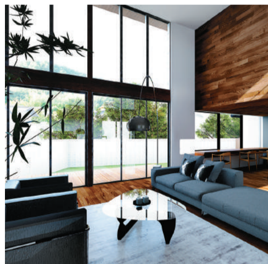
まさに現在、建設中の3邸。実物と見紛うこちらは、初回プレゼン時に提示するCG画像だ。初期段階の打ち合わせから陽の入り方や家具のイメージを高い精度で共有しながら家造りを進めていく。CGをそのまま鏡のように仕上げるプロの仕事を公開予定である3邸のオープンハウスで体感したいものだ。

を測定。それどころか、施主に 温湿度計を置くよう依頼し、 完成入居後まで設計上の住 性能との乖離がないかを調べ るというのだから恐れ入る。 こうした姿勢はすべてに貫か れており、たとえば採光部ひ とつをとつても各時間帯の入 射光まで予測するという。こ の本気の「ライフシンの設 計」力は、特に諸条件が込み 入る狭小地や密集地で威力 を発揮する。上の写真はその 好例だ。