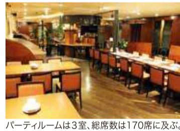
パーティールームは3室、総席数は170席に及ぶ。