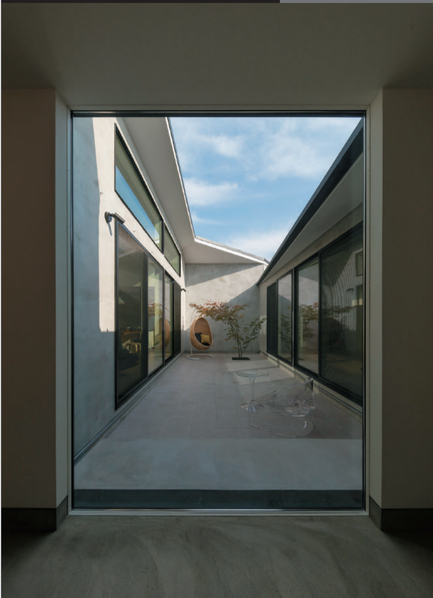
口の字型に配された平屋の住まいに設けられた中庭。屋根の高さを変えて日光の入射角度を調整し、周囲を囲む2階建ての家の存在感を消すという見事な設計が展開されている。まさに「根拠に基づいたデザイン」による「ライフシーンの創造」そのものと言えよう。

住まいは、住む人の暮らし と思いを包み込む「幸せの 入れ物」。そんな視点で家づく りに向きあう「ビルド・ワーク ス」社は、日々「いい家」のあ り方を考えている。同社のサ イトを見ると、派手な宣伝が ない分、人と住まいに対する 真摯な姿勢が伝わってくるは ずだ。