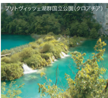
プリトヴィツェ湖群国立公園(クロアチア)

また、7日目のドロブニク旧市街も必見だ。「アドリア海の真珠」とも賞賛されるクロアチアの世界遺産で、パロックルネサンスゴシックといった各様式の建造物を一挙に観賞できる。上の写真は、2日目に組み込まれたブレッド湖。教会が建つ小島が湖に浮かぶ光景は、欧