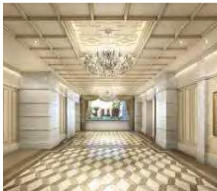
「Brillia夙川」エントランス完成予想図

※完成CGは、計画段階の図面を基に描き起こしたもので、形状・色等は実際とは異なります。外観形状の細部・設備機器等は表現しておりません。また、植栽は竣工から初期の育成期間を経た状態のものを想定して描いており、竣工時は植物の育成を見込んで必要な間隔をとって植えています。※設置予定の家具等を表現しておりません。