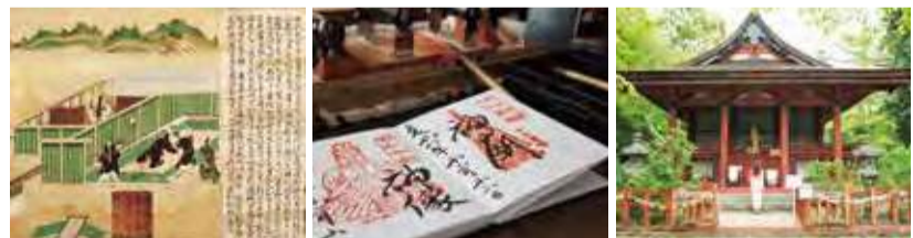
「乙巳の変」の絵巻物。この後の一連ここでしか手に入らないユニークな御朱印も人気。3種類用意されている。恋神社目当ての方は、「恋の道」をまっすぐ進んで東殿へ。