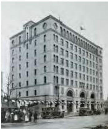
1929年(昭和4年)竣工当時の本社ビル 関東大震災から得た知見や最新鋭の技術を総動員し、完成した本社ビル。テナントには商社や貿易会社、保険会社などが入室し、盛況であった。

い手にとっては造り手の仕事を直接確認でき、売り手にとっては技術・品質への絶対的な自信を示しながら情報開示責任を果たせる取り組みとあって、高い評価が集まっている。 供給する全邸にトリプルセキリティの採用を義務づけるなど、創業から今まで自らに高いハードルを課す東京建物。そのクオリティは、たとえばまもなく販売開始予定の「ブリリア夙川」でも深く理解できるはずだ。阪急神戸線「夙川」駅へ徒歩2分の三方角地、25邸限定のプレミアムな物件なので、120余年を生き抜いてきた歴史の重みを感じたい。