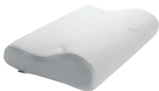
オリジナルネックピロー M 定価14,000円(税別) ※フェア対象外