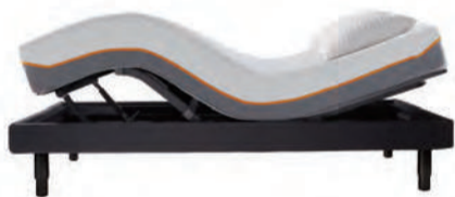
ゼロジー® カーヴ® シングル ※フレームのみ 定価300,000円 フェア期間中のみ 255,000円(税別) 15%OFF