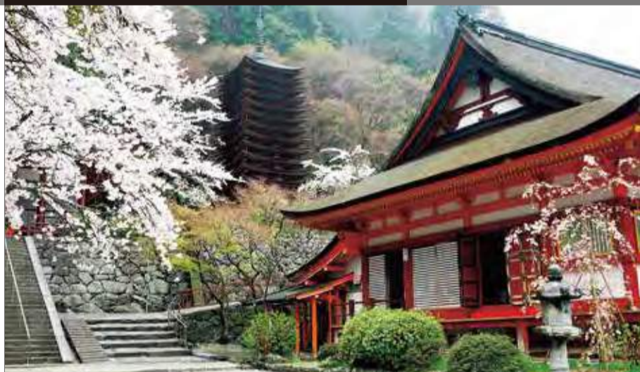
社殿、ウスズミザクラに十三重塔…境内は絵に描いたようなフォトジェニックスポット。ちなみに秋は紅葉の名所でもある。