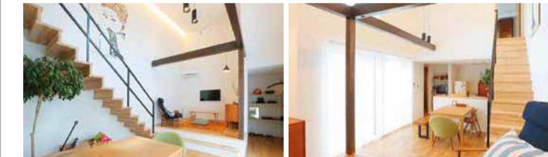
【写真上】「大きなガレージを挟んで互いを温かく見守り合う親子」というイメージそのままのデザインだが、両者の「背丈」の違いが内装の工夫に活かされている。【写真下・2枚】ともに子世帯のリビングダイニング。小上がり、化粧柱、高い窓と階段…温かみのあるインテリアに設計の妙が映える。