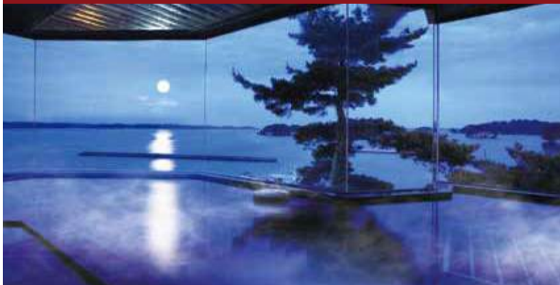
【太古温泉 松島温泉】太古の地層で育まれた、さらさらとお肌にやさしい天然温泉です。

大浴場に露天風呂、2つの貸切露天風呂、足湯を備えた月見台。日本三景の一角松島のさまざまな表情を、個性的な湯の情緒と共に愛でる贅沢を味わえる絶景の宿だ。 湯煙の向こうに浮かぶ小さな島々と、その間に揺れる月影は、思わず一句詠みたくなるような風情。松島の風景は各客室からも味わうことができ、中でも展望風呂付きの4室は展望風呂、広縁、書院など、それぞれ異なるシチュエーションで満喫できる。食事は、和のフルコース、炭火焼き、部屋食の三通り。いずれも三陸の海の幸をふんだんに味わえる絶品ぞろいだ。