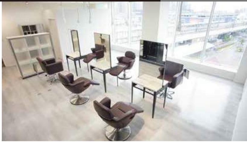
先月からスタートした「ヘアケアジム」も好評。細かいカウンセリングをもとに自分に合ったプランを提供してくれるので安心だ。

いよいよ春も目の前。始まりの季節は「新しい自分へ」と踏み出すチャンスでもあるので、まずは髪型のチェックから。ダメージヘアから薄毛まで、髪の悩みは人それぞれだが、季節の変わり目は「コンディションを崩しやすいので、頭皮の状態をしっかり把握するところから始めたい。」 長町の美容室「サロンバイアール」では、ジム感覚で髪と頭皮を「鍛える」ことができる定額プランで「ヘアケアジム」をスタート。自分のペースで好きな時間に通いながら、じっくりと髪のケアに取り組めるのが魅力だ。初回のカウンセリングでケア方法を見極め、体質や目的に合ったヘアケアが可能。独自の育毛発毛促進プログラムも豊富で、スペシャルな体験プランも用意されているので、まずは様子を覗いてみよう。