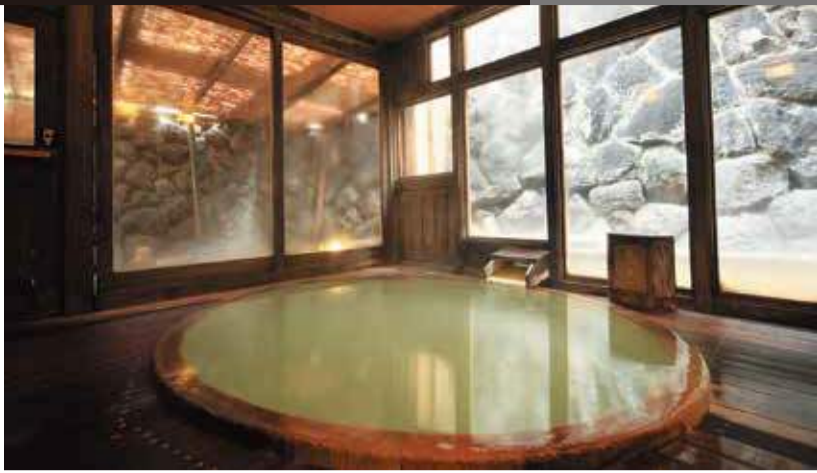
悠久の時を超えてこんこんと湧き続ける蔵王温泉屈指の源泉をかけ流す贅沢。「美肌の湯」として女性にも人気とか。

西暦1100年頃、日本武尊の家来吉備多賀由が発見したという伝説が残る山形蔵王温泉。かつては最上高湯と呼ばれ、福島県信夫高湯、山形の白布高湯とともに奥州三高湯のひとつに数えられていたそう。この地で、何と「創業から千年は経っているはず」とされる名宿がある。聞き間違いはない、何しろ現館主で33代目というのだから。 超老舗宿「おおみや旅館」は、現在は大正期のロマンあふれる全館畳敷きの建物で魅力だ。館内にある5つの湯は、もちろんすべて源泉かけ流し。硫黄の香りの中、湯華が舞う日本最古級の名湯に浸かるだけでも特別な時間となるだろう。食事は、山形牛をはじめ地元旬にこだわった地産地消の和食会席。歴史、湯、味覚のすべてが揃った和の休日、大切な人とともに。