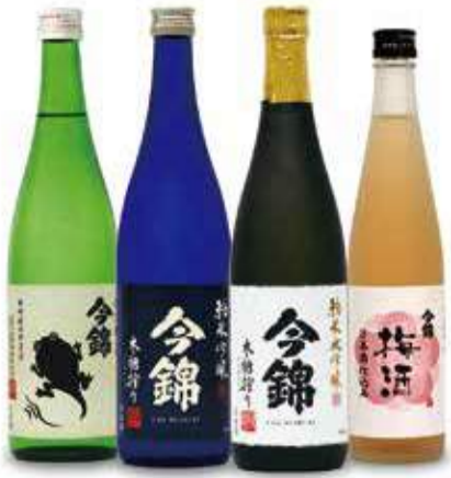
信州・中川村のお米のみで生産された「美山錦」100%の今錦「中川村のたま子」が人気。

「日本で最も美しい村連合」をご存じだろうか。平成17年、7つの町村から結成したNPO法人で、現在は60以上の村や地域が加盟し、多数の企業や団体らが地域おこしに貢献している。人気の「かんてんばば」を運営する「伊那食品工業」は、その代表格。同社グループは地域の米や酒造りを支援しており、明治40年創業の「米澤酒造」も傘下で伝統を守っている。同社は昨年、看板銘柄「今錦」が世界規模のワイン「コンペ」IWCのSAKE部門で銀賞を受賞するなど、いま最も脚光を浴びる蔵のひとつ。南アルプス伏流水と棚田米を使用し、現在も木槽でもろみを搾る「おたまじゃくし」をはじめ、冴えた飲み口は格別だ。