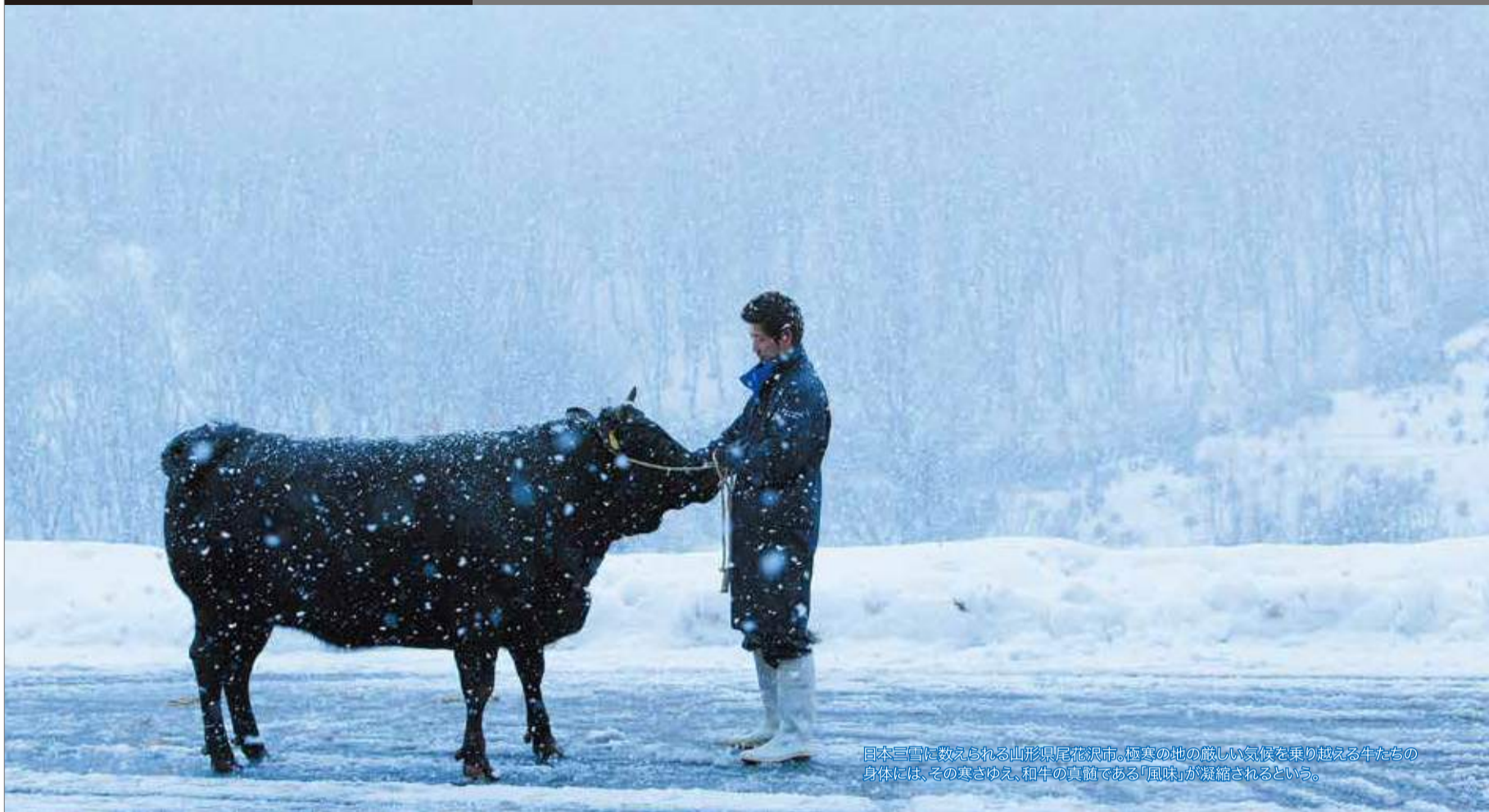
日本三雪に数えられる山形県尾花沢市。極寒の地の厳しい気候を乗り越える牛たちの身体には、その寒さゆえ、和牛の真髄である「風味」が凝縮されるといふ。