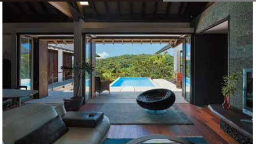
「ZAVI」 設計:岡部義孝[岡部義孝建築設計事務所] 施工:ASJ沖繩北スタジオ

家づくりを検討中の誰もが一度は夢見る建築家との家づくり。しかし、「敷居が高く一歩が踏み出せない」と躊躇する人も多いはず。そんな悩みを解決してくれるのが、日本最大級の建築家ネットワーク「ASJ(アーキテクト・スタジオ・ジャパン)」だ。全国で2800名以上の登録建築家と高度な技術力を持つ建設会社(スタジオ)により、家づくりをサポートする会員制サービス。入会すれば、会報誌の購読や自分に合った建築家を紹介してくれる上に、建築家から無料でプラン提案を受けられる。