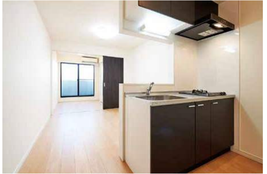
アメニティジョイハウス社が手がける物件の典型的な例。1フロアを3室に抑えて1室の面積を広く取るため、入居者の評価も高い。言うまでもなく、地震対策も実施済みだ。