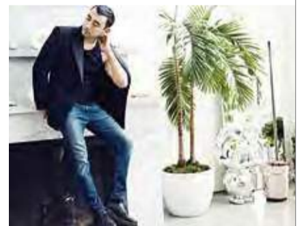
実は沼津生まれ、ガガ様同様の超絶目家！ ニコラ・フォルミケッティ Nicola Formichetti

愛用者が増え続けているが、もっと工夫できるはず。というわけで、スリットと解決してくれそうな気配を発散するアイテムが登場した。 「ドクターVAPE」は、「ガガ様」ことレディ・ガガのスタイリストとして大ブレイクを果たした「ニコラ・フォルミケッティ」氏が手がける、新時代のVAPE。ニコチンゼロ、タールゼロの日本市場専用モデルだ。 コンセプトは「世界一おいしくて健康な電子タバコ」。現在はマスカットやアップル、バナナなど、日本人好みのフレーバーが6種類セレクトされている。100年以上の歴史を誇る老舗香料メーカーとともに新規開発されたこれらの味は、「日本人の味覚は世界で最も繊細だ」と思っているニコラのディレクションの賜物。吸ってみると、従来製品よりも深く、