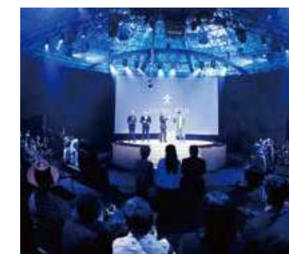
粘土製のレコードに刻まれたのは、ルイ13世&ファレル・ウィリアムスのコラボ曲「100 Years: The Song We'll Only Hear If We Care」(私たちが変われば聴ける曲)。ウィリアムス氏自身も今後はプレイしないというので、まさしく「幻の曲」となった。