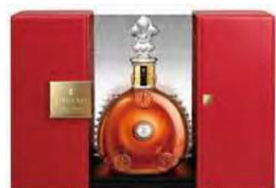
レミーマルタン ルイ13世 280,000円(税別)

ルイ13世のセラーが浸水しなければ、今回の企画は完遂する。その日常が守られたなら、コラボ曲も自動的に100年後の世界に届くのだが、それが実現するか否かは世界の人々の行動次第だ。つまり、イベントに参加しなかった私たちもプロジェクトの参加者。この機会に、自分の環境意識を改めておきたいものだ。