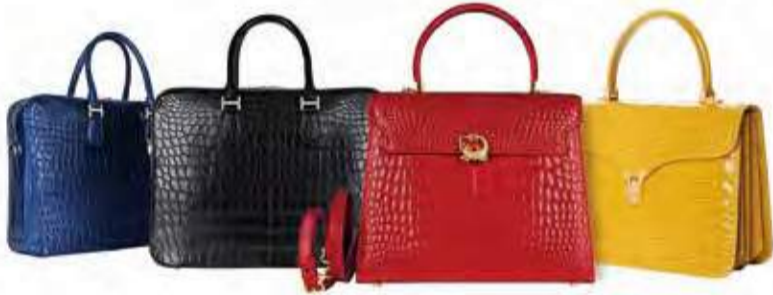
Blue・black / 1,214,000円(税込)、Red / 763,000円(税込)、Yellow / 598,000円(税込) 美しいカットとクラシカルなラインがKWANPENの特徴。男性用、女性用ともコレクションも豊富だ。