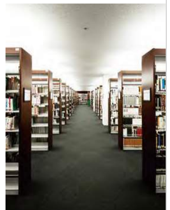
図書館と資料図書館も活用可能だ。図書所蔵数は両者計で実に約90万冊に達するという充実度を誇る。

「明星大学通信制大学院」は、1999年、日本で初めて開学した通信制大学院だ。教育学の高度な専門知識を身につけたいと希望する全国の社会人を対象としており、意欲ある人材を広く受け入れている。各地に居住する学生たちが実践的研究、高度専門職業人として研鑽を積んでおり、全国の教育機関などで研究者や教育者として活躍する人材を多数輩出している。 研究実践主義を掲げる同通信制大学院では、博士前期課程・博士後期課程ともに、研究領域として3つの柱が置かれている。学校教育などで展開される授業研究領域、家庭及び子どもを取り巻く社会環境や保育方法を軸とした幼児研究領域、そして社会的な支援法を含めた障害児者教育研究領域。学校や医療・看護や福祉、ビジネス上の人材教育機関などで働く職業人としての課題を見据え、教育的な専門知識と技術を身に付けながら自立的な研究能力を育めるよう配慮されたカリキュラムが特徴だ。 ユニークなのは、通信制でありながらスクーリング(面接授業)やゼミによる対面指導にも力を入れている点だ。多様なバックボーンを持つ