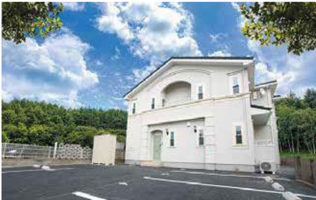
【写真上】内装デザインはいかようにも対応できるが、敢えてヴィンテージ感を残すのがトレンドとなっているようだ。【写真下】少人数制の対話形式によるセミナーで不動産活用を一から教えてくれる。

北国こそ、豊かな住まい文化をつくる。そう、そんな想いを掲げながら、人々の住まいの夢に添え続ける「北洲」。そのひたむきさは多くの施主の共感を呼び、多種多様な住まいを実現しながら、今年で創業60年を迎えた。 真摯な姿勢を貫く老舗だけに、「建てて、売って終わり」では終わらない。アフターサービスやメンテナンスにも積極的に取り組んでいるが、その中で、ずっと気にかけてきたことがあるという。それは不動産の継承による親族間での相続トラブルだ。アンケート調査の結果、家族間トラブルの第1位はお金にまつわるトラブル、第2位には相続関係のトラブルが続く。 「予期していなかった高額な相続税を支払うことになった」「兄弟で相続分割トラブルが起きた」といったことに陥らないためにも、不動産の活用について考え、備えておきたい。