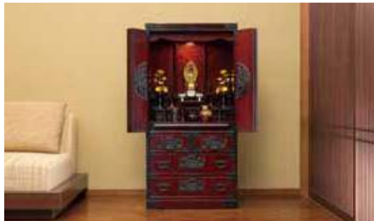
【写真上】仙台箆笥と和室の相性はこの通り。置くだけで、まるで老舗呉服屋のような風格の空間に。写真は「伝承千年の宿 佐助」【写真下・左】驚くのは、普通の洋間に置いてよく映えること。朝昼晩、常に絵になる風景に。【写真下・右】仙台箆笥の手法で作られた「仙台仏壇」が人気だ。純国産のお仏壇ならではの風格と趣がある。