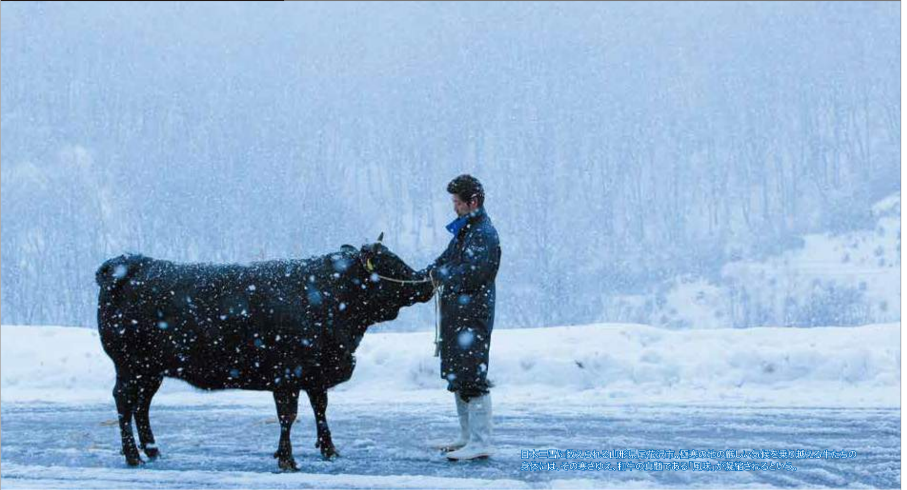
日本三雪に数えられる山形県尾花沢市。極寒の地の厳しい気候を乗り越える牛たちの身体には、その寒さゆえ、和牛の真髄である「風味」が凝縮されるという。