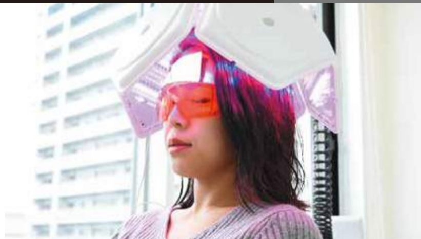
まずは細かく髪を診断し、一人ひとりの状態に合わせたケア法を立案。幹細胞培養液を活用した独自プログラムも評価が高い。

髪の悩みの対処法は千差万別。「市販のアイテムを使っても解決できない」とお悩みなら、カウンセリングサロンに出かけてみよう。