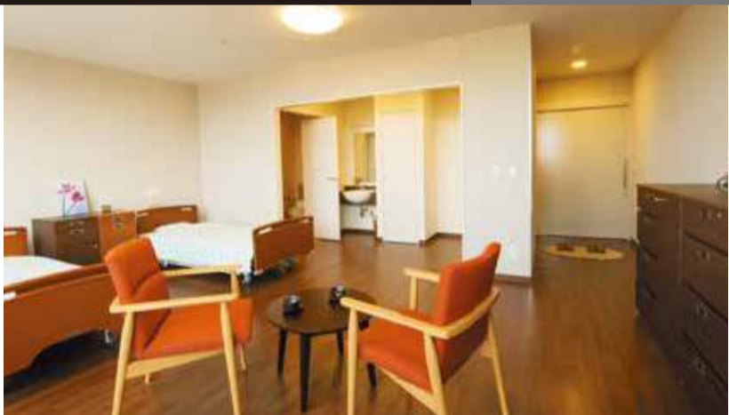
明るく開放的な館内。住宅型に続いて介護付き有料老人ホームも開設したことで、信頼感がさらに高まった。

昨年夏にオープン3周年を迎えた医療機関隣接の住宅型有料老人ホーム「グリーンライフ仙台」。仙台市立病院の隣というプレミアムな立地が人気を博しているが、昨年5月、施設内に介護付有料老人ホームも開設。医住隣接のシニアステージとしての安心感がさらに高まった形だ。