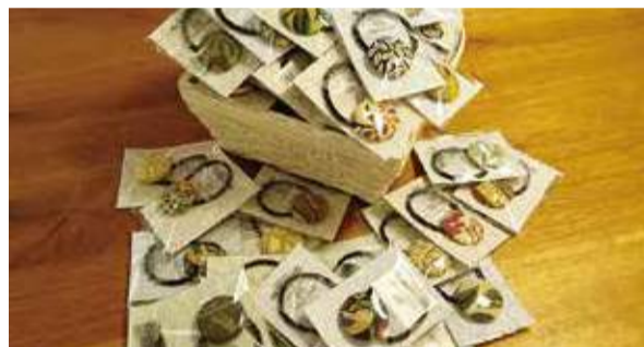
【写真上】人気のマストアイテムのほか、見たことがない模様の生地などのレアアイテムも多数。【写真下・左】William Morris Fairを2月9日(金)～18日(日)まで開催。【写真下・右】期間中に各来店の方に「Morrisへアゴム」をプレゼント。詳しくは弊社ホームページを要チェック!