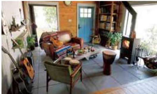
【写真上・下右】ログハウスと言っても9割以上が自宅用途。こちらはグレーの外観に土間リビングや白壁がオシャレなカントリーログハウス。【写真下・左】豊かな自然の中、気の温かみを最大限に活かすシーン提案が展開される敷地内。1日を通して週末は多くの人で賑わう。