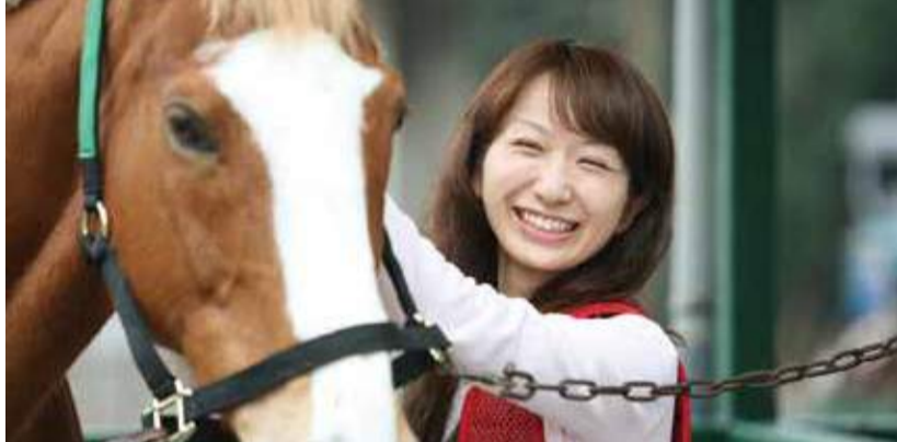
乗馬クラブクレインは、全国33か所で展開中の乗馬クラブ。装具や用具はすべてレンタル可能なので、手ぶらで行ける。

「難しい」「危なそう」「お金持ちの趣味」…「見、敷居が高そうに見える乗馬だが、実はとても簡単な部類に入るスポーツだということをご存じだろうか。ゆっくり歩かせたり、軽く走らせたりする程度なら、運動が苦手な方でも始めたその日のうちに辿り着けるといって、友人に誘われて訪れた人が、穏やかに優しい馬たちの虜になる。初めて乗った60代の夫婦が、毎週のように通い詰めて馬たちとの交流を楽しむ。そんな魅力に溢れた乗馬を試してみよう」というわけで、泉区の「乗馬クラブクレイン」の体験乗馬に5名様をご招待。 馬の背で、秋の爽やかな風を感じる休日。きっと新しい世界が開けることだろう。