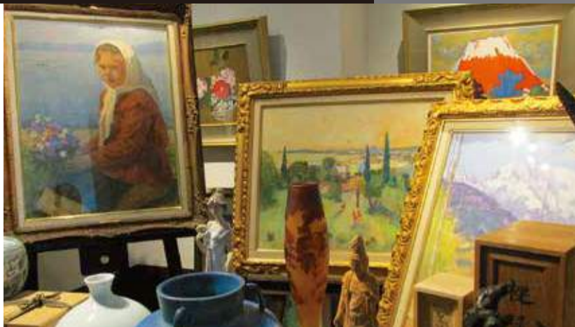
よく分からない品に、依頼主が驚く値がついたりすることも…。企業の鑑定依頼も引き受ける同協会に見てもらえば安心だ。

この年末年始に帰省した際、実家の蔵や納戸はチエックされたらどうか。亡くなった祖父母が生前に大切にしていたものが実は「お宝」だったという話はよくあるが、片隅で埃を被る品は見かけなかったらどうか。