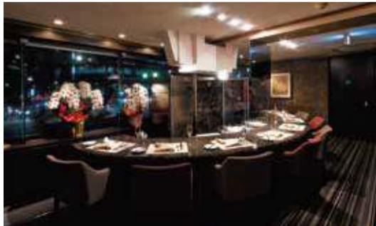
【写真上】夜のコースは15,000円・18,000円・21,000円、昼は5,000円・8,000円・12,000円の各コースが用意されている。【写真下・左】和牛だけでなく趣向を凝らしたアラカルト料理はお肉との相性も抜群。【写真下・右】広がりのある円形カウンターは、複数人で来店しても顔を見ながら食事を楽しめる。