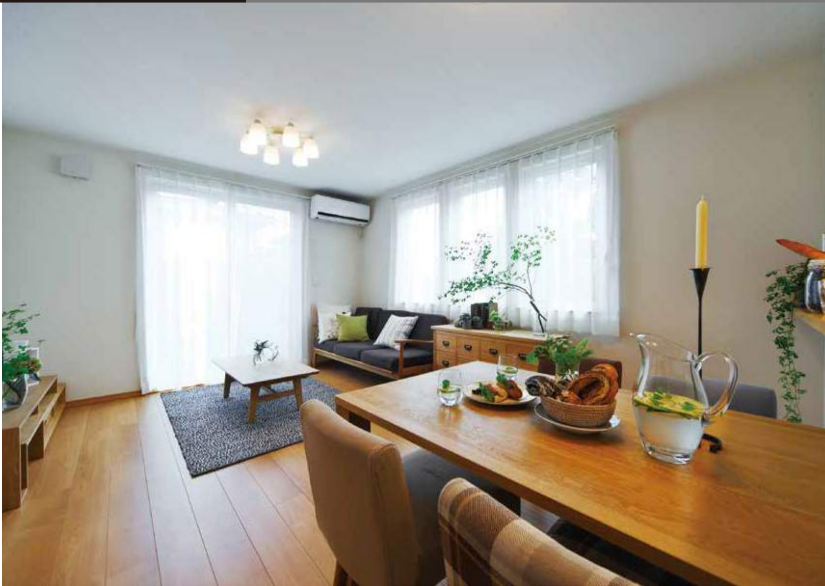
フランスの街並みを意識した賃貸アパート見学会も随時開催中。