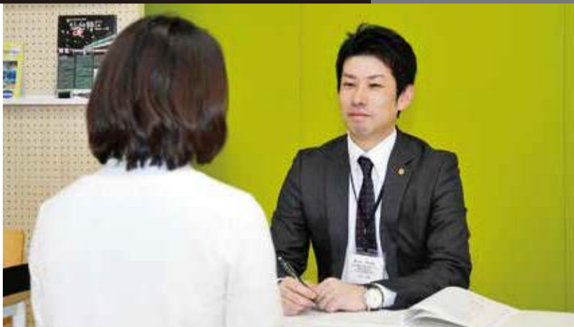
「日本一起業しやすいまち」を目指す仙台市。難題となりがちな労務についての不安や疑問は、気軽に相談してみよう。

就業規則はどう作成すればよいか、労働時間についてはどう考えればよいか、労働条件の設定方法など、企業経営の基本とも言える「労務」の問題。特に新規での起業時には悩みの種となりがちだが、弁護士や社会保険労務士に無料で相談できる場所があることをご存知だろうか。