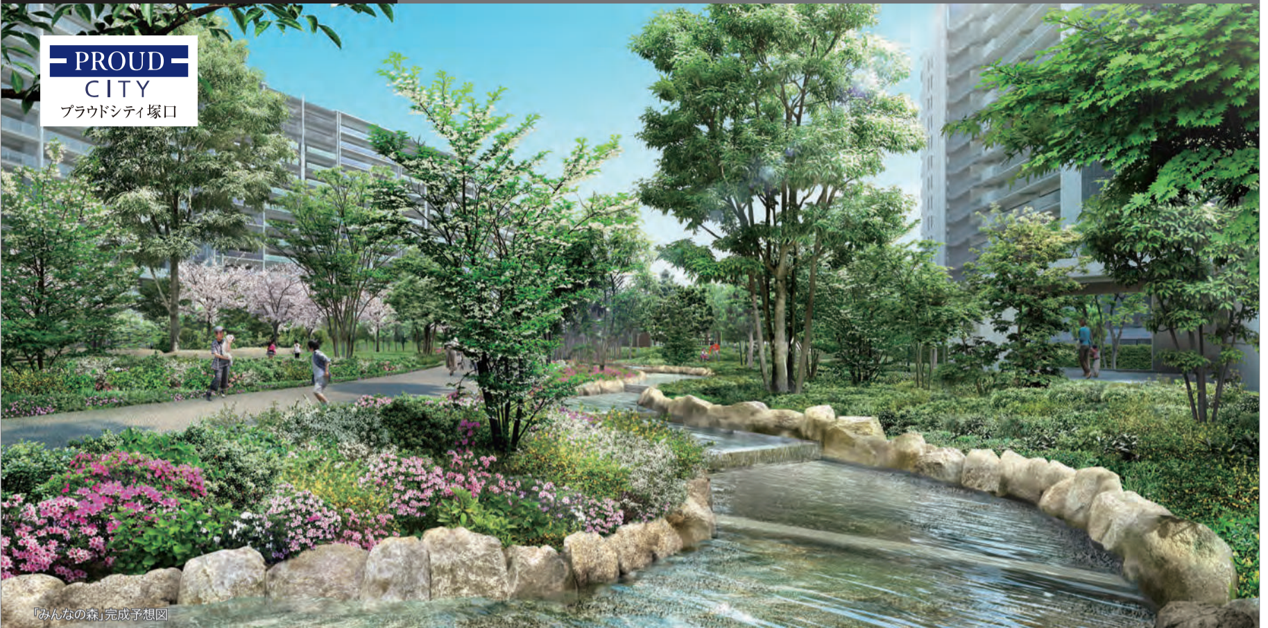
「みんなの森」完成予想図

<全戸南向き> 3LDK 3,398万円~ 4LDK 4,448万円~ 先着順申込受付中