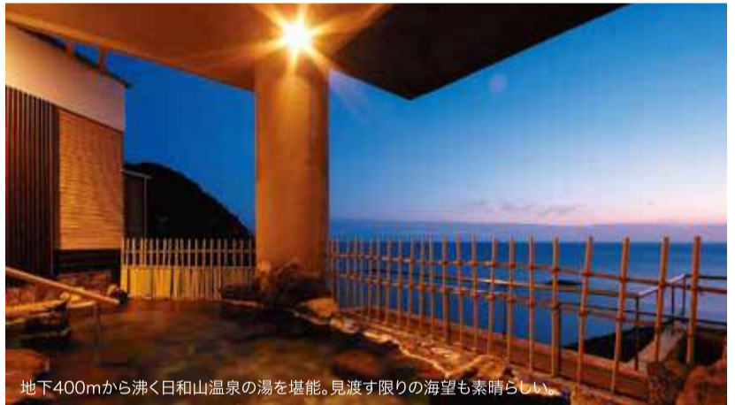
地下400mから湧く日和山温泉の湯を堪能。見渡す限りの海望も素晴らしい。