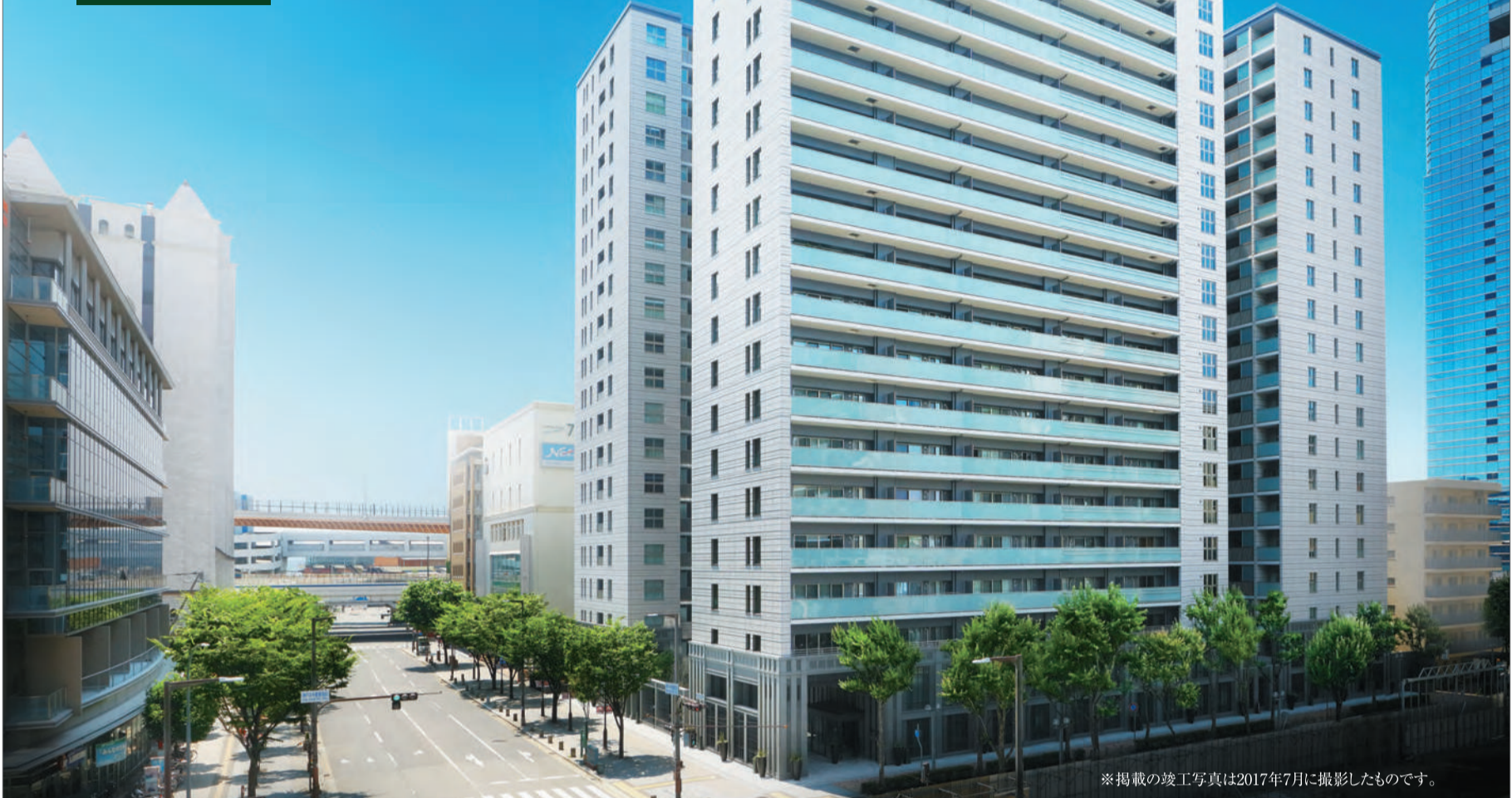
※掲載の竣工写真は2017年7月に撮影したものです。