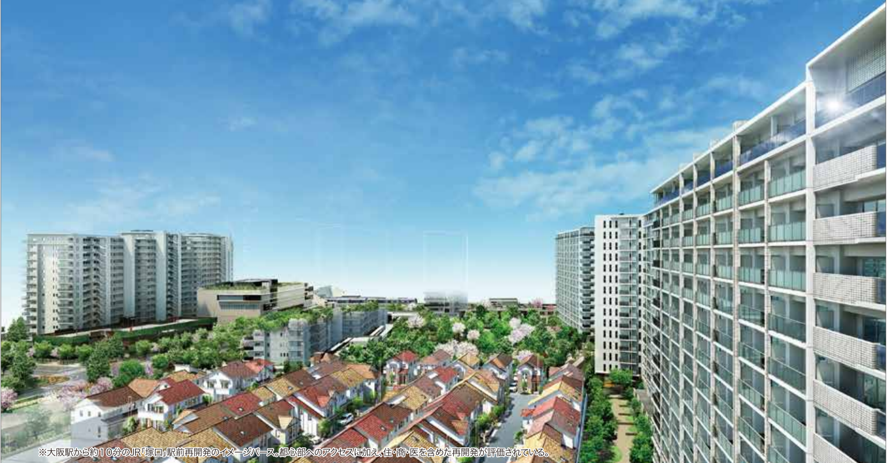
※大阪駅から約10分のJR「塚口」駅前再開発のイヌーパース。都心部へのアクセスに加え、住・商・医を含めた再開発が評価されている。

マンション市場は「西高東低」!? 充実の物件が続出する関西圏の注目プロジェクトをピックアップ。