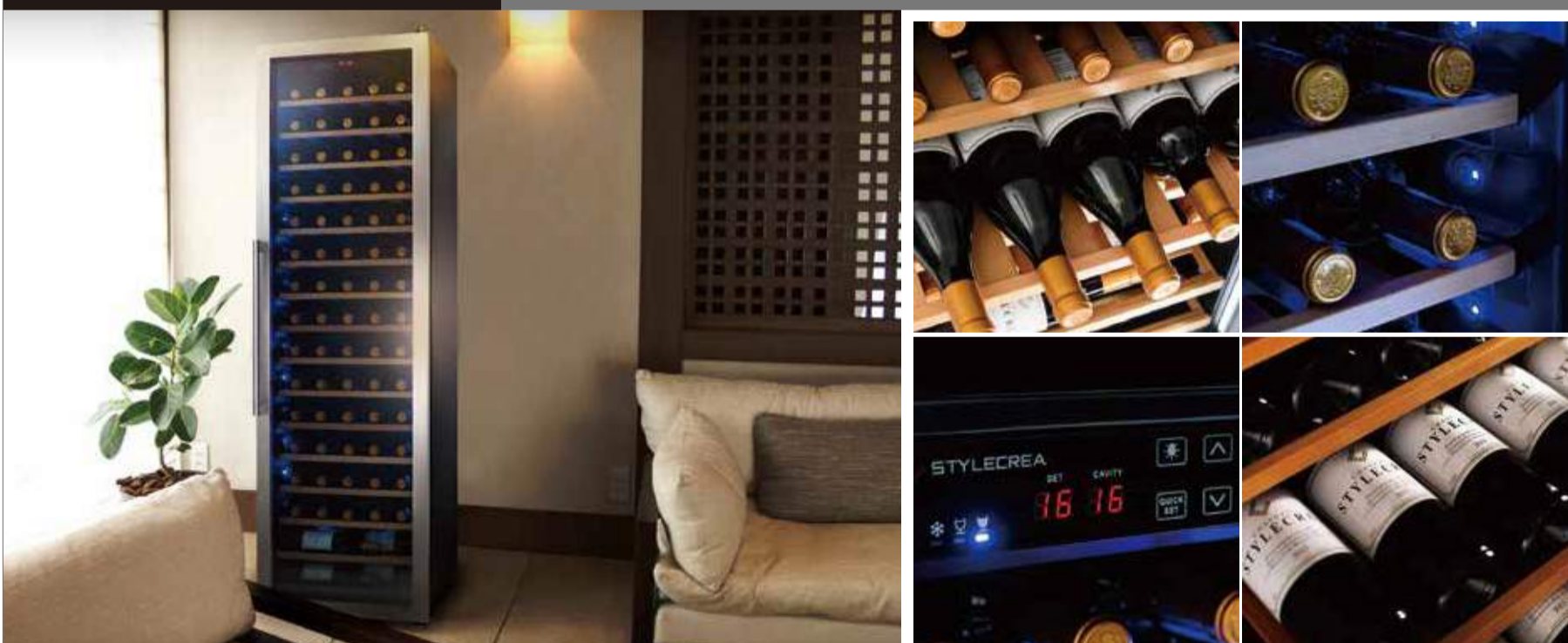
STYLECREA ワインセラー スリムタイプ 「生きもの」に近いワインを、適切に眠らせる本格派。リビングなどへの設置もOK。

とっておきのコレクションは、常に最良の状態でお酒を開きたい。簡単に、美しく貯蔵できる家庭向け本格ワインセラー。