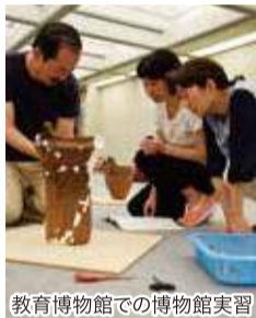
教育博物館での博物館実習