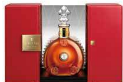
レミーマルタン ルイ13世 280,000円(税別)

ルイ13世のセラーが浸水しなければ、今回の企画は完遂する。その日常が守られたなら、コラボ曲も自動的に100年後の世界に届くのだが、それが実現するか否かは世界の人々の行動次第だ。つまり、イベントに参加しなかった私たちもプロジェクトの参加者。この機会に、自分の環境意識を改めておきたいものだ。