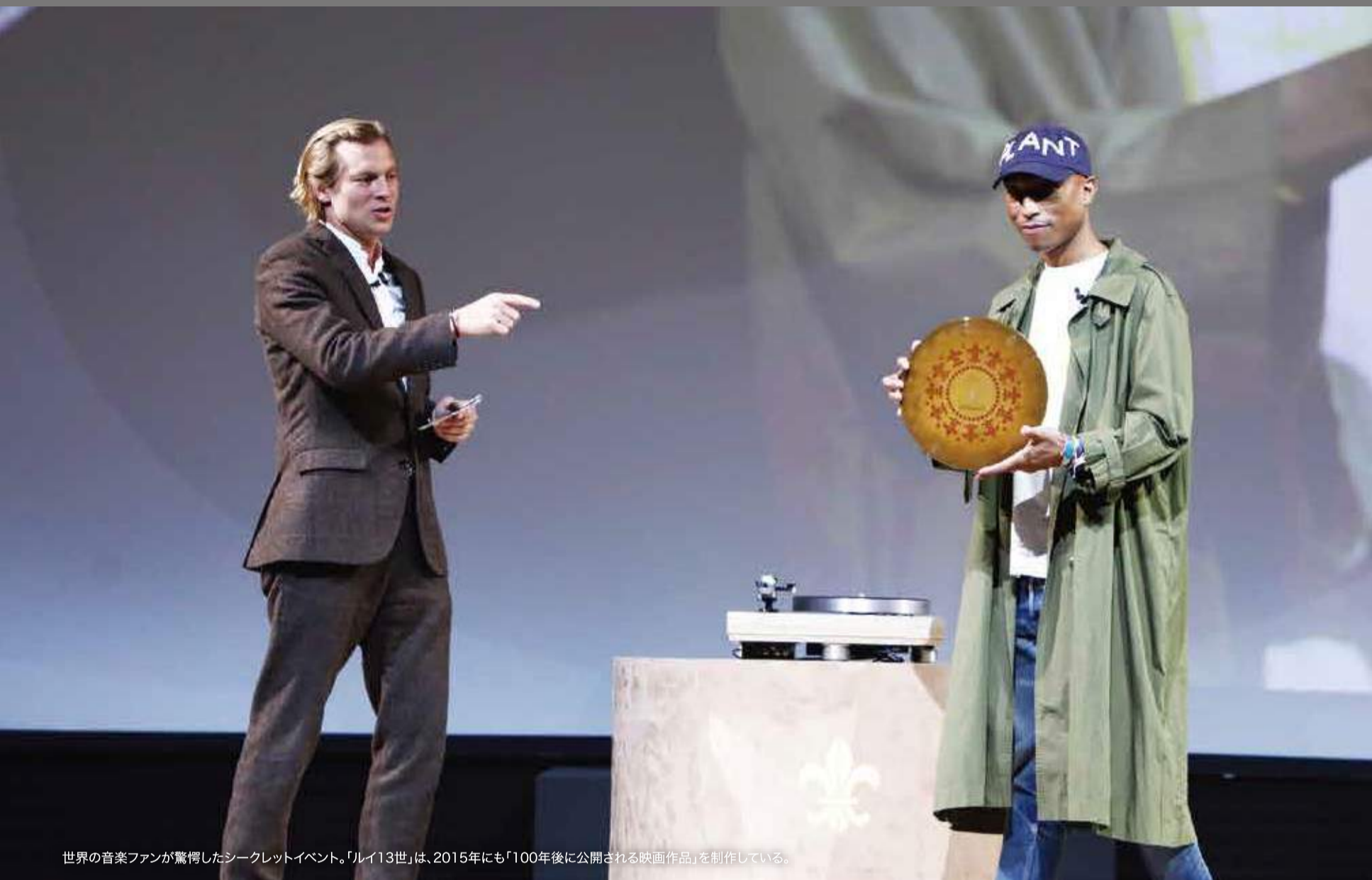
世界の音楽ファンが驚愕したシークレットイベント。「ルイ13世」は、2015年にも「100年後に公開される映画作品」を制作している。