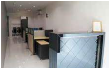
パタヤの弊社オフィス。日本人スタッフも常駐しているので、現地視察の際は日本語&日本品質のサービスで案内してくれる。

有望市場のタイ「パタヤ」で日系企業初のIEE/EIAを取得。「ライジングアジア」社のワンストップ投資支援の魅力とは。