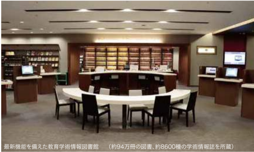
最新機能を備えた教育学術情報図書館 (約94万冊の図書、約8600種の学術情報誌を所蔵)