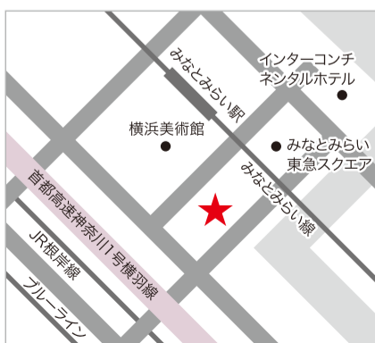
HAYAMA葉駿颯 横浜ランドマークプラザ店