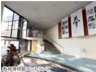
教育博物館エントランス