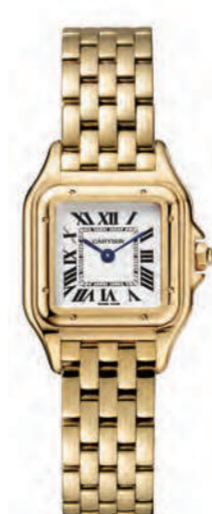
CRWGPN0008 22mmx30mm SM. イエローゴールド 2,214,000円(税込)