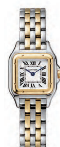
CRW2PN0006 22mmx30mm SM. イエローゴールド、ステンレススティール 815,400円(税込)