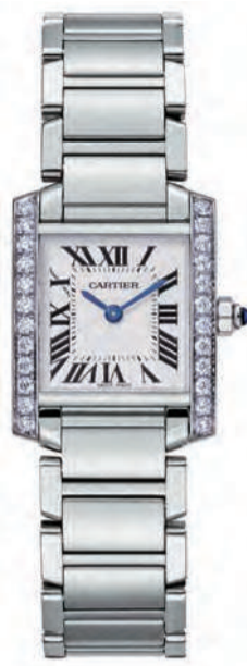
タンク フランセーズ ウォッチ CRW4TA0008 25.35x20.30mm、SM、スチール、ダイヤモンド 785,700円(税込)