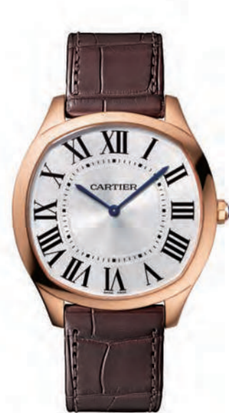
CRWGNM0006 38x39mm. ピンクゴールド 1,814,400円(税込)