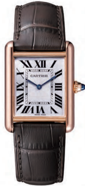
タンク ルイ カルティエ ウォッチ CRWGTAA0011 33.70x25.50mm、LM、ピンクゴールド 1,458,000円(税込)