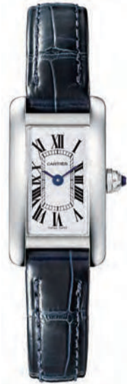
タンク アメリカン ウォッチ CRWSTA0032 27x15.20mm、ミニ、スチール 364,500円(税込) 2017年11月発売予定