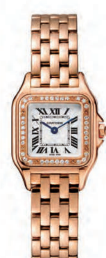
CRWJPN0008 22mmx30mm SM. ピンクゴールド、ダイヤモンド 2,624,400円(税込)