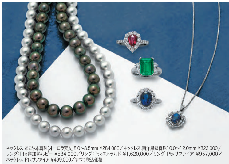
ネックレス:あこや本真珠(オーロラ天女)8.0~8.5mm ¥284,000 / ネックレス:南洋黒線真珠10.0~12.0mm ¥323,000 / リング:Pt×非加熱ルビー ¥534,000 / リング:Pt×エメラルド ¥1,620,000 / リング:Pt×サファイア ¥957,000 / ネックレス:Pt×サファイア ¥499,000 / すべて税込価格

あこや本真珠、南洋真珠、そしてカラーストーン。ダイヤモンド以外にも、心奪われる「本物の美」が多数。