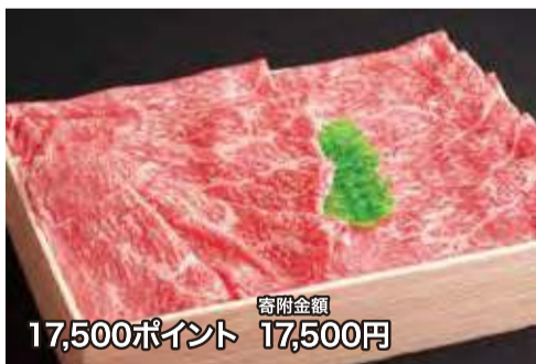
寄附金額 17,500ポイント 17,500円

大川匠のプレミアムギフト 博多あまおう デラックス 15粒、組子箱入 ※受注生産品、配送は受注後2か月前後 冷蔵