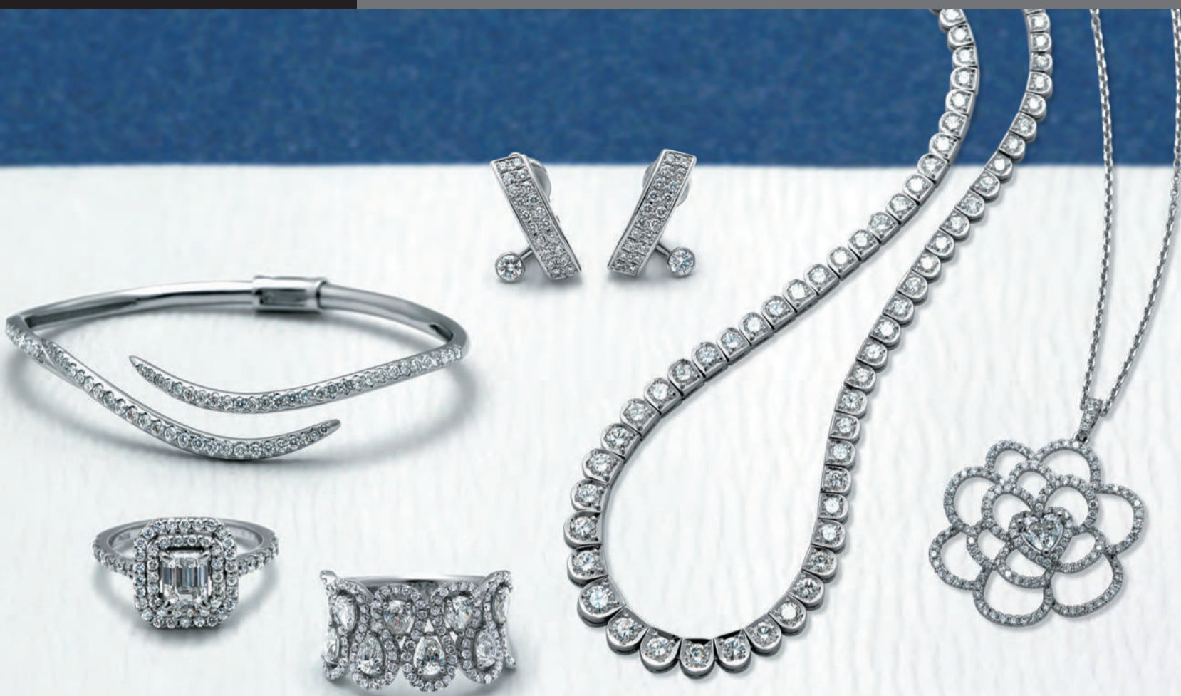
花柄ネックレス: K18WG×ダイヤモンド(ハートシェイプ0.4ct, 他0.95ct) ¥239,000 / テニスネックレス: Pt×ダイヤモンド(合計5.76ct) ¥779,000 / リング: K18WG×ダイヤモンド(ペアシェイプ他合計1.78ct) ¥365,000 / リング: Pt×ダイヤモンド(エメラルドカット1.05ct, 他0.79ct) ¥680,000 / バングル: K18WG×ダイヤモンド(合計1.51ct) ¥300,000 / イヤリング: Pt×ダイヤモンド(合計0.87ct) ¥178,000 / すべて税込価格