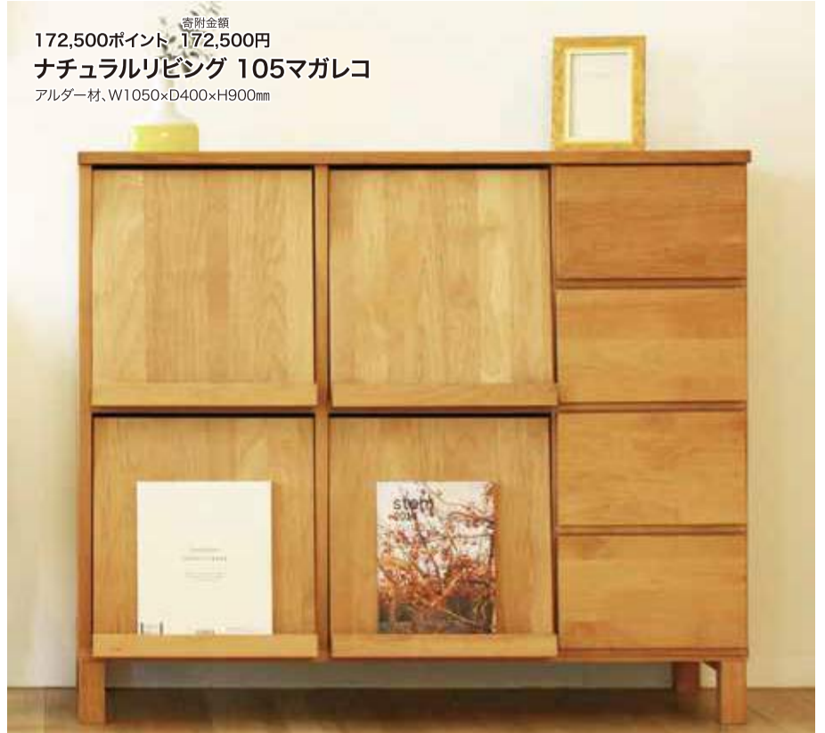
寄附金額 172,500ポイント 172,500円 ナチュラルリビング 105マガレコ アルダー材、W1050xD400xH900mm