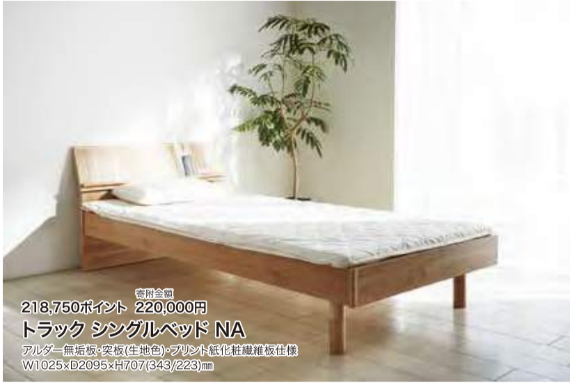
寄附金額 218,750ポイント 220,000円 トラック シングルベッド NA アルダー無垢板・突板(生地色)・プリント紙化粧繊維板仕様 W1025xD2095xH707(343/223)mm