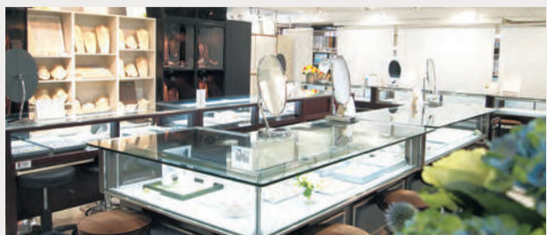
宝石本来の色を正しく見るため、店内はあえて昼白色の照明を使っている

リングやペンダントをはじめとするダイヤモンド・カラーストーン製品から、ブライダルリング、タイピン&カフスまで。自分を含めた大切な人への贈り物を選ぶなら「信頼第二で行きたいもの。特に、クリスマスが近づくと季節は、大きな力になってくれるはずだ。