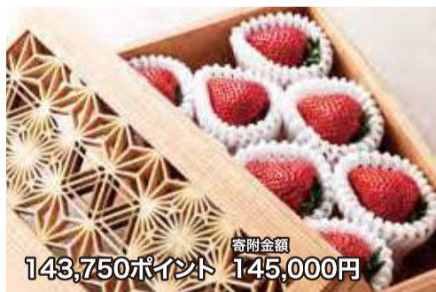
寄附金額 143,750ポイント 145,000円

スツールにランブシード、小物類に至るまで、まるで高級インテリア専門店と見紛うような品揃えは、さすがに木工のまちといったら越えだ。