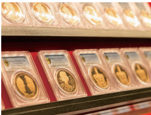
スラブと呼ばれるケースに密封された鑑定済みのコインがずらりと並び「コインパレス」店内。