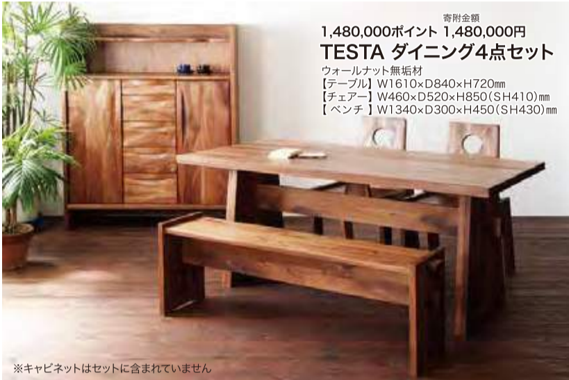
寄附金額 1,480,000ポイント 1,480,000円 TESTA ダイニング4点セット ウォールナット無垢材 【テーブル】 W1610xD840xH720mm 【チェア】 W460xD520xH850(SH410)mm 【ベンチ】 W1340xD300xH450(SH430)mm