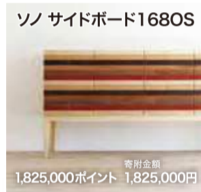
ソノ サイドボード1680S 寄附金額 1,825,000ポイント 1,825,000円