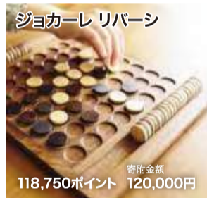
ジョーカーレ リバーシ 寄附金額 118,750ポイント 120,000円