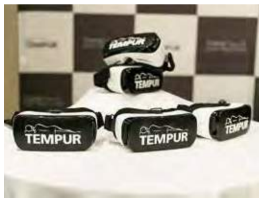
【写真上】Zero-G®の電動リクライニングとともに、話題沸騰中のVR装置を装着し、「理想的な睡眠」をヴァーチャル体験。詳しくは最寄りのショールームにて。