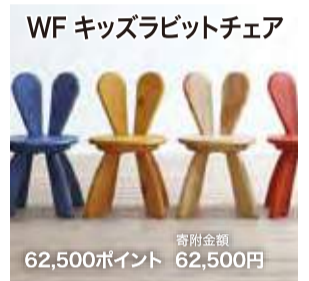
WF キッズラビットチェア 寄附金額 62,500ポイント 62,500円