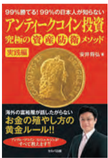
アンティークコインの魅力と投資法として優れている点、投資を始めるにあたってのアドバイスなど、あらゆる情報を紹介している。