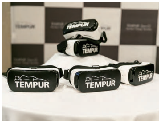
【写真上】Zero-G®の電動リクライニングとともに、話題沸騰中のVR装置を装着し、「理想的な睡眠」をヴァーチャル体験。詳しくは最寄りのショールームにて。