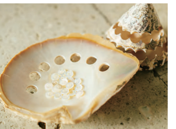
貝でつくられたシェルボタンは美観だけでなく触れも魅力。