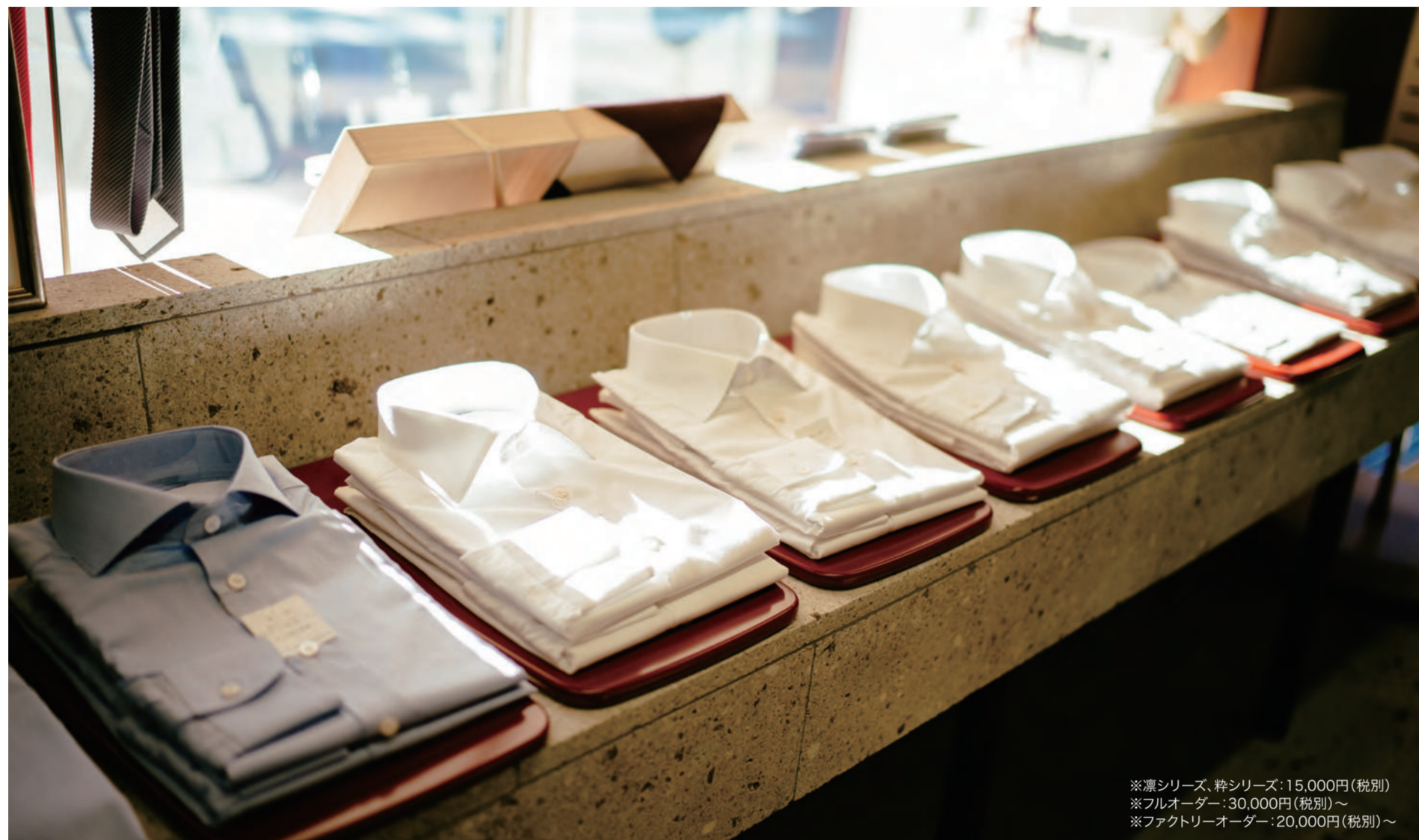
※襟シリーズ、粋シリーズ:15,000円(税別) ※フルオーダー:30,000円(税別)~ ※ファクトリーオーダー:20,000円(税別)~