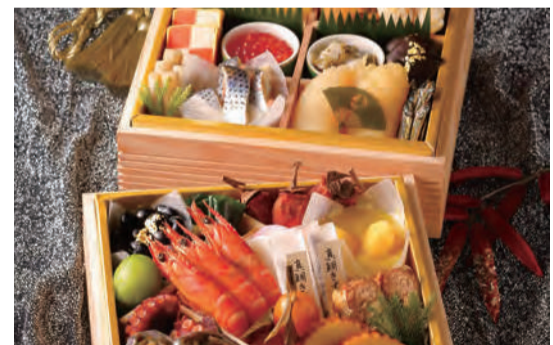
おせち料理予約 予約受付=12月25日(月)まで

かながわグルメやカラダにやさしいギフトなどの特集のほか、日本全国どこでも配送料ゼロのお得なギフト厳選400アイテムを用意。予約受付場所/7階=催事場 お歳暮ギフトセンター