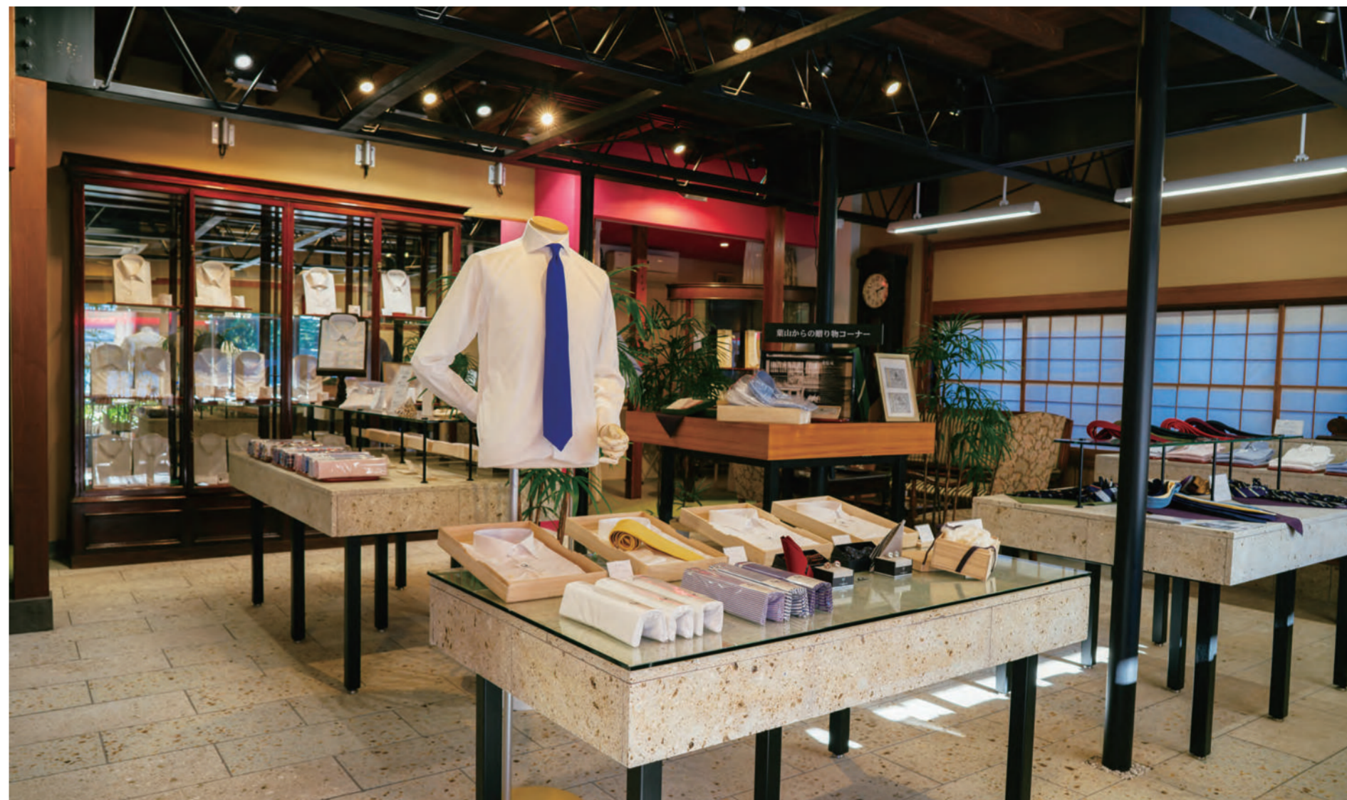
上質なシャツを着ると、それだけで背筋が伸びるもの。粋で、洒落ていて、折り目正しい強さに美を求めた「ジャパニーズ・ジェントルマン」の像を描くシャツであふれる店内。