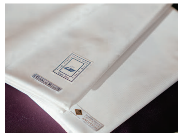
葉山シャツオリジナルからインポート品まで、厳選に厳選を重ねた高品質な生地。