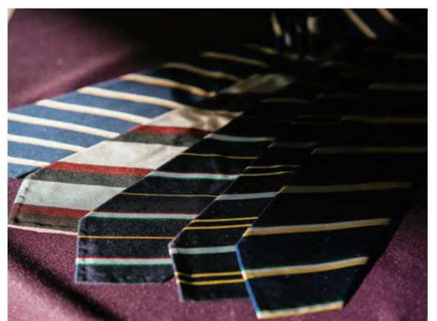
この上質なシャツを着てネクタイにこだわらないなんてあり得ない...