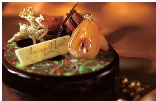
クリスマスケーキ 予約受付=12月20日(水)まで