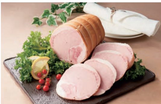
冬の贈り物・お歳暮ギフト 予約受付=12月25日(月)まで