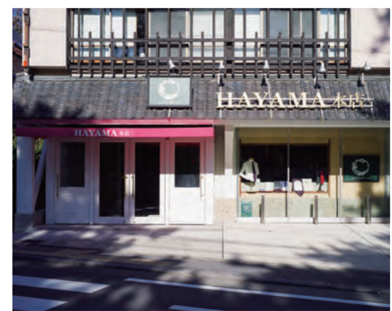
葉山シャツ本店株式会社