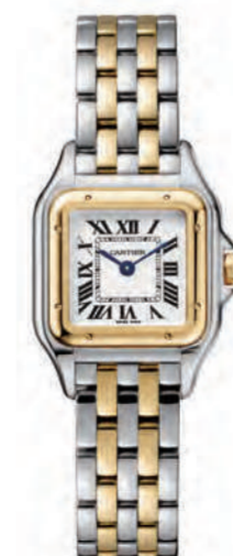
CRW2PN0006 22mmx30mm SM. イエローゴールド、ステンレススティール 815,400円(税込)