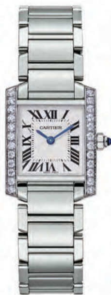
タンク フランセーズ ウォッチ CRW4TA0008 25.35x20.30mm、SM、スチール、ダイヤモンド 785,700円(税込)