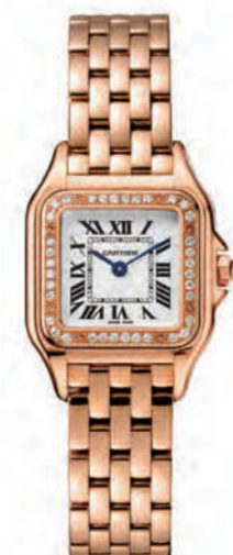
CRWJPN0008 22mmx30mm SM. ピンクゴールド、ダイヤモンド 2,624,400円(税込)