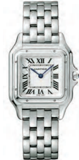
CRWSPN0007 27mmx37mm MM. ステンレススティール 510,300円(税込)