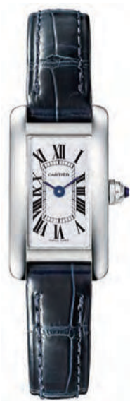
タンク アメリカン ウォッチ CRWSTA0032 27x15.20mm、ミニ、スチール 364,500円(税込) 2017年11月発売予定