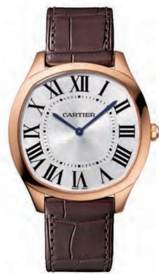
CRWGNM0006 38x39mm. ピンクゴールド 1,814,400円(税込)