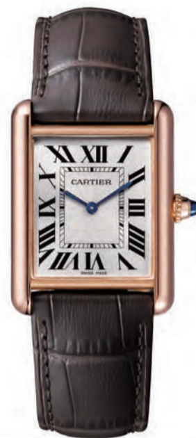
タンク ルイ カルティエ ウォッチ CRWGTA0011 33.70x25.50mm、LM、ピンクゴールド 1,458,000円(税込)