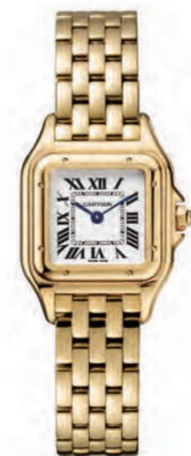
CRWGPN0008 22mmx30mm SM. イエローゴールド 2,214,000円(税込)