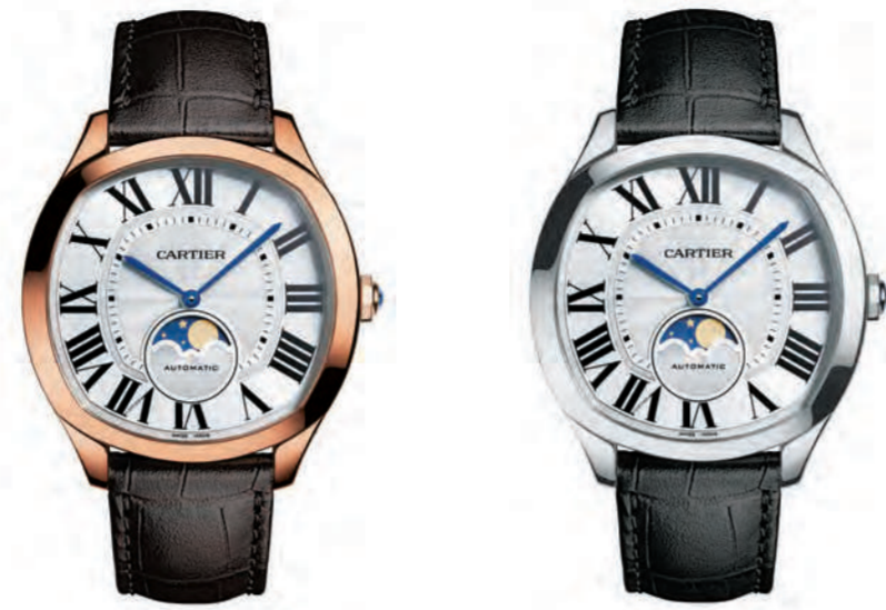
CRWGNM0008 40x41mm. ピンクゴールド 2,473,200円(税込)