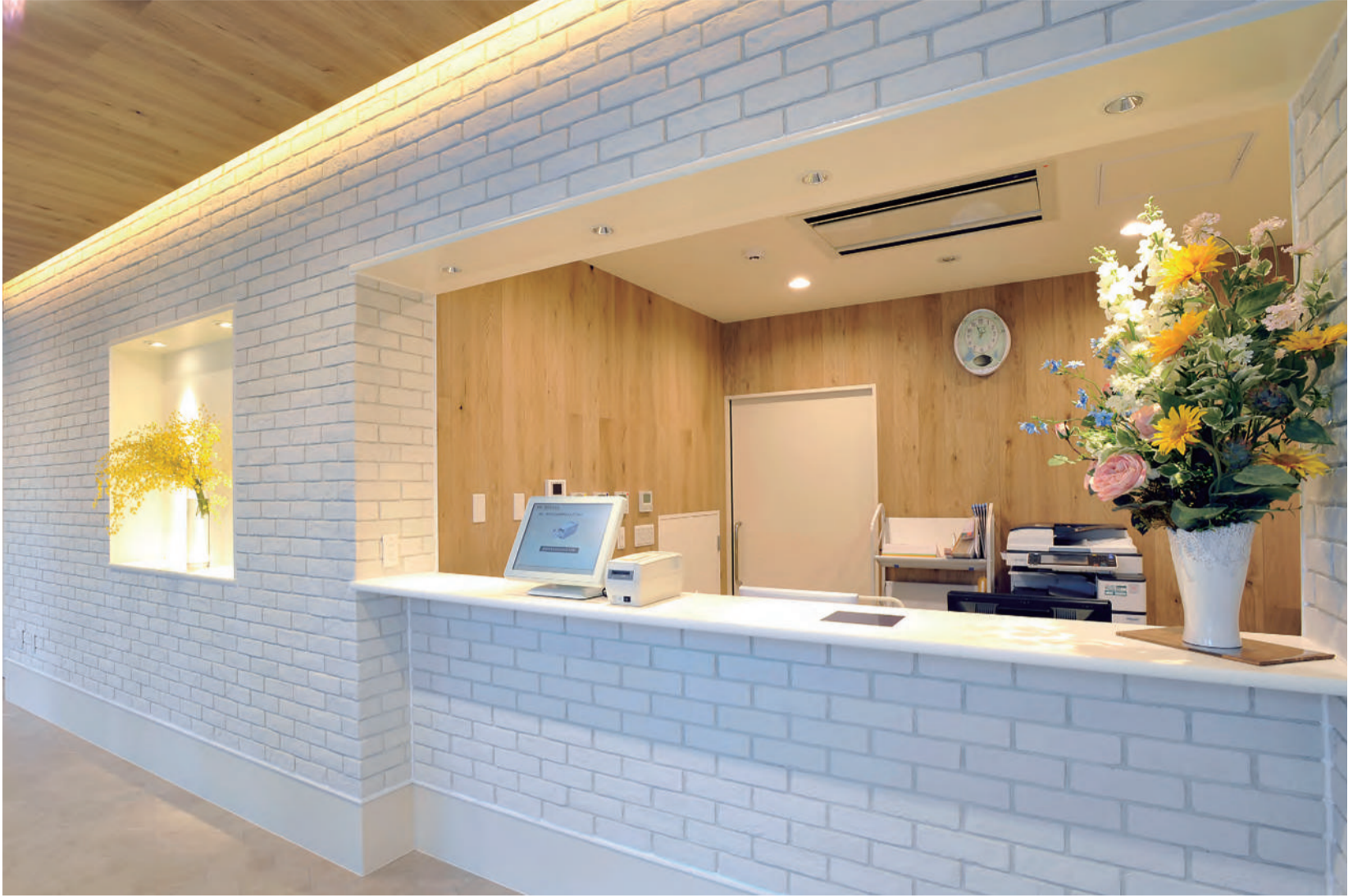
太陽を意味する「ソレイユ」の名の通り、やさしく穏やかな雰囲気の特徴の「仙台ソレイユ母子クリニック」。開院以来、予約申し込みが後を絶たないとか。