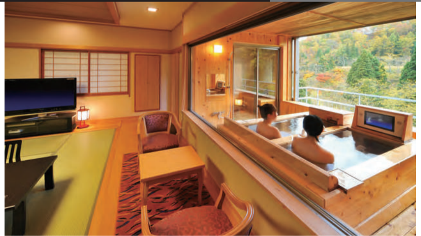
本格和室と温泉、自然のパノラマがシースルーでつながる半露天寝湯付き客室。TVや音楽を楽しみながらの湯浴みも。

「おしん」の舞台として「躍有名」になった銀山温泉。古くから山間の湯治場として知られ、大正末期〜昭和初期の建物が現在も残る美しい街並みは、全国の「温泉郷」のイメージを牽引する存在だ。連がよければ鹿や猿、兎の姿も見かける自然環境が自慢の「銀山荘」は、中心部から数分の高台にある。男女それぞれに内湯、露天風呂に加えて露天寝湯を有する本格温泉宿だ。 日々の疲れを癒すなら、できれば半露天寝湯付きの客室を選びたい。寝湯の大きな窓から眺める銀山川の雄大な自然は格別で、夜間なら室内照明を落とせばライトアップされた夜景も。まさに「何もしい」湯治を満喫できるプレミアムな部屋だ。 全国に名声が轟く山形牛をはじめ、食の面も申し分なし。まずはWEBでプランの確認を。