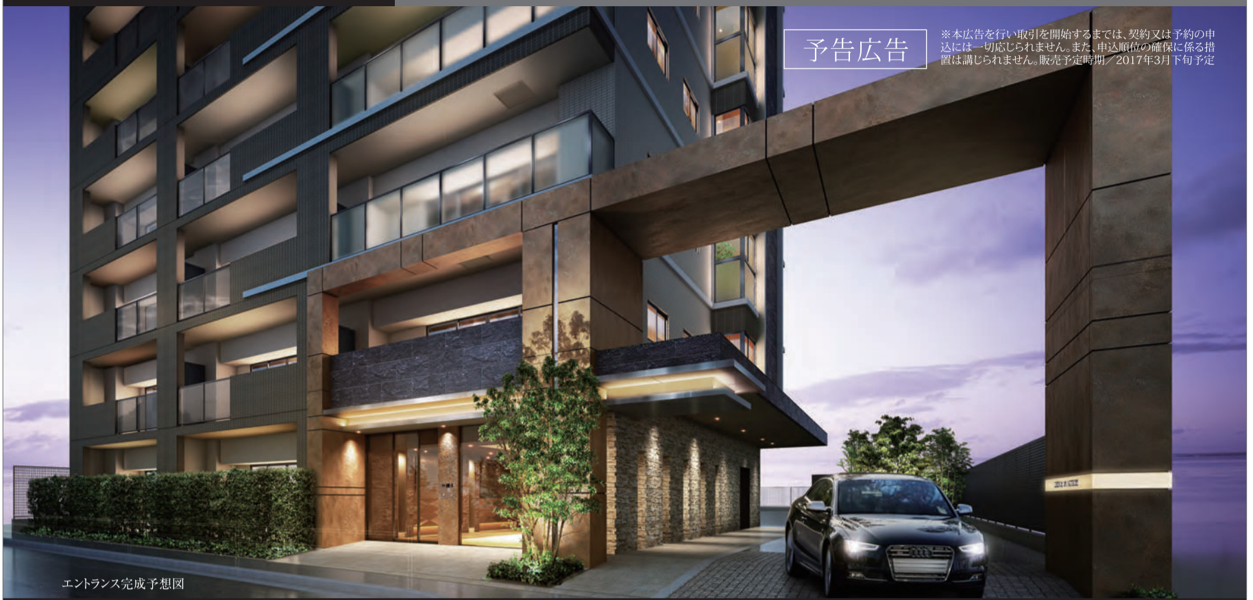
エントランス完成予想図

※本広告を行い取引を開始するまでは、契約又は予約の申込には一切応じられません。また、申込順位の確保に係る措置は講じられません。販売予定時期/2017年3月下旬予定