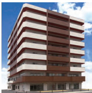
【写真上】写真は、ネクサスコート仙台東のラウンジ。共用部から各居室まで、インテリアのクオリティも高い。【写真左】落ち着いたカラーリングの建物外観。【写真右】看護師や介護スタッフの24時間常勤は、ブランドの大きな特徴。ケアに関する技術も蓄積している。※イメージ写真

でもある。仙台東は15番目のネクサスコートとなるが、市内ではすでに泉中央と愛宕で運営実績を持ち、好評を博している。 同物件は、建物の1階に歯科と調剤薬局が入る複合タイプの施設となっている。協力医療機関の内科・歯科・歯科による訪問診療をはじめとする充実の医療連携体制を軸に、きめ細かなサービスが提供されている。全室床暖房とエアコンを備えた居室、旬の食材を活かして施設内で調理される多彩な献立、館内と外出をバランスよく織り交ぜるレクリエーション、さらには食料や介護用品など多彩な備品を備蓄する防災体制と、これまでのノウハウを活かした生活環境が実現されている。 充実のサービス内容、詳細は是非資料請求、見学予約を急ごう。