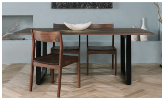
【写真上】腰掛けておくとそのまま眠りに誘われそうほど心地よい「ヘヴンソファ」。組み合わせによるレイアウトの自由度も高い。【写真左】展示品で座り心地を確認してサイズを選んでオーダーするショールームスタイル。【写真右】MASTERWALの記念すべき1stプロダクト「ワイルドウッドダイニングテーブル」。