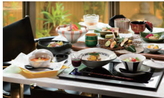
【写真上】客室は全室、異なるテイストの露天風呂&デッキスペース付き。なお、本文中で紹介した本館の「白猿の湯」も利用できる。【写真左】専属ピアニストが毎晩演奏してくれるロビーラウンジ。美しい音色も癒しの源だ。【写真右】山海の幸がどっさりメニューは、毎月内容が変わる。