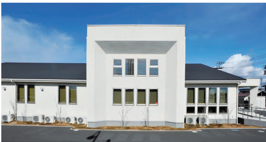
東北でも豊富な医院建築実績を有する三井ホーム。写真は医療法人社団関通会 仙台ペインクリニック石巻分院。