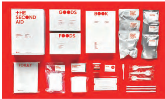
【写真上】もしもの時のロードサービスは、すぐに来てもらえないこともしばしば。たとえ翌日になったとしても、これがあれば安心。【写真左】カーエマは、コンパクトなボックス仕様。外装もなかなかスタイリッシュだ。【写真右】セカンドエイドの中身。小さな箱の中に効率的に詰められているので、この充実度。