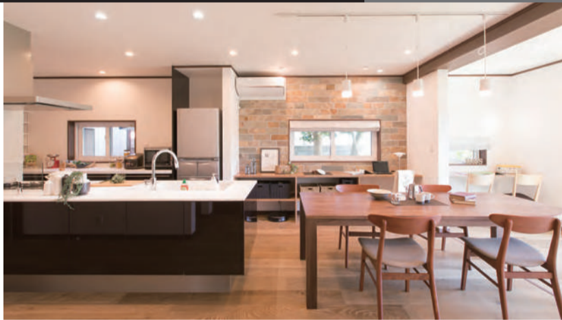
すぐれた美観と機能性を備えるだけでなく、随所に人間的な温かみを感じるのも、北洲のリフォームの特徴だ。

北国にこそ、豊かな住まい文化を一人々の住まいの夢に込めたい。北洲にこそ、地域の家々を「大事に住み継ぐ」という思想を具現化するリフォーム事業は中核とも言える存在だ。室内の温度差を抑え、ダニ・カビ・結露が発生しにくく、空気がきれいな室内。近年はビルダー間の競争の材料として数値化されることが多いが、それと同時に体感的な心地よさを重視するものが、同社の特徴となっている。 無垢材を使用した独自の3層フロア、約40リットル分もの湿度調整を可能にする自慢の塗り壁。単なる化粧直しではなく、見えにくい部分にこだわりを込め、住環境は劇的に変わる。同社では、こうした技術を体感できる見学会を随時開催。東北のリフォームリノベーションの「あるべき姿」を学びとるから始めよう。