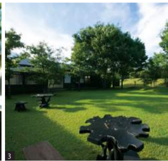
[1-3]美しい緑に囲まれたロケーション。初夏になるとホテルの周りにアザミの花が咲き誇る [4]部会 の喧騒を忘れられる静かな空間。 10棟ある客室はすべてスイートルーム仕様 [5]露天風呂。客室付 きとは思えないほど広々 [6]豊後 牛など大分ならではの食材を使う ディナー(画像イメージ)