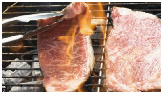
[1]ディナーで用意する、肉10種盛り合わせ(1,200円)。ディナーは肉の種類はもちろん、ソースやサイドディッシュも選べる [2] グリルにはシェフの炭火焼きの技が光る [3] ヒレ肉、ロース肉両方が楽しめるTボーンステーキ(450g / 6,000円) [4]中2階にある最大30名が利用できるロフト。席はソファタイプで、家にいるような心地の良さ

総席数200席、10名用・8名用の個室完備と、利用シーンを選ばない空間で楽しめるディナーはアンガス牛のステーキ(3200円)など定番のビーフはもちろん、チキン、ポーク、ラムとバリエーション豊富。もちろん500、600円台からと手ごろな前菜、サラダなどアラカルトも充実し、 普段使いにも重宝する。この店で感じる心地の良さは、利用者への細やかな心遣いが随所に感じられるからではないか。気取らず、気さくな接客に自然と談笑の輪も広がりそう。 そんな、上質は追求しながらも、肩肘張らずに過ごせるレストランに、この春限定のお得なコースが登場した。フリードリンク120分に、オードブル、肉料理、パスタなどシェフおすすめ7、8品が並び、価格は5000円〜とリーズナブル。大人数でのパーティーにも最適な内容で、7名以上の利用ならスパークリングワイン1本プレゼントなど、特典が付くのもうれしい。もちろん、この時期だけに歓送迎会の利用も大歓迎だ。