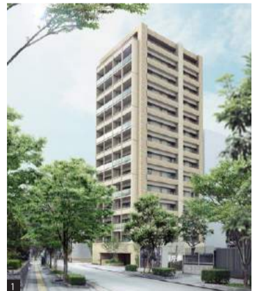
[1]昭和通りと那の津通りの間に建ち、都心ながら静かな環境。最新の設備を備えた舞鶴小・中学校校区と、教育面でも人気の立地だ [2-3]ゆとりある空間が広がるエントランスホール。プロムナードの緑が都心とは思えない空間を演出してくれる。防犯カメラ、オートロック、エレベーターセキュリティといった充実の防犯体制も安心な暮らしをサポート。