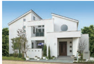
仙台港モデルハウス TEL.022-786-6601 仙台市宮城野区中野3-7-2 「ミヤギテレビ体験ミュージアム「エコノ」内