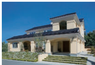
泉ハウジングパーク 紫山モデルハウス TEL.022-377-3134 仙台市泉区紫山1-70-1 「泉ハウジングパーク紫山」内