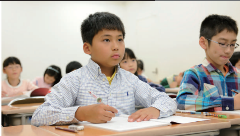
学校よりも早く進行するカリキュラムにも関わらず、「分かる」「できる」を実感。子どもたちの自信に満ちた表情が印象的だ。

中学受験という共通の目標を持った子どもたちが集まり、緊張感と熱気、連帯感に包まれながら、難関突破に挑む。ハイレベルな学習内容で信頼を集める学習塾「能開センター」は、さまざまな学校の生徒が出会い、互いを高め、自ら将来を切り開く力強い人間へと鍛え合う場でもある。同塾は、小学3年生の2月から入学が可能。「有名中学受験コース」では、名門中学に合格するために必要となる基礎を繰り返し学習しつつ、理解力や応用力も同時に磨く。受験対策を徹底する一方で、将来の高校受験をも視野に入れるというハイレベルな学習環境が信頼を集めている。教材の充実度は有名で、講師陣の質も確か。苦手克服しつつ、礼儀や志、思いやりの心までも身に付ける。夏には体験講習を行うので、まずは実際の教室を覗いてみよう。