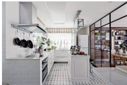
全国に約500名もの建築家、約300名のインテリアコーディネーターとのネットワークから適任者を選出しているオーダーメイドに対応できる点も、三井ホームの魅力。モデルハウスを参考に、理想の住まいを自由に描こう。

色褪せることのない伝統的な外観と洗練されたインテリア、室内をより広く見せるレイアウトと空間設計。名取市の「なとりんくう」モデルハウスを訪ねると、「ここまで美しい家ができるのか」と圧倒されるだろう。外観からつながるレンガのウォールが伝統感と重厚感を醸す玄関からリビングに進むと、中心が大胆にくりぬかれたような吹き抜けと大きな窓に目を奪われる。2階への階段とシームレスにつながるステージが設けられており、横方向だけでなく縦方向の変化も計算に