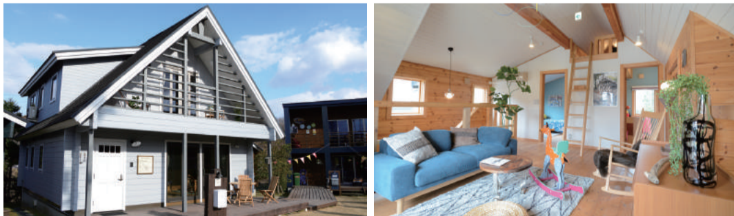
【写真上】空間設計の工夫によって、木の温かみがさらに冴えるのもログハウスの魅力だ。【写真下・左】豊かな自然の中、個性豊かな6つの棟を開設。毎週末は多くの家族姿で賑わっている。【写真下・右】BESSのログハウスは9割以上が自宅用途。モデルハウス内は家族の笑顔が見えるような演出でいっぱいだ。

このBESSの家は、仙台エリアでは「BESS仙台展示場」で体験できる。広々とした敷地内では、計6種類のモデルハウスを公開中。カフェのように洒落たデザインからガレージライクな都市型スローライフタイプ、日本の伝統的な美意識が盛り込まれたジャパネスクタイプ、そして独創性豊かなドームタイプまで、まったく異なるテイストの木の家の数々を、その場で一気に見比べることができる。 また、広い吹き抜けやウッドデッキ、薪ストーブや開放的な土間リビングなど、インテリアのプランも多彩。加えて、実際の生活シーンを感じさせるこだわりのオウジエで彩られるなど、一般的な住宅展示場とはひと味違う雰囲気も実に楽しい。 緑に包まれた周辺の風景は、この時期には特に美しさが際立つ。現在は30周年の記念フェアのほか、週末にはイベントも活発に開催されているので、初夏の爽やかな空気の中で「心豊かな生活」を味わおう。