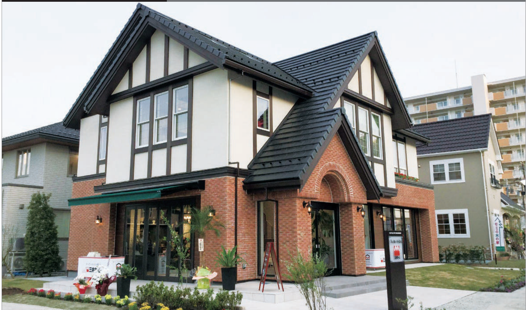
先月、「なとりんくうタウン総合住宅展示場内」にモデルハウスがオープンした「チューダーヒルズ」の外観。眺めるだけでワクワクさせてくれるが、内部はさらにサプライズの連続だ。