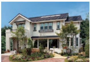
長町モデルハウス TEL.022-393-5931 仙台市太白区長町7-21-5 「TBCハウジングザ・モール仙台長町サイド 緑と風のガーデン」内