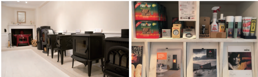
【写真上】北欧スタイルを得意とするデクソン仙台では、クラシックからモダンまでインテリアに合わせた製品を提案可能。【写真下・左】ショールームは「北四番丁」駅から徒歩1分。訪問時は事前に連絡しておくこととスムーズだ。【写真下・右】着火剤やクリーナーなど、ストーブライフの必需品も揃えることができる。

と云え、日本ではまだ特殊な製品とも言えるだけに、どこで購入すればよいのか。モノがモノだけに通販というわけにも行かないし…と迷ったら、青葉区の「デクソン仙台」に出かけよう。暖炉と薪ストーブを中心に、本物志向の商品を多数取り扱っており、もちろん施工も依頼できる。ライフスタイルを踏まえた提案も受けられる専門店として、仙台の暖炉オーナーの間では定番となっているスポットだ。 次の冬に向けての同店のイチ推しは、ノルウェー「ヨール」社の新モデル、「F305」だとか。スタイリッシュなデザインが特徴の薪ストーブ製品で、燃え残った微粒子やガスの約90%を燃焼させてクリーンな排気を実現する先進の「クリーンバーンシステム」を搭載する最新モデルだ。最近の薪ストーブは室内環境への配慮も行き届いているので、安心して導入できる。 デクソン仙台は、メンテナンスまでワンストップで任せられる点も特徴だ。暖炉や薪ストーブは薪の調達や管理方法が重要になるが、同店購入者なら長期的な運用も心配なし。新築はもちろん今の住まいにも設置可能なので、ぜひ相談を。