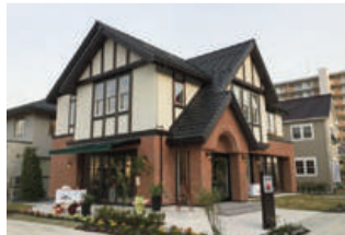
なとりんくうモデルハウス TEL.022-393-5541 名取市杜せきのした1-1-3 「なとりんくうタウン総合住宅展示場」内