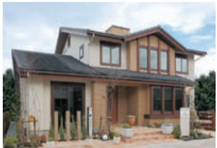
石巻モデルハウス TEL.0225-98-5631 石巻市恵み野3-1-2 「ミヤギテレビ石巻ハウジングストリート 住まいの復興情報館」内