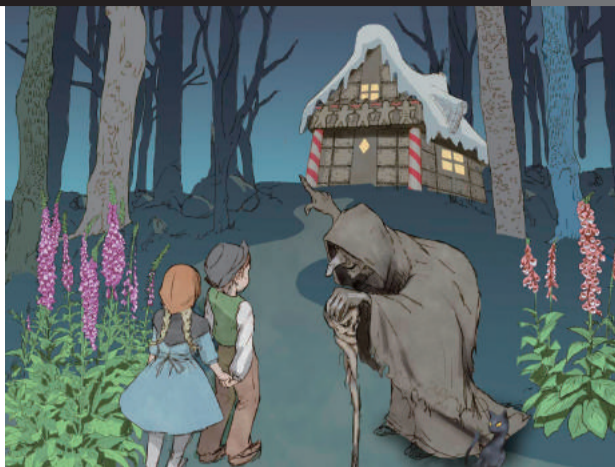
エンゲルベルト・ファンパーディング作曲 オペラ「ヘンゼルとグレーテル」全3幕 日本語上演