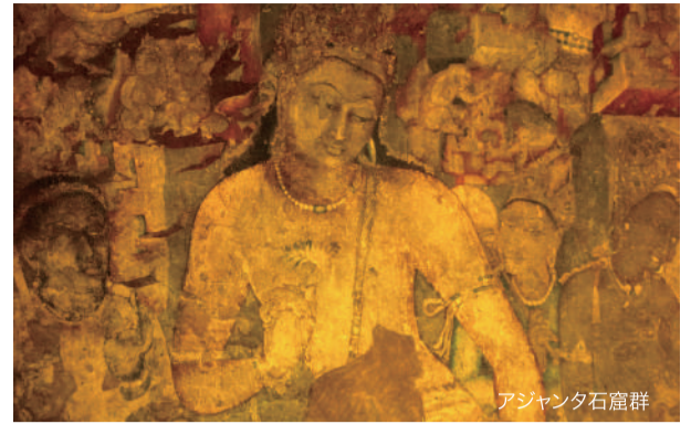
アジャンタ石窟群